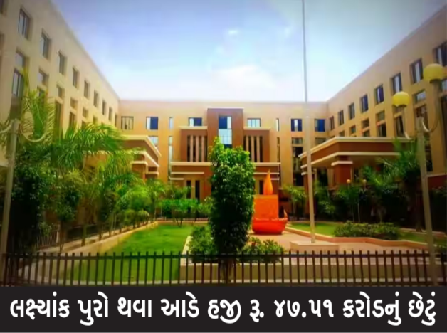
લક્ષ્યાંક પુરો થવા આઠે હજુ રૂ. ૪૭.૫૧ કરોડનું છેડું

રાજકોટ, તા. ૧૯ નાણાકીય વર્ષ પુરું થવા આઠે બાર દિવસ બાકી છે ત્યારે રોજના અંદાજે ચાર કરોડનો વેરો મળે તો જ રૂ.૪૫૫ કરોડનો લક્ષ્યાંક પુરો થાય તેમ છે : આજ સુધીમાં ૪,૪૨,૫૯૦ કરદાતાઓએ રૂ. ૪૦૭.૪૯ કરોડનો વેરો ભરપાઈ કર્યો : ૨૭ હજાર કરદાતાઓએ વ્યાજમાફી યોજનાનો લાભ લીધો હતો. નાણાકીય વર્ષ પુરું થવા આઠે હવે બાર દિવસ બાકી છે ત્યારે રાજકોટ મહાનગરપાલિકાની આર્થિક કરોડજરૂર જેવી વેરા વસુલાત શાખાનો સંઘ આ વર્ષે પણ દ્વારકા પહોંચે એવું લાગતું નથી. ૨૦૨૫-૨૬ના નાણાકીય વર્ષમાં રૂ. ૪૫૫ કરોડના લક્ષ્યાંક સામે આજ સુધીમાં ૪,૪૨,૫૯૦ કરદાતાઓએ રૂ. ૪૦૭.૪૯ કરોડનો વેરો ભરપાઈ કર્યો છે. આ મુજબ હજુ લક્ષ્યાંક સુધી પહોંચવા જ ૪૭.૫૧ કરોડ એકત્ર કરવા પડે તેમ છે. જો રોજના ચાર કરોડ એકત્ર કરી શકાય તો જ આ લક્ષ્યાંક પાર પડી શકે તેમ છે. આ સિવાય કેન્દ્ર અને રાજ્ય સરકારની કચેરીઓ પાસેથી