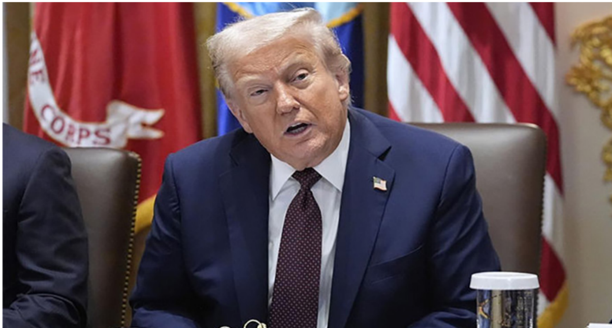
સ્ટ્રેટમાંથી પસાર થવા લાગ્યા હતા. ટ્રમ્પ જ આ વાતની જાણ થઈ હતી. તેમણે એમ વસૂલ કરી રહ્યું છે, જે આવું ન હોતું જોઈએ. ડોનાલ્ડ ટ્રમ્પે કહ્યું કે તેમણે સમાચારમાં જણાવ્યું હતું કે તેમને સમાચારમાં જોયા પછી પણ કહ્યું હતું કે ઈરાન આ માર્ગ પર ટોલ

નવીદિલ્હી, તા. ૨૭ ઈરાન યુદ્ધના ૨૭મા દિવસે, પ્રાદેશિક અને વૈશ્વિક શક્તિઓ કટોકટીમાંથી બહાર નીકળવાના સંભવિત રસ્તાઓ શોધી રહી છે. લશ્કરી તણાવ ઓછો કરવા માટે રાજદ્વારી સંકેતોનો નાજુક મિશ્રણનો ઉપયોગ કરવામાં આવી રહ્યો છે. દરમિયાન, ગુરુવારે, યુએસ પ્રમુખ ડોનાલ્ડ ટ્રમ્પ બીજું એક મહત્વપૂર્ણ નિવેદન આપ્યું. તેમણે દાવો કર્યો કે તેમને ઈરાન તરફથી “ભેટ” તરીકે તેલ ટેન્કર મળ્યા છે. ટ્રમ્પે જણાવ્યું હતું કે ઈરાને યુદ્ધના અંતની વાટાઘાટોમાં તેની ગંભીરતા દર્શાવવા માટે ભેટ તરીકે ૧૦ યુએસ તેલ ટેન્કરોને હોર્મુઝ સ્ટ્રેટમાંથી પસાર થવાની મંજૂરી આપી હતી.