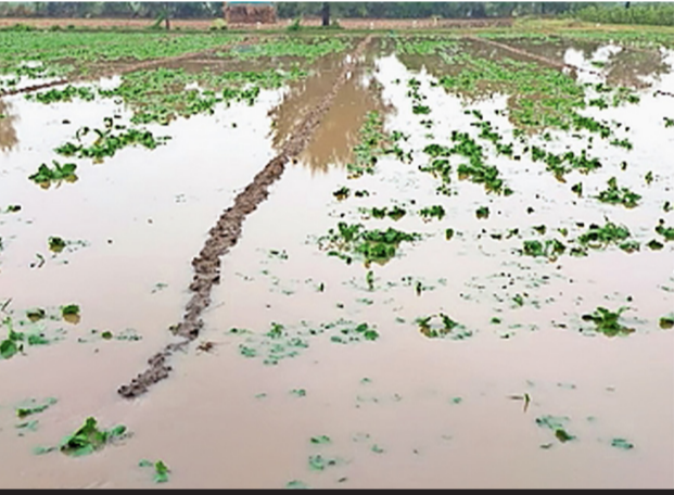
ખેડૂતો માટે આગોતરી ચેતવણી! ૨૯-૩૦ માર્ચે ગાજવીજ સાથેના વરસાદની આગાહી

ગાંધીનગર, તા.૨૬ કુદરતે શું ધારી છે! ભર ઉનાળે ફરી માવઠાની આગાહી! અમદાવાદ સહિત સમગ્ર રાજ્યમાં અત્યારે કાળજાળ ગરમીનો પ્રકોપ જોવા મળી રહ્યો છે, ત્યારે હવામાન વિભાગે ધમધોખતા તાપમાં માવઠાની આગાહી કરી છે. આગામી ૨૯ અને ૩૦ માર્ચ દરમિયાન રાજ્યના વાતાવરણમાં મોટો પલટો આવશે. મહત્વનું છે કે રાજ્યમાં ગત ૧૯ અને ૨૦ માર્ચે આંધી વંટોળ સાથે વરસાદે ઘણા તાલુકાઓમાં કહેર વરસાવ્યો હતો, જેમાં ખેડૂતોના તૈયાર પાકને મોટું નુકસાન થયું હતું. હવામાન ખાતાની આગાહી મુજબ ખાસ કરીને કચ્છ, બનાસકાંઠા, સાબરકાંઠા, અરવલ્લી, દાહોદ અને મહીસાગર જિલ્લાઓમાં ગાજવીજ સાથે કમોસમી વરસાદ પડી શકે છે. આ બે દિવસ માટે 'યલો એલર્ટ' જાહેર કરવામાં આવ્યું છે, જેમાં ૩૦થી ૪૦ ડિગ્રી પ્રતિ કલાકની ઝડપે પવન ફૂંકવાની પણ શક્યતા છે.