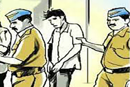
સિસ્ટમ ખરીદવાનું ક્વોટેશન કઢાવતાં ભાવ વધુ લાગતાં મિત્ર સાથે મળી મામો ત્યાંથી લાખોનો સામાન ચોરી લીધો: પારા પોલીસે ભેદ ઉકેલી નાંખ્યો