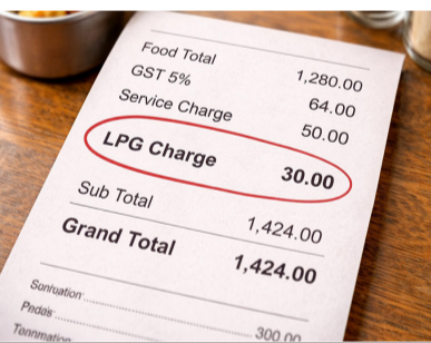
હોટલ-રેસ્ટોરન્ટ્સને સરકારનો કડક આદેશ

નવી દિલ્હી, તા. ૨૬ સેન્ટ્રલ કન્ઝ્યુમર પ્રોટેક્શન ઓથોરિટી (CCPA)એ દેશભરની હોટલો અને રેસ્ટોરન્ટ્સને કડક સૂચના આપી છે કે તેઓ ગ્રાહકના બિલમાં વધારાના ચાર્જ, જેમ કે LPG ચાર્જ, ગેસ ચાર્જ અથવા ફ્યુઅલ કોસ્ટ રિકવરી ઉમેરી શકશે નહીં. CCPA એ આ પ્રથમે ગ્રાહક સુરક્ષા અધિનિયમ, ૨૦૧૯ હેઠળ ‘અનફેર ટ્રેડ પ્રેક્ટિસ’ ગણી છે, જેનું ઉદ્દેશ્ય કરનારાઓ સામે કાર્યદેસરની કાર્યવાહી કરવાની ચેતવણી આપી છે. એટલે કે, જો તમારી સાથે પણ કોઈ રેસ્ટોરન્ટમાં આવું થાય, તો તમે તેની ફરિયાદ કરી શકો છો. CCPA એ કહ્યું કે, કેટલીક હોટલ અને રેસ્ટોરન્ટ્સ ગ્રાહકના બિલમાં મેનુની કિંમત અને લાગુ પડતા ટેક્સ સિવાય વધારાના ચાર્જ વસૂલી રહ્યા છે. આ વર્તન અનૈતિક અને ગેરકાયદેસર છે. CCPA એ સ્પષ્ટ કર્યું છે કે ધંધાધારીઓએ તેમના ઓપરેશનલ ખર્ચને મેનુની કિંમતમાં જ સામેલ કરવા પડશે, તેને અલગથી ગ્રાહકો પર