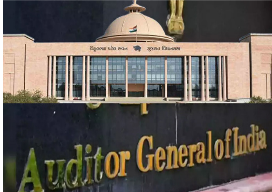
ગાંધીનગર, તા.૨૬ ગુજરાતમાં ૩૧ માર્ચ, ૨૦૨૫ સુધીમાં કુલ ૨૦૦ જેટલા મહત્વના મૂડી કામો પૂર્ણ થવાના હતા, પરંતુ નિર્ધારિત સમયમર્યાદા પૂરી થવા છતાં આ યોજનાઓ અધૂરી રહી છે. આવી ૨૦૦ યોજનાઓ માટે અંદાજે ૨૨૮૧૬.૪૮ કરોડ રૂપિયાના ખર્ચનું આયોજન કરવામાં આવ્યું હતું, જેની સામે અત્યાર સુધીમાં ૧૮૧૪૪.૬૬ કરોડ રૂપિયા ખર્ચાઈ ચૂક્યા છે. આવા અપૂર્ણ કામોમાં સૌથી વધુ હિસ્સો માર્ગ અને મકાન વિભાગનો છે, જેના ૧૬૬ કામો હજુ બાકી છે. આ વિભાગના કામો માટે ૭૯૭૮.૮૫ કરોડ રૂપિયાનો અંદાજ હતો, જેમાંથી ૫૭૪૦.૪૪ કરોડ રૂપિયાનો ખર્ચ કરી દેવામાં આવ્યો હોવા છતાં યોજનાઓ પૂરી થઈ શકી નથી.

૨૫ના નાણાકીય હિસાબોનું ઓડિટ કરવામાં આવ્યું છે, જેમાં કેટલીક ગંભીર ખામીઓ સામે આવી છે. 'કેગ'ના અહેવાલમાં ખાસ નોંધવામાં આવ્યું છે કે, જે યોજનાઓ સમયસર પૂર્ણ થતી નથી તેમાં કરોડો રૂપિયાનું ભંડોળ રોકાયેલું રહે છે, જેના કારણે સરકારી ખર્ચની ગુણવત્તા બગડે છે. આટલા વિલંબને કારણે રાજ્યના નાગરિકોને જે સુવિધાઓ કે લાભો સમયસર મળવા જોઈએ, તેનાથી તેઓ લાંબા સમય સુધી વંચિત રહી જાય છે. આમ, યોજનાઓ અધૂરી રહેવાથી સરકારી નાણાંનો વ્યય થાય છે અને વિકાસની ગતિ પણ ધીમી પડે છે.