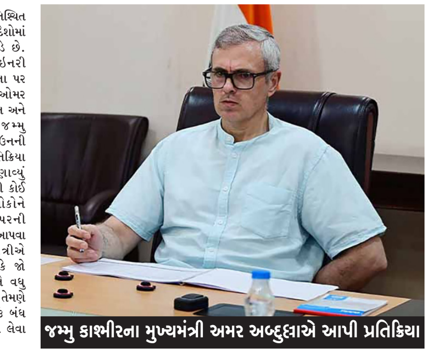
જમ્મુ કાશ્મીરના મુખ્યમંત્રી અમર અબ્દુલ્લાએ આપી પ્રતિક્રિયા

વધુ વણસી રહી તો તેમણે પેટ્રોલ પંપને કામચલાઉ બંધ કરવા જેવા કડક પગલાં લેવા પડી શકે છે. તેમણે વડા પ્રધાન નરેન્દ્ર મોદી દ્વારા બોલાવવામાં આવેલી ઓનલાઈન બેઠકનો પણ ઉલ્લેખ કર્યો. મુખ્યમંત્રીએ કહ્યું કે તેઓ આ બેઠકમાં હાજરી આપશે, જ્યાં ઈરાન અને આસપાસના વિસ્તારોની પરિસ્થિતિ પર ચર્ચા કરવામાં આવશે. તેમણે પુનરોચ્ચાર કર્યો કે દેશભરમાં પેટ્રોલિયમ ઉત્પાદનોની કોઈ અછત નથી. દરમિયાન, ઈરાન મહાનિર્દેશાલયના સંબંધિત મધ્યસ્થી અંગેના પ્રશ્નના જવાબમાં તેમણે કહ્યું કે જો પાકિસ્તાનના ઈરાન અને ઈઝરાયલ સાથે સારા સંબંધો છે અને તે મધ્યસ્થી કરવા માંગે છે, તો કોઈએ વાંધો ઉઠાવવો જોઈએ નહીં. જો પાકિસ્તાનની વાતચીત યુદ્ધને અટકાવી શકે છે, તો તે એક સકારાત્મક પગલું હશે. ગુરુવારે, કેન્દ્ર સરકારે જણાવ્યું હતું કે દેશમાં આશરે ૬૦ દિવસ સુધી ચાલે તેટલો બળતણ ભંડાર છે. પેટ્રોલ, ડીઝલ કે રસોઈ ગેસની કોઈ અછત નથી. સરકારે બળતણની અછત તના અહેવાલોને ગભરાટ ફેલાવવાના હેતુથી ઈરાદાપૂર્વકની ખોટી માહિતી આપતી ઝુંબેશ ગણાવી હતી. પેટ્રોલિયમ અને કુદરતી ગેસ મંત્રાલયે જણાવ્યું હતું કે દેશના તમામ પેટ્રોલ પંપ પાસે પૂરતો સ્ટોક છે. મંત્રાલયે ઉમેર્યું હતું કે ભારત, વિશ્વનો ચોથો અને પાંચમો સૌથી મોટો પેટ્રોલિયમ ઉત્પાદનોનો નિકાસકાર, માળખાકીય રીતે સ્થાનિક