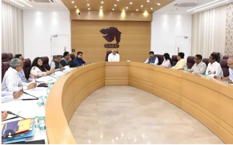
રાજ્યોને વધુ નવા પી.એન.જી. કનેક્શન માટે કરેલી હિમાયતના પગલે રાજ્યમાં નવા કનેક્શન આપવા માટેનું કાર્ય યુદ્ધના ધોરણે હાથ ધરવામાં આવ્યું છે. પાછલા ૧૦ દિવસમાં ૧૨ હજારથી વધુ નવા પી.એન.જી. કનેક્શન અને ૩૦૦થી વધુ નવા કોમર્શિયલ કનેક્શન અપાયાં છે.

મુખ્યમંત્રીઓ અને કેન્દ્ર શાસિત પ્રદેશોના લેફ્ટનન્ટ ગવર્નરો સાથે ગઈકાલે યોજાયેલી વિડીયો કોન્ફરન્સમાં તેમણે આપેલા દિશા-નિર્દેશોના પગલે મુખ્યમંત્રી ભુપેન્દ્ર પટેલની અધ્યક્ષતામાં ગાંધીનગર ખાતે આજે રાજ્યના વરિષ્ઠ સચિવોની બેઠક યોજવામાં આવી હતી. મુખ્યમંત્રીએ આ બેઠકમાં જણાવ્યું કે, હાલના સમયે બધા જ વિભાગોએ સતર્ક રહીને સંકલન સાથે ટીમ વર્કથી કાર્યરત રહી લોકોને આવશ્યક ચીજવસ્તુઓનો સપ્લાય સરળતાથી મળી રહે તે સુનિશ્ચિત કરવાનું છે. આ સંદર્ભમાં તેમણે કહ્યું કે, રાજ્યમાં પી.એન.જી. કનેક્શનને અગ્રતા આપવાની જે માર્ગદર્શિકાઓ કેન્દ્ર સરકારે આપેલી છે તેનો રાજ્યમાં ઝડપી અમલ કરીને નવા પી.એન.જી. કનેક્શન તાકાલિત ધોરણે અપાય તે જરૂરી છે. ખાસ કરીને રહેઠાણ સાથે સાથે શૈક્ષણિક સંસ્થાઓ અને હોસ્પિટલ્સને આવા કનેક્શનમાં અગ્રતા આપવા મુખ્યમંત્રીએ સૂચવ્યું હતું. ગુજરાત દેશમાં સૌથી વધુ ૨૩ ટકા પી.એન.જી. ગેસ કનેક્શન ધરાવતું રાજ્ય છે. આ ઉપરાંત દેશના ૧૨ ટકા સી.એન.જી. ફિલીંગ ઍસ્ટેશન પણ રાજ્યમાં કાર્યરત છે. વડાપ્રધાનને