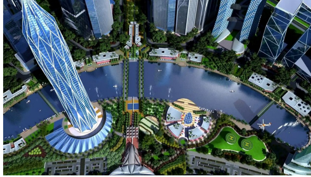
વિસ્તરણ અને ઝડપી વિકાસને સુનિશ્ચિત કરી રહ્યા છે. તેમના નેતૃત્વ હેઠળ, ઈફ્ટસીટીએ ઊંચાઈના નવા શિખરો સર કર્યા છે, જે ભારતના આર્થિક વિકાસના ચાલકબળ તરીકે ગુજરાતની પ્રતિષ્ઠાને મજબૂત બનાવે છે. ઈફ્ટસીટીમાં આજે ૧,૧૫૦ થી વધુ આઈએફએસસીએ-રજિસ્ટર્ડ સંસ્થાઓ કાર્યરત છે.

ગાંધીનગર, તા.૨૮ ગાંધીનગરમાં સ્થિત ગુજરાત ઇન્ટરનેશનલ ફાઇનાન્સ ટેક-સિટી (ઈફ્ટસીટી) ભારતના પ્રથમ સંપૂર્ણ કાર્યરત વૈશ્વિક નાણાકીય અને આઈટી હબ તરીકે ઉભરી આવ્યું છે, જે આંતરરાષ્ટ્રીય નાણાકીય ઇકોસિસ્ટમમાં દેશને અગ્રણી હરોળમાં સ્થાન આપે છે. ગુજરાતના તત્કાલીન મુખ્યમંત્રી અને ભારતના પ્રવર્તમાન વડાપ્રધાન નરેન્દ્ર મોદીના દૂરદેશી નેતૃત્વ હેઠળ સ્થાપિત કરવામાં આવેલ ઈફ્ટસીટી આજે એક સમૃદ્ધ, નીતિ-સંચાલિત અને વૈશ્વિક સ્તરે સીમાચિહ્નરૂપ નાણાકીય કેન્દ્રમાં પરિવર્તિત થયું છે. શરૂઆતથી જ, ઈફ્ટસીટીની પરિકલ્પના એક વિશ્વસ્તરીય ફાઇનાન્સ અને ઈન્ફો ઝોન તરીકે કરવામાં આવી હતી. એક એવું નાણાકીય કેન્દ્ર જે ફક્ત ભારતને જ નહીં પરંતુ સમગ્ર વિશ્વને સેવા પ્રદાન કરશે. વડાપ્રધાન નરેન્દ્ર મોદીના દૂરદેશી નેતૃત્વ હેઠળ એક જ અધિકારક્ષેત્ર હેઠળ નાણાકીય સેવાઓ, ટેકનોલોજી, નિયમનકારી સરળતા અને માળખાગત સુવિધાઓને જોડતી એક સંકલિત ઇકોસિસ્ટમનો પાયો નાખવામાં આવ્યો. તેમનું વિઝન હવે એક જીવંત કેન્દ્રમાં પરિવર્તિત થયું છે જે સ્થાપિત વૈશ્વિક નાણાકીય કેન્દ્રો સાથે સીધી સ્પર્ધા કરે છે. આજે મુખ્યમંત્રી ભુપેન્દ્ર પટેલના નેતૃત્વ હેઠળ ઈફ્ટસીટીની ક્ષિતિજોને વિસ્તૃત કરવામાં આવી રહી છે અને તેઓ એ જ પ્રતિબદ્ધતા સાથે ઈફ્ટસીટીના સાતત્ય,