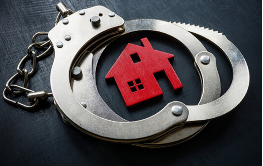
બાકીના નાણાંના સેટલમેન્ટ માટે આરોપીઓએ પોતાની પામ ઝ્હોરી-૪ નામની સ્કીમમાં લેટો આપવાનું નક્કી કર્યું હતું પરંતુ,