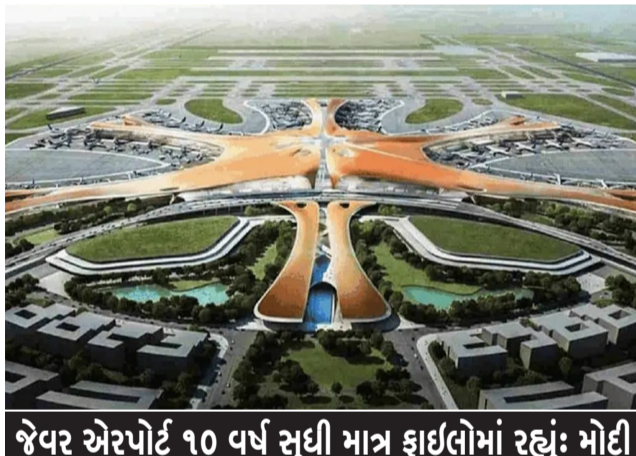
જેવર એરપોર્ટ ૧૦ વર્ષ સુધી માત્ર ફાઇલોમાં રહ્યું; મોટી

નવીદિલ્હી, તા. ૨૮ પીએમ મોદીએ જેવરમાં નોઈડા આંતરરાષ્ટ્રીય એરપોર્ટનું ઉદઘાટન કરતી વખતે કહ્યું કે સમાજવાદી પાર્ટી (SP) એ નોઈડાને તેમની લૂંટ માટે અજબ માં ફેરવી દીધું હતું. પરંતુ આજે, ભાજપ સરકાર હેઠળ, એ જ નોઈડા ઉત્તર પ્રદેશના વિકાસનું એક શક્તિશાળી એન્જિન બની રહ્યું છે. પીએમ મોદીએ કહ્યું કે નોઈડા પહેલા, દેશમાં કલ્કત્તા કરણે ત્યજી દેવામાં આવ્યું હતું, અને અગાઉના