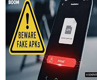
જ કમ્પોએ તેમનો મોબાઈલ હેક કરી લીધો હતો અને બેંક એકાઉન્ટની માહિતી સુધી પહોંચી ગયા હતા. બાદમાં અલગ અલગ ટ્રાન્ઝેક્શન દ્વારા કુલ ૧૪.૦૫ લાખ રૂપિયા વિવિધ ખાતાઓમાં ટ્રાન્સફર કરી લેવામાં આવ્યા હતા. ફરિયાદીએ વોટ્સએપ એકાઉન્ટનો પણ કબ્જો મેળવી લીધો હતો. ટ્રાફિક પોલીસના લોગો સાથે આ અલગ વોટ્સએપ ગ્રુપ બનાવી તેમના સંચાસંબંધીઓને પણ આ જ પ્રકારની એપીકે ફાઈલ મોકલીને વધુ લોકોને ફસાવવાનો -યાસ કર્યો હતો. જો કે તે બાદ છેતરપિંડી થઈ હોવાનું સામે આવતા ફરિયાદીએ સાયબર ક્રાઈમમાં ફરિયાદ નોંધાવી છે. સાયબર ક્રાઈમ દ્વારા ફરિયાદના આધારે વધુ તપાસ હાથ ધરી હતી. બીજી તરફ અન્ય ઠગાઈની વિગતો જોઈએ તો વલસાડ જિલ્લામાં સરકારી દસ્તાવેજોની ખોટી બનાવટ કરી બેન્કને છેતરવાનો ગંભીર કિસ્સો સામે આવ્યો છે. મગદ ગામના માજી

રાજકોટ, તા. ૨૮ રોજરોજ કોઈને કોઈ લોકોને સાયબર ગઠીયાઓ પોતાની જાળમાં ફસાવીને નાણા ઉસેડી લેતાં હોય છે. વધુ એક ઘટના સામે આવી છે જેમાં વધુ એક વખત જુના અને જાણીતા નુસ્ખાનો ઉપયોગ કરાયો છે. ટ્રાફિક ઇ-ચલણના નામે એપીકે ફાઈલ મોકલી ખેડૂતના બેંક ખાતામાંથી ચોંદ લાખ રૂપિયા ઉસેડી લેવાયા છે. બીજી ઠગાઈમાં એક શખ્સે લોન લેવા માટે કાવત્રુ ઘડી નહલી દસ્તાવેજો ઉભા કરી દસ લાખ બાવન હજારની લોન હડપ કરી લીધી હતી. આ કારસો ઘનારો પુર્વ સરપંચનો પતિ હોવાનું સામે આવ્યું હતું. પોલીસે હાલ ગ્રામ પંચાયતના સદસ્ય એવા આ શખ્સની ધરપકડ કરી હતી. પ્રથમ સાયબર ફોડની ઘટના પર નજર કરીએ તો અમદાવાદ પંથકના ખેડૂત તેમાં નિશાન બન્યા છે. સાયબર ઠગાઈનો વધુ એક ચોંકાવનારો બનાવ સામે આવ્યો છે. જેમાં ટ્રાફિક ચલાણના નામે એપીકે ફાઈલ મોકલીને ઇ-ચલણની રામોલ વિસ્તારમાં રહેતા અડતાલીસ વર્ષીય ખેડૂત પોતાના ઘરે હતા, ત્યારે તેમના મોબાઈલ પર અજાણ્યા નંબર પરથી વોટ્સએપ મેસેજ આવ્યો હતો. જેમાં ટ્રાફિક ચલાણ બાકી હોવાનું જણાવી આજે છઠ્ઠી તારીખ છે કહીને એક એપીકે ફાઈલ મોકલવામાં આવી હતી. મેસેજથી ગભરાઈને ફરિયાદીએ ફાઈલ ઓપન કરતા જ તે ગઠીયાની જાળમાં ફસાઈ ગયા હતાં. વધુ માહિતી મુજબ એપીકે ફાઈલ ખોલતા