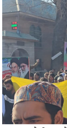
વધારાના પોલીસ દળો તૈનાત કરવામાં આવ્યા છે. મોબાઈલ ઈન્ટરનેટ સ્પીડ હાલમાં ન્યૂનતમ હોવાનું કહેવાય છે. રવિવારે ઈઝરાયલી હુમલામાં ઈરાનના અગ્રણી શિયા નેતા ખામેનીના મૃત્યુ બાદ,

નવીદિલ્હી, તા. ૨ ઈરાનમાં ખામેનીના મૃત્યુ બાદ, જમ્મુ અને કાશ્મીર સહિત ભારતના વિવિધ રાજ્યોમાં વિરોધ પ્રદર્શનો થઈ રહ્યા છે. દરમિયાન, કાશ્મીર ખીણમાંથી મહત્વપૂર્ણ સમાચાર આવી રહ્યા છે. શિયા સમુદાયના મોટા વિરોધ પ્રદર્શનોને પગલે, વહીવટીતંત્રે ખીણમાં શાળાઓ અને કોલેજો બંધ કરી દીધી છે અને પરીક્ષાઓ મુલતવી રાખી છે. શ્રીનગરમાં લાલ ચોકને પણ સીલ કરી દેવામાં આવ્યો છે. વ્યાપક વિરોધ પ્રદર્શનોના જવાબમાં, સરકારે કોઈપણ અશાંતિનો ઝડપથી સામનો કરવા માટે રસ્તાઓ પર મોટી સંખ્યામાં સુરક્ષા દળો તૈનાત કર્યાં છે. વહીવટીતંત્રે લાલ ચોક તરફ જતા તમામ રસ્તાઓ સીલ કરી દીધા છે, જ્યારે શિયા બહુલ વિસ્તારોમાં અનેક સ્તરોની સુરક્ષા તૈનાત કરવામાં આવી છે. આ વિસ્તારોમાં