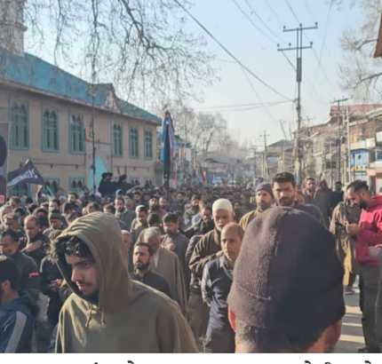
વધારાના પોલીસ દળો તૈનાત કરવામાં આવ્યા છે. મોબાઈલ ઈન્ટરનેટ સ્પીડ હાલમાં ન્યૂનતમ હોવાનું કહેવાય છે. રવિવારે ઈઝરાયલી હુમલામાં ઈરાનના અગ્રણી શિયા નેતા ખામેનીના મૃત્યુ બાદ,

દેશના અન્ય ઘણા રાજ્યોની સાથે કાશ્મીરમાં પણ યુનાઈટેડ સ્ટેટ્સ અને ઈઝરાયલ વિરુદ્ધ વિરોધ પ્રદર્શનો થઈ રહ્યા છે. રવિવારથી શ્રીનગર સહિત રાજ્યના વિવિધ ભાગોમાં શિયા સમુદાયના સભ્યો વિરોધ પ્રદર્શન