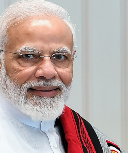
પરિસ્થિતિ અત્યંત ચિંતાજનક : વર્તમાન કટોકટી કક્ત વાતચીત અને રાજદ્વારી પ્રયાસો દ્વારા જ ઉકેલી શકાય

સાથે દ્વિપક્ષીય વાટાઘાટો પછી આ ટિપ્પણી કરી હતી, જે દરમિયાન ભારત અને કેનેડાએ યુરેનિયમ પર ઐતિહાસિક કરાર પર હસ્તાક્ષર કર્યા હતા. વધુમાં, બંને દેશો નાના મોડ્યુલર રિએક્ટર પર સાથે મળીને કામ કરશે, જે નાગરિક પરમાણુ સહયોગને આગળ વધારશે. કેન્દ્રીય પ્રધાન પ્રદલાદ જોશીએ જણાવ્યું હતું કે જ્યારે પણ કમ્પ્લી અને અન્ય ભારતીયો વિશ્વમાં ક્યાંય પણ મુશ્કેલીમાં હોય છે, ત્યારે કેન્દ્ર સરકાર તેમના સુરક્ષિત પરત ફરવાની ખાતરી આપે છે. અગાઉ, અમે યુકેનમાં ફરાર થયેલા નાગરિકોને પણ પાછા લાવ્યા. ભારતીયો જ્યાં પણ હોય, તેમની સલામતી અમારી પ્રાથમિકતા છે. તેમણે ચિંતિત પરિવારોને ખાતરી આપી કે ગભરાવાની કોઈ જરૂર નથી અને સરકાર તમામ ભારતીયોને સુરક્ષિત રીતે પાછા લાવવા માટે પ્રતિબદ્ધ છે. મધ્ય પૂર્વમાં ચાલી રહેલા સંઘર્ષ અંગે, વડા પ્રધાન નરેન્દ્ર મોદીએ શાંતિ અને સંવાદની અપીલ કરી.