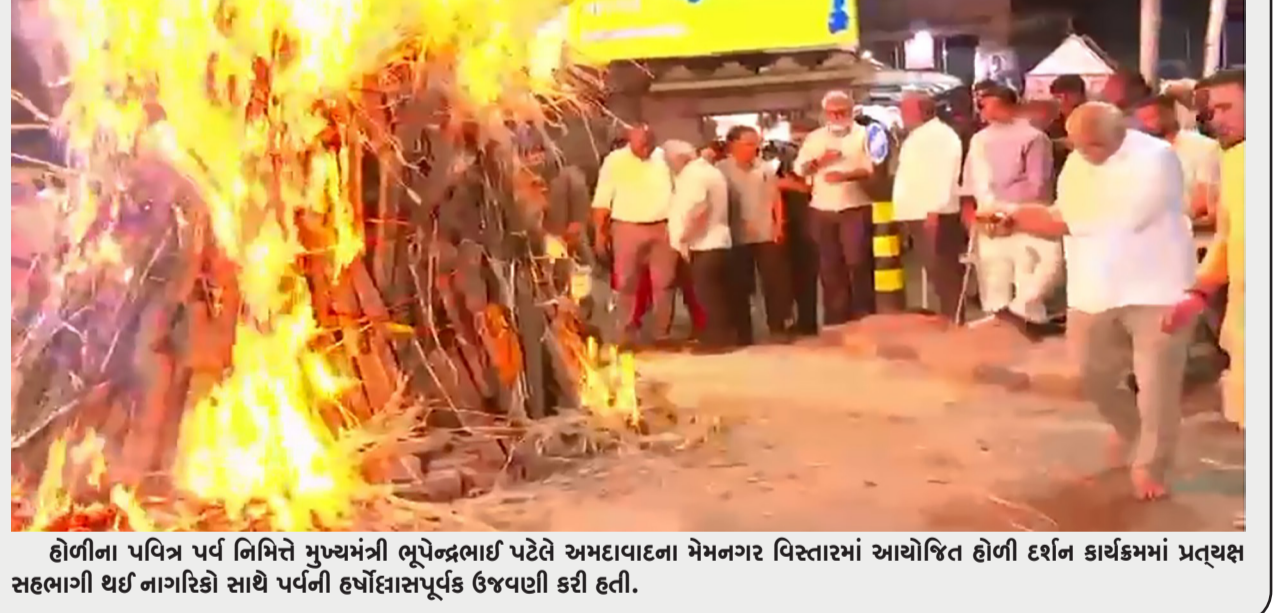
હોળીના પવિત્ર પર્વ નિમિત્તે મુખ્યમંત્રી ભૂપેન્દ્રભાઈ પટેલે અમદાવાદના મેનનગર વિસ્તારમાં આયોજિત હોળી દર્શન કાર્યક્રમમાં પ્રત્યક્ષ સહભાગી થઈ નાગરિકો સાથે પર્વની હર્ષાદાસપૂર્વક ઉજવણી કરી હતી.