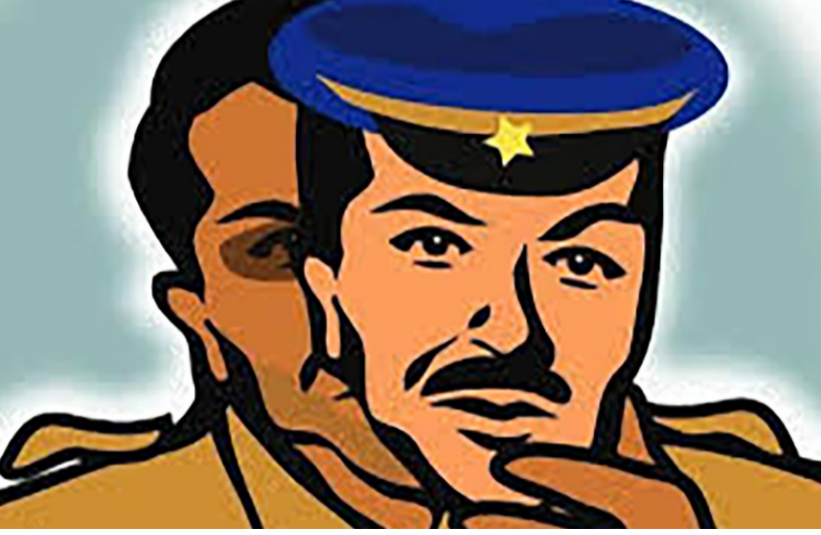
આરોપીની પકડયો હતો પૂછપરછમાં છ લાખ રૂપિયા લીધા હોવાની કબુલાત કરી હતી. જો કે અરજદાર મહિલા સાથે આરોપીનું સમાધાન થયું હતું. પરંતુ આ ઘટનાએ ભારે ચર્ચા જગાવી છે.

યુનિકોર્મ પહેરીને આરોપી આવ્યો હતો અને તેમના પતિના જામીન કરાવી આપવાનું કહીને મહિલા પાસેથી રૂપિયા છ લાખ પડાવી લીધા હતા. મહિલાને નકલી પોલીસ હોવા ની જાણ થતા જાન્યુઆરી મહિનામાં અરજ આપી હતી. વટવાના ગામડી વિસ્તારમાં રહેતી મહિલાએ રામોલ પોલીસ સ્ટેશનમાં ખેડા જિલ્લાના યુવક સામે ફરિયાદ નોંધાવી છે કે મહિલાએ જાન્યુઆરી મહિનામાં રામોલ પોલીસ સ્ટેશનમાં અરજ આપી હતી કે જેમાં ઉલ્લેખ કરાયો છે કે એક વર્ષ અગાઉ પોલીસનો યુનિકોર્મ પહેરીને કાર્ધમ બ્રાંચમાંથી આવું છું કહીને તેમની ઓફિસે આવ્યો હતો. જે તે વખતે મહિલાના પતિ જેલમાં હોવાથી તેના જામીન કરાવી આપીશ તેમ કહીને મહિલા પાસેથી રૂ.૬ લાખ પડાવી લીધા હતા. જેથી મહિલાએ રામોલ પોલીસ સ્ટેશન અને સોશિયલ મીડિયામાં પોતે આપઘાત કરવાની ચીમકી આપી હતી જેથી પોલીસે સીસીટીવી ફૂટેજના આધારે