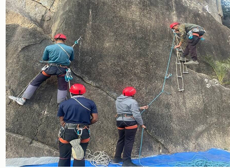
અરજીના મથાળે સ્પષ્ટ લખવાનું રહેશે. અધુરી વિગતવાળી અરજીઓ તથા નિયત સમય મર્યાદા બાદ મળેલી અરજીઓ ધ્યાને લેવામાં આવશે નહીં. તાલીમ કોર્સમાં જોડાવા માંગતા ઉમેદવારોએ આચાર્ય, સ્વામી વિવેકાનંદ પર્વતારોહણ તાલીમ સંસ્થા, ગોમુખ રોડ, માઉન્ટ આબુ, પિનકોડ નં. ૩૦૭૫૦૧ના સરનામે સંપૂર્ણ વિગતો સાથે અરજી મોકલવાની રહેશે. પસંદગી થયેલા તાલીમાર્થીને જરૂરી માહિતી અને સૂચનાઓ તાલીમી સંસ્થા દ્વારા ઈ-મેઇલ, ટેલિફોન દ્વારા જ જણાવવામાં આવશે. આ કોર્સને લગતી વધુ માહિતી માટે સંસ્થાના મોબાઇલ નં. ૬૩૭૭૮૮૦૨૯૮ પર ઓફિસ સમય દરમિયાન જાહેર રજા સિવાય સંપર્ક કરવા, યાદીમાં જણાવવાનું છે.

ગાંધીનગર, તા.૨ રાજ્યમાં આવેલા વિવિધ પર્વતોના શિખરો સર કરવા જેવી સાહસિક પ્રવૃત્તિઓના શોખીન બાળકો તેમજ યુવાઓ માટે રાજ્ય સરકાર દ્વારા નિ:શુલ્ક પર્વતારોહણ તાલીમ શિબિરનું આયોજન કરવામાં આવ્યું છે. જે અંતર્ગત યુવક સેવા અને સાંસ્કૃતિક પ્રવૃત્તિઓ વિભાગ દ્વારા માઉન્ટ આબુની સ્વામી વિવેકાનંદ પર્વતારોહણ તાલીમ સંસ્થા ખાતે નિ:શુલ્ક પર્વતારોહણ કોર્સનું આયોજન કરવામાં આવશે. પસંદગી પામનાર ઉમેદવારોને રહેવા, જમવા અને તાલીમનો કોઈ ખર્ચ ભોગવવાનો રહેશે નહીં. આ ઉપરાંત વતનથી તાલીમી સંસ્થાના સ્થળે આવવા-જવા માટે જીસ બસ અથવા રેલ્વે સેકન્ડ ક્લાસનું ભાડું પણ મળવાપાત્ર થશે. પર્વતારોહણ તાલીમ શિબિર અંતર્ગત એડવેન્ચર કોર્સ તા. ૯ થી ૧૫ મે, ૨૦૨૬ સુધી યોજાશે. જેમાં ૮ થી ૧૩ વર્ષની વય ધરાવતા યુવક-યુવતીઓ ભાગ લઈ શકશે. ઉપરાંત એડવેન્સ રોક ક્લાઇમ્બિંગ કોર્સ તા. ૧૮મી મે થી ૧ જૂન, ૨૦૨૬ સુધી યોજનાર છે. આ કોર્સમાં ભાગ લેવા ઇચ્છુક ૧૫ થી ૪૫ વર્ષના ઉમેદવારોએ ઉપરોક્ત સંસ્થા તથા તેના પેટા કેન્દ્રો ખાતે બેઝિક ખડક ચઢાણ કોર્સ એ અથવા બી ગ્રેડ સાથે પાસ કરેલો હોવો જોઈએ. આ ઉપરાંત તા. ૯ મે થી ૭ જૂન, ૨૦૨૬ સુધી યોજનાર કોર્સિંગ રોક ક્લાઇમ્બિંગ