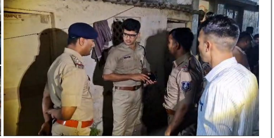
તાત્કાલિક પોલીસને જાણ કરી દેતા ઝોન - વન તેમજ ટુ ના એસીપી-ડીસીપી પોલીસના મોટા કાફલા સાથે ઘટના સ્થળે પહોંચી ગયા હતા અને જાહેરમાં ઝડપી