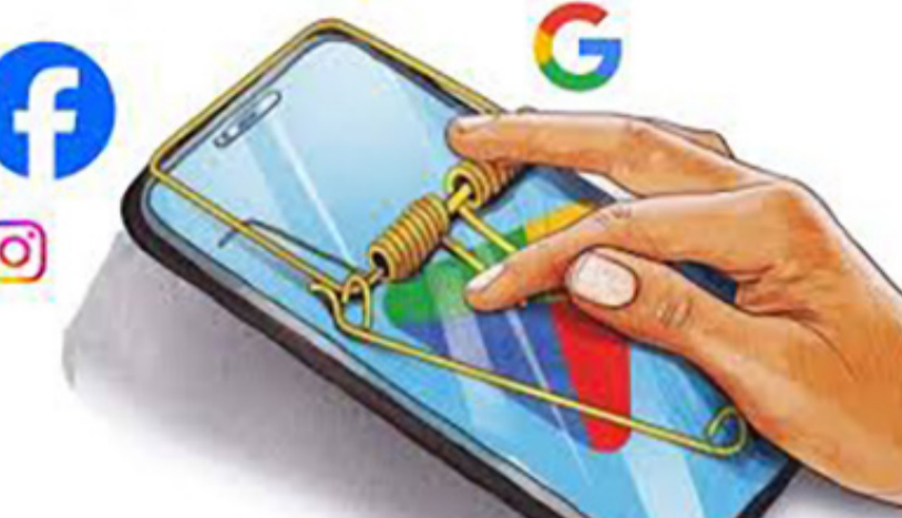
અન્ય કિસ્સામાં લોનના નામે પયાસથી વધુ લોકો સાથે લાખોની ઠગાઈ