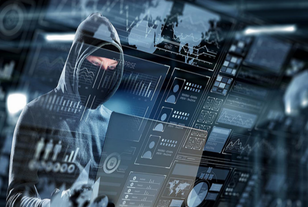
યુવાને પૈસા ચુકવવા ટ્રાન્ઝેક્શન કર્યું ત્યારે ખબર પડી કે ભેંસ નથી: બેંકે જઈ તપાસ કરતાં ફોંડ ધયાની ખબર પડી

રાજકોટ,તા.૭ સાયબર ગઠીયાઓ રોજબરોજ ઓનલાઇન શિકાર બનાવી લોકોને છેતરી લાખો ઉંચેરી લેતાં હોય છે. વધુ એક ઘટના સામે આવી છે જેમાં યુવાને ભેંસ ખરીદવા માટે લીધેલી લોનની રકમ તેના ખાતામાં જમા થઈ હતી તે રકમ બારોબાર ઉપડી ગઈ હતી. ગજબની આ સાયબર ફોંડની ઘટનાની પોલીસે તપાસ શરૂ કરી છે.