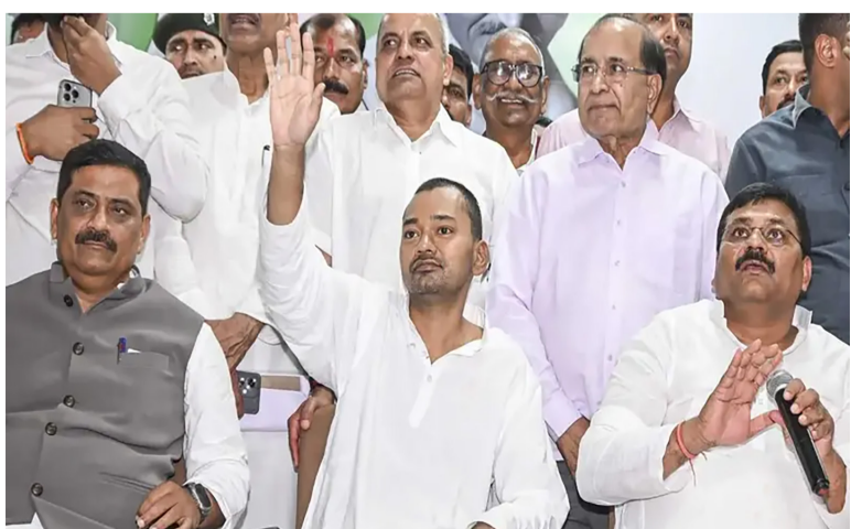
રાજકોટ, તા. ૮ રાજ્યના રાજકીય વર્તુળોમાં છેલ્લા કેટલાક દિવસથી ચર્ચાનો વિષય બની રહેલો સમય આખરે આવી ગયો છે. રાજકીય વર્તુળોમાં એવી અટકળો ચાલી રહી હતી કે મુખ્યમંત્રી નીતિશ કુમારના પુત્ર નિશાંત કુમાર તેમની રાજકીય કારકિર્દી શરૂ કરશે, અને રવિવારે, નિશાંત કુમારે રાજ્ય જેડીયુ કાર્યાલયમાં પોતાનું રાજકીય પદાર્પણ કર્યું. પાર્ટીના રાષ્ટ્રીય કાર્યકારી અધ્યક્ષ સંજય ઝાંઝે નિશાંત કુમારને પાર્ટીમાં સામેલ કર્યાં. કેન્દ્રીય મંત્રી લક્ષ્મણ સિંહ, પાર્ટીના બિહાર રાજ્ય પ્રમુખ ઉમેશ કુશવાહા, બિહાર સરકારના મંત્રી શ્રવણ કુમાર અને લેસી સિંહ, અસંયોગ અગ્રણી અને અગ્રણી નેતાઓ અને મોટી સંખ્યામાં સમર્થકો આ પ્રસંગે હાજર રહ્યા હતા.

કાર્યાલયમાં પોતાનું રાજકીય પદાર્પણ કરતા કહ્યું નીતીશકુમાર પર બિહારને ગૌરવ