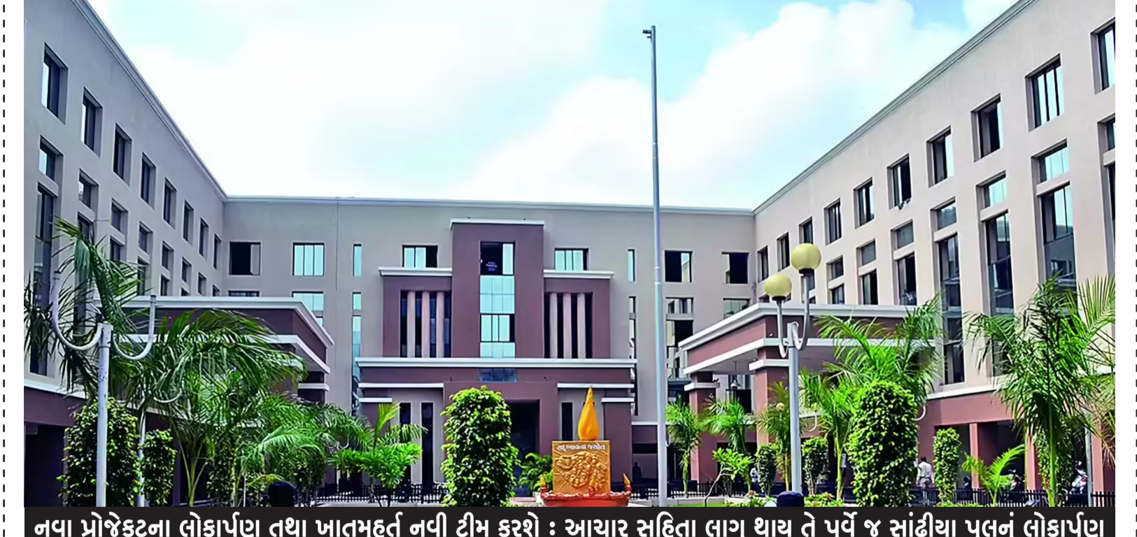
નવા પ્રોજેક્ટના લોકાર્પણ તથા ખાતમુહૂર્ત નવી ટીમ કરશે : આચાર સહિતા લાગુ થાય તે પૂર્વે જ સાંઘીયા પુલનું લોકાર્પણ

રાજકોટ, તા. ૮ મહાનગરપાલિકાની ચૂંટણી અને ખાસ તો જિલ્લા પંચાયતની ચૂંટણીને લઈને અનેકવિધ અટકળો હવે સમયને લઈને ચાલી રહી છે ત્યારે જોવાનું એ રહ્યું કે ક્યારે ચૂંટણી જાહેર થાય. બીજા સૌથી મોટી વાત તો એ છે કે હાલ ૧૧ તારીખથી વહીવટદાર શાસન લાગુ પડી જશે અને જે વાતની અપેક્ષા હતી કે ટર્મ પૂરી થયા ના બે કે ત્રણ દિવસ બાદ વહીવટદાર શાસન લાગુ થાય પરંતુ તે અટકળો પણ પૂર્ણ થઈ ચૂકી છે અને રાજકોટના ભૂતપૂર્વ કલેક્ટર રમ્યા મોહનને સરકારે વહીવટદાર તરીકે નિમ્ણા છે. પરંતુ હવે જે લોકહિતના જે કામો હશે તે જે ટેન્ડર પ્રક્રિયા હાથ ધરવામાં આવે તે પ્રકારની કોઈ કામગીરી હશે તે હવે નહીં થાય કારણ કે આચાર સહિતા લાગુ થતાની સાથે જ માત્ર વહીવટી પ્રક્રિયાને વહીવટી કામગીરી હાથ ધરવામાં આવશે. પરિણામ સ્વરૂપે પ્રવર્તમાન નગર સેવકો તથા પદ અધિકારીઓ દ્વારા ઘણા ખરા કામો હાથ ધરવામાં આવ્યા હતા અને તેના લોકાર્પણ પણ કરી દેવામાં આવ્યા. રાજકીય વર્તુળોના જણાવ્યા અનુસાર મહાનગરપાલિકાની ચૂંટણી તારીખો જાહેર કરવામાં આવે તે સમયથી જ આચાર સહિતા લાગુ થઈ જશે હાલ ૨૫ એપ્રિલ એટલે કે એપ્રિલના છેલ્લા સપ્તાહમાં ચૂંટણીઓ યોજાઈ તેવી હાલ શક્યતાઓ સેવાઈ