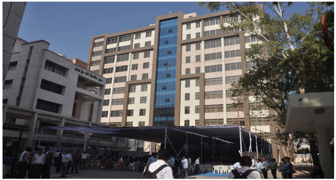
અને ૨૦૧૧ના રોજ બેન્કને જનરલ ગેરંટી એકઝીક્યુટ કરી આપેલ. જેમાં કલોઝ નંબર આઠમાં લીયનની ટર્મ્સ નક્કી કરવામાં આવેલી છે. ફરિયાદી સિદ્ધિવિનાયક કાર્મ ફેશ પ્રાઇવેટ લિમિટેડ કંપનીમાં ડિરેક્ટર અને ગેરંટર તરીકે પણ છે અને આ કંપની પાસે ૨૦૨૦ના રોજ રૂ. ૧૧.૩૯ કરોડની મોટી રકમ બાકી પડે છે અને જે અન્વયે સરકેસી

રહેવા ગયેલ. પરંતુ ફરિયાદીના પતિને અને ફરિયાદીને મતભેદ થતાં હાલ ફરિયાદી તેના માતા પિતાના ત્યાં રહેવા આવેલ છે. ફરિયાદીના એકાઉન્ટમાં રૂ. ૫,૬૩,૩૩૦/- જેટલી રકમ જમા છે અને આ રકમ પૈકીની રકમ રૂ. ૫,૧૬,૮૫૭ અને ૫૮ પૈસા લાઈફ ઇન્સ્યોરન્સના બેન્ક એકાઉન્ટમાં જમા થયેલ છે અને તે રકમ ઉપાડવામાં માંગતા હોય. પરંતુ ફરિયાદીનું એકાઉન્ટ ઓપરેટ કરવા દેવામાં આવતું નથી અને ફીઝ થઈ ગયેલ છે, તેવું જણાવેલ છે. જેથી ફરિયાદીએ ૨૦૧૮ના રોજ સામાવાળાને નોટીસ આપેલ. સામાવાળા બેંક તરફે એડવોકેટ શ્રેયસ દેસાઈ હાજર થયેલા, એડવોકેટ શ્રેયસ દેસાઈની રજૂઆત એવી હતી કે, સિદ્ધિવિનાયક કાર્મ ફેશ પ્રાઇવેટ લિમિટેડ કંપની નામની એક કંપનીએ બેન્ક ઓફ બરોડા પાસેથી મેળવેલી લોનમાં આ કામના ફરિયાદી ગેરન્ટર થયેલા