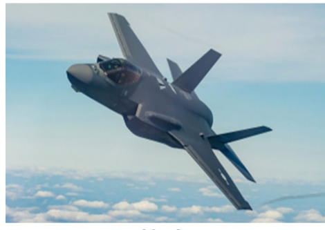
નવીદિલ્હી, તા. ૩

જેટના પાયલટને બંધક બનાવ્યાનો અહેવાલ : F-35 જેટને તોડી પાડનાર ઈરાન વિશ્વનો પ્રથમ દેશ