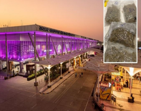
આવતા અધિકારીઓ પણ ચોંકી ઉઠ્યા હતા. ટ્રોલી બેગની અંદરથી ૮ જેટલા વેક્યુમ-સીલ કરેલા પ્લાસ્ટિક પેકેટ મળી આવ્યા હતા. તપાસ દરમિયાન આ પેકેટ્સમાંથી લીલા રંગનો શંકાસ્પદ પદાર્થ મળી આવ્યો હતો. FSL ટેસ્ટ બાદ પુષ્ટિ થઈ હતી કે આ ઉચ્ચ ગુણવત્તાનો હાઈબ્રિડ ગાંજો છે. ૨.૨૫ કિલો હાઈબ્રિડ ગાંજોની કિંમત ર કરોડ રૂપિયાથી વધુ છે.

અમદાવાદ, તા.૩ અમદાવાદના સરદાર વલ્લભભાઈ પટેલ ઈન્ટરનેશનલ એરપોર્ટ પરથી ડ્રગ્સની હેરાફેરીનો વધુ એક મોટો કિસ્સો પ્રકાશમાં આવ્યો છે. ડિરેક્ટોરેટ ઓફ રેવન્યુ ઇન્ટેલિજન્સ (DRI) અને એર ઇન્ટેલિજન્સ યુનિટ (AIU)એ સંયુક્ત કાર્યવાહી કરીને બેંગકોકથી અમદાવાદ આવેલા બે શખસો પાસેથી કરોડો રૂપિયાની કિંમતનો નશીલો પદાર્થ જમ કર્યો છે. મળતી માહિતી અનુસાર, એરપોર્ટ સુરક્ષા એજન્સીઓને અગાઉથી જ નશીલા પદાર્થની હેરફેર અંગે બાતમી મળી હતી. આ બાતમીના આધારે વિધેટ જટ એરલાઇન્સની ફ્લાઇટ દ્વારા બેંગકોકના ડોન મુઆંગ એરપોર્ટથી અમદાવાદ ઉતરેલા બે શખસો પર વોચ રાખવામાં આવી હતી. મુસાફરો એરપોર્ટ પર ઉતરતા જ તપાસ સંસ્થાઓએ તેમની અટકાયત કરી હતી. શંકાસ્પદ મુસાફરોના સામાનની સઘન તપાસ કરવામાં