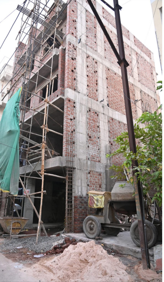
મનપામાં ચાલતા બેફામ ભ્રષ્ટાચારની ગંગોત્રી એટલે ટાઉન પ્લાનિંગ શાખા ખુલી જાય છે.