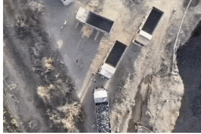
સાચલાના સુદામડા પંથકમાં લાંબા સમયથી બ્લેક ટ્રેપ પથ્થરની ખાણોમાં કોઈ પણ જાતની મંજૂરી વગર ખોદકામ થતું ખોદકામ અને પરિવહન માટે વપરાતા પાઝ્યા હતા. જેમાં સુદામડા વિસ્તારમાંથી બ્લેક ટ્રેપ પથ્થરની ૫ જેટલી ખાણોમાં ગેરકાયદે ખનનની પ્રવૃત્તિ ચાલતી હતી. આ કામગીરી દરમિયાન માત્ર દંડ જ નથી ફટકારાયો, પરંતુ ઘટનાસ્થળેથી ગેરકાયદે ખોદકામ અને પરિવહન માટે વપરાતા ૩૩ ડમ્પરો તેમજ પથ્થરો તોડવા માટેના ૧૩ ભારે મશીનો જમ કરવામાં આવ્યા છે. તંત્રએ ખોદકામ કરનારા તત્ત્વો સામે માત્ર દંડનીય કાર્યવાહી જ નથી કરી, પરંતુ તમામ જવાબદારોને કારણદર્શક નોટિસ ફટકારી છે. નોટિસમાં સ્પષ્ટ જણાવવાનું છે કે, 'આગામી ૧૫ એપ્રિલના રોજ તમામ જરૂરી આધાર-પુરાવાઓ સાથે ઝૂમરૂ હાજર રહેવું. જો સંતોષકારક પુલાસો કે પુરાવા રજૂ નહીં કરવામાં આવે તો તંત્ર દ્વારા વધુ ૩૩૬ કાનૂની શહે કાર્યવાહી કરવામાં આવશે.' આમ, તંત્રની કાર્યવાહીથી ખનિજ માફિયાઓમાં દોડધામ મચી ગઈ છે.