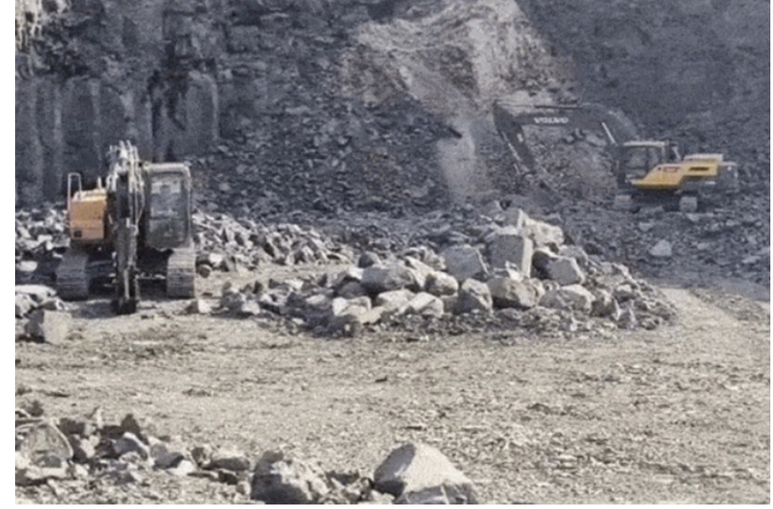
ખાણ-ખનિજ વિભાગે સાચલા તાલુકાના સુદામડા વિસ્તારમાં સપાટો બોલાવ્યો છે. જેમાં ઘણાં સમયથી ચાલતા બ્લેક ટ્રેપ પથ્થરના ગેરકાયદે કાળોબાર પર ત્રાટકેલા તંત્રએ ૫ ખાણોમાં ખોદકામ બાબતે પલ્પ કરોથી વધુનો દંડ આંકવામાં આવ્યો છે, ત્યારે ખનિજ માફિયાઓમાં ફફડાટ વ્યાપી ગયો છે. લીંબડી ડીવાયએસપી અને ખનિજ વિભાગના સંયુક્ત ઓપરેશનમાં તેત્રીસ ડમ્પર અને તેર મશીનો સીઝ કરવામાં આવ્યા છે.