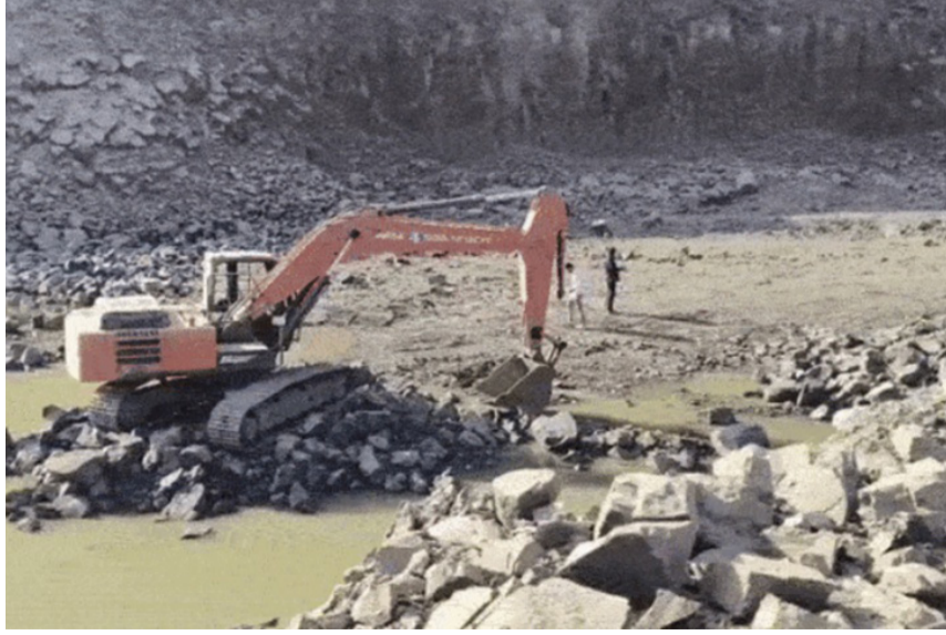
રાજકોટ, તા.૩ સુરેન્દ્રનગરના થાન, મુળી સહિતના અનેક વિસ્તારોમાં મોટાપાયે ગેરકાયદે ખનન કરાતું હોવાની વ્યાપક ફરિયાદો બાદ તંત્રએ જાગીને મસમોટી ખનીજ ચોરી પકડી પાડી છે.

મોટાપાયે ગેરકાયદે ખનન કરતા ૧૩ મશીનો, ૩૩ ડમ્પર જમ : ખનીજચોરોમાં દોડધામ