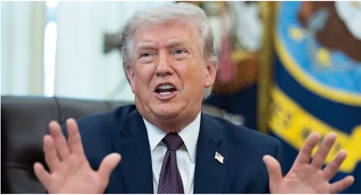
નવીદિલ્હી, તા. ૩ અમેરિકાના રાષ્ટ્રપતિ ડોનાલ્ડ ટ્રમ્પે શુક્રવારે કહ્યું હતું કે જો અમેરિકા ઇચ્છે તો તે હોર્મુઝની સામુદ્રધુની ખોલી શકે છે અને ઈરાનનું તેલ છીનવી શકે છે. ટ્રમ્પે કહ્યું હતું કે જો અમેરિકા પાસે વધુ સમય હોય તો તે આમ કરી શકે છે. તેમણે પોતાના સોશિયલ મીડિયા પ્લેટફોર્મ, ટ્વિટ્સ પર લખ્યું હતું કે, "જો આપણી પાસે થોડો

ટ્રમ્પે ફરી ઈરાનું કૂડ ઓઈલ જમ કરવાની આપી ધમકી : સુરક્ષા અંગે ઉઠાવ્યા સવાલ