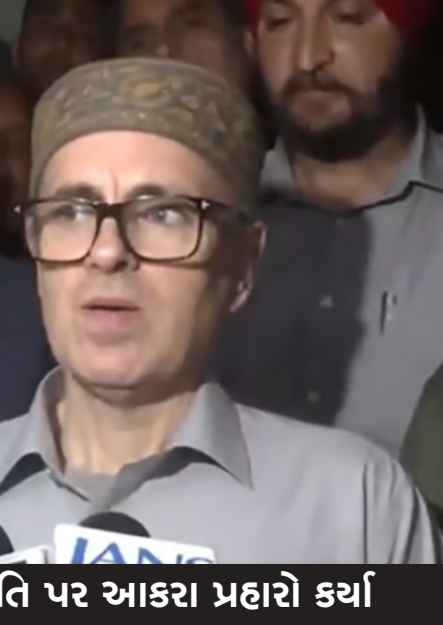
ઓમર અબ્દુલાએ અમેરિકન રાષ્ટ્રપતિ પર આકરા પ્રહારો કર્યા

નિયંત્રિત કરવાની જરૂર છે જેથી તે લેબનોન પર હુમલો ન કરે. તેમણે દ્રમ્પની ભાષા પર પણ સવાલ ઉઠાવતા કહ્યું કે આવી ભાષાનો ઉપયોગ રાષ્ટ્રપતિને શોભતો નથી. તે કોઈને શોભતો નથી. ઓમર અબ્દુલાએ કહ્યું, નક્કરબે તાજેતરમાં કહ્યું હતું કે અમેરિકન રાષ્ટ્રપતિના નિવેદનો અસ્પષ્ટ છે. મને લાગે છે કે તેઓ પોતે જાણતા નથી કે તેઓ શું કી રહ્યા છે. તેઓ સવારે એક વાત કહે છે, બપોરે બીજી વાત કહે છે અને સાંજે ત્રીજી વાત કહે છે. હું કહું છું કે તેઓ જે પ્રકારની ભાષા વાપરે છે તે કોઈને શોભતી નથી, અમેરિકન રાષ્ટ્રપતિને તો છોડી દો. જ્યારે