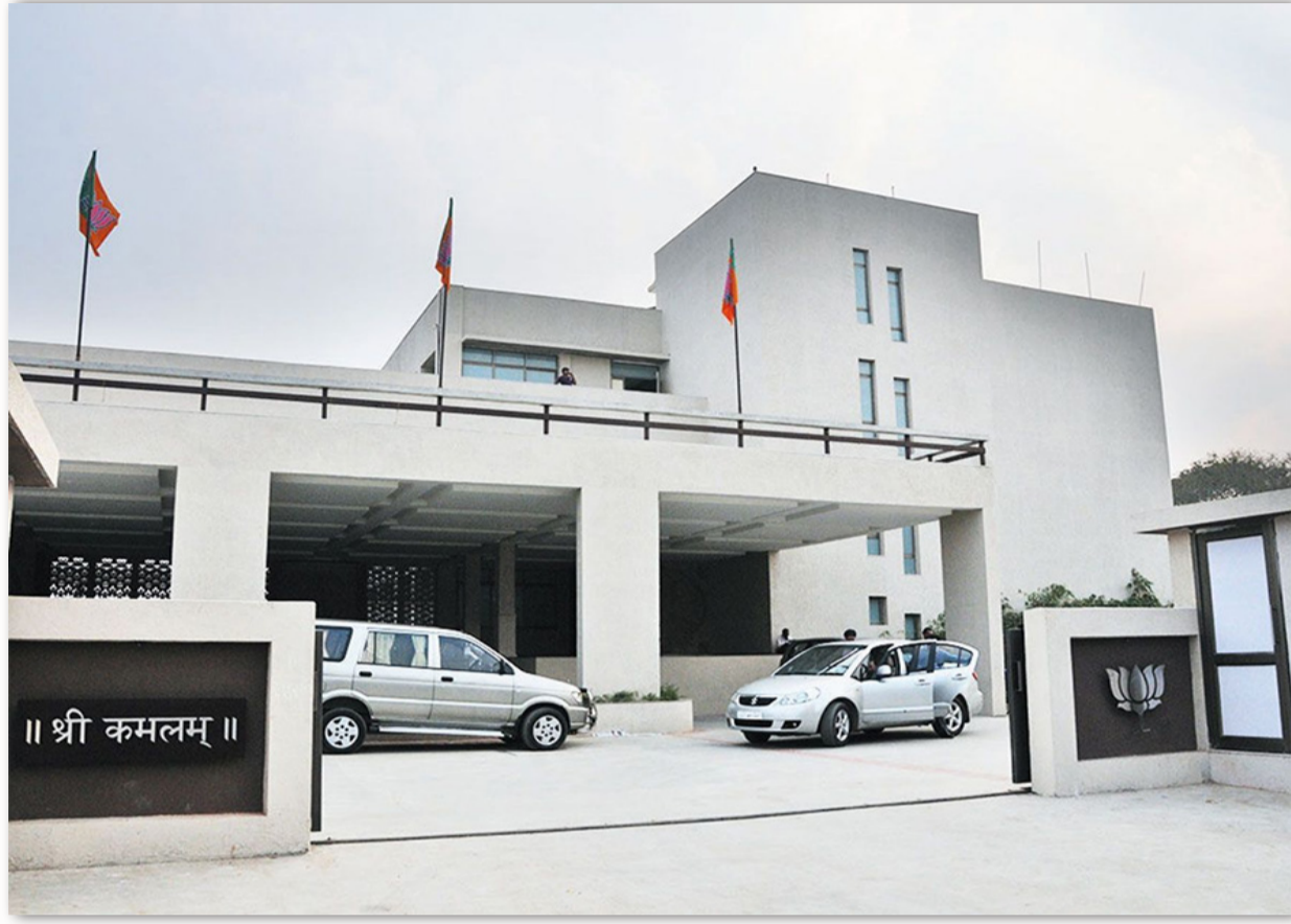
રાજકોટ, તા. ૯ સ્થાનિક સ્વરાજની ચૂંટણીને લઈ અને જિલ્લા પંચાયતની બેઠકો માટે પોતાના ગુજરાતમાં તમામ પક્ષો પ્રચાર કરી રહ્યા છે. ત્યારે આમ આદમી પાર્ટી અને કોંગ્રેસ તબક્કાવાર નગરપાલિકા, મહાનગરપાલિકા, તાલુકા ગાંધીનગરમાં ભાજપની બેઠકનો ધમધમાટ ઉમેદવારોની જાહેરાત કરી રહ્યું છે. ત્યારે સેન્સ પ્રક્રિયા બાદ હવે ભાજપે પણ પોતાના ઉમેદવારો જાહેર કરવાની શરૂઆત કરી છે. ગાંધીનગરમાં ભાજપની બેઠકનો ધમધમાટ શરૂ થયા બાદ ઉમેદવારો જાહેર કરવાની શરૂઆત થઈ છે. ભાજપે સુરેન્દ્રનગર

સુરેન્દ્રનગર, અરવલ્લી, વડોદરા તથા વાવ થરાદની નગરપાલિકા તથા જિલ્લા પંચાયતની બેઠકો માટે નામો જાહેર