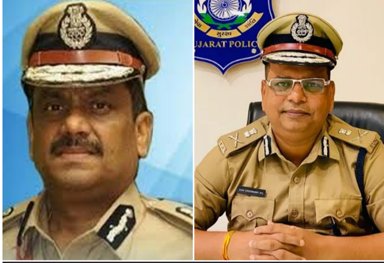
૧૫ એપ્રિલ સુધી ચાલનાર આ અભિયાનને મુખ્ય ત્રણ તબક્કાઓ સાથે ૭ પેટા તબક્કામાં શ્રેણીબદ્ધ ચર્ચાઓ, અભ્યાસ બાદ આ બંને સિનિયર ઈંડેજ દ્વારા વહેંચી દેવાયું છે...

અને બાળકોને. અભિયાન ત્રણ તબક્કામાં વહેંચાયેલું છે. જ પ્રથમ તબક્કા: ઈન્ટેલિજન્સ એક્ટીવેશન બસ, રેલવે સ્ટેશન, ઈટ ભૂકા, મસાજ પાર્લર જેવા સંવેદનશીલ સ્થાનોની માહિતી જુટાવવી. બીજો તબક્કામાં ઓકસ, પ્લેસમેન્ટ જ એજન્સીઓ અને મજૂર કોન્ટ્રેક્ટરોની લિસ્ટ તૈયાર કરવી. ત્રીજામાં હોટસ્પોટ્સ પર છાપા મારીને પીડિતોને મુક્ત કરાવવા અને મુખ્ય તડિકકર્સને ધરપકડવા. તેમજ મુખ્ય તસ્કરી કરનારાઓની ધરપકડ, બેંક ખાતાઓને ફીઝ કરવા, અને પીડિતોને મનોવૈજ્ઞાનિક સહાય પૂરી પાડવી. પોલીસ મહાનિદેશક ડો. કે.એલ.એન.રાવ અને અપર પોલીસ મહાનિદેશક અજય ચોધરીના માર્ગદર્શન હેઠળ સમગ્ર અભિયાન ચલાવશે તેમજ ચાઈલ્ડ વેલફેર કમિટી અને નોન-પ્રોગવર્નમેન્ટલ સંગઠનોની મદદ લેવામાં આવશે, જેમાં મનોવૈજ્ઞાનિક કાઉન્સેલિંગ પણ સામેલ હોવાનું જાહેર કરાયું છે.