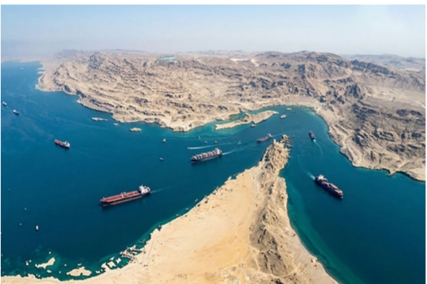
એપ્રિલની મંત્રણામાં પણ હાજર ન રહેવાની વકી