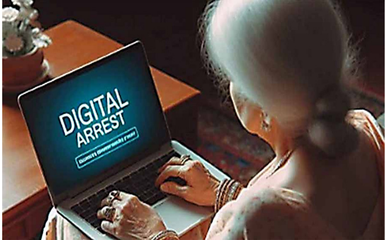
તમારા આધારકાર્ડ પરથી નવું સિમ કાર્ડ લેવામાં આવ્યું હતું અને તેનો ઉપયોગ ન્યુઝ ફોટા વિડિયો અપલોડ કરી પૈસા કમાવવા માટે ક્રાયો, જેથી તમારા વિરુદ્ધ મુંબઈ ખાતે ફરિયાદ નોંધાઈ હોવાનું કહી ફસાવ્યાં

‘તમારું આધારકાર્ડ સાયબર આતંકવાદના ગંભીર ગુનાઓમાં ઉપયોગમાં થયો હોવાનો 52 બતાવી ભેજાબાજોએ વૃધ્ધાને ખંખેર્યા