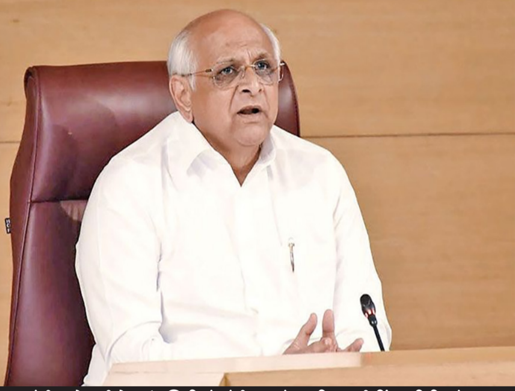
મુખ્યમંત્રી ભૂપેન્દ્રની પ્રેક્ષક ઉપસ્થિતિમાં ગાંધીનગરમાં વન વિભાગની ચિંતન શિબિરનું સમાપન

વડાપ્રધાન નરેન્દ્રભાઈ મોદીએ શરૂ કરેલા પર્યાવરણ સંરક્ષણ-સંવર્ધનના વિવિધ અભિયાનોના પરિણામે છેલ્લા ૧૨ વર્ષમાં રાજ્યમાં વન વિસ્તાર બહારના વૃક્ષોની સંખ્યામાં ૪૭ ટકાનો વધારો થયો: - મુખ્યમંત્રી