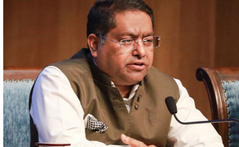
કતાર ભારત માટે ઊર્જાનો મહત્વનો સપ્લાયર : કેન્દ્રનું મોટું નિવેદન

નવી દિલ્હી, તા.૧૦ વૈશ્વિક સ્તરે બદલાતા ભૌગોલિક-રાજકીય સમીકરણો વચ્ચે ભારત પોતાની ઊર્જા સુરક્ષા અને પ્રાદેશિક શાંતિ માટે સક્રિય બન્યું છે. મિડલ ઈસ્ટમાં વધી રહેલા તણાવને ધ્યાનમાં રાખીને ભારત સરકાર એક તરફ ખાડી દેશો સાથે વ્યૂહાત્મક સંબંધો મજબૂત કરી રહી છે, તો બીજી તરફ પડોશી દેશોની જરૂરિયાતોને પણ પ્રાધાન્ય આપી રહી છે. તાજેતરમાં વિદેશ મંત્રાલય દ્વારા લેબેનોનની સ્થિતિ અને ઊર્જા ક્ષેત્રે લેવાયેલા મહત્વના પગલાં અંગે સત્તાવાર નિવેદન જાહેર કરવામાં આવ્યું છે. દિલ્હી ખાતે વિદેશ મંત્રાલયના સત્તાવાર પ્રવક્તા રણધીર જાખરવાલે જણાવ્યું હતું કે, 'અમે મિડલ ઈસ્ટમાં થઈ રહેલા ઘટનાક્રમ પર નજીકથી નજર રાખી રહ્યા છીએ. અમે ખાડી ક્ષેત્રના દેશો સાથે સતત સંપર્કમાં છીએ. વડાપ્રધાનના નિર્દેશ પર આપણા મંત્રીઓ ઊર્જા સુરક્ષાને મજબૂત કરવા માટે ખાડી દેશોની મુલાકાત લઈ રહ્યા છે. વિદેશ મંત્રી હાલમાં