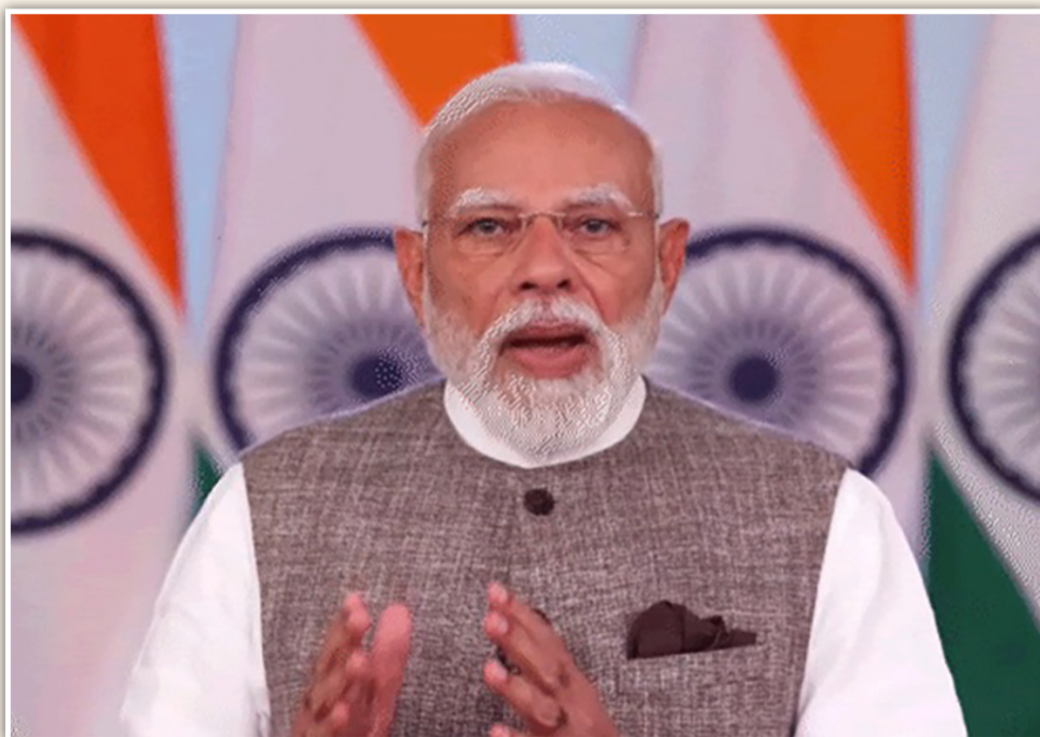
નવી દિલ્હી, તા. ૧૮

વિપક્ષ પર વડાપ્રધાનના તીખા પ્રહાર : મહિલાઓના સ્વપનને કચડી નાખ્યા, નારી શક્તિના અપરાધી ગણાવ્યા : બીલ પાસ ન થવા બદલ દેશની બહેનો-માતાની માફી માંગી