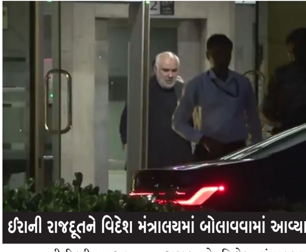
ઈરાની રાજદૂતને વિદેશ મંત્રાલયમાં બોલાવવામાં આવ્યા

નિયંત્રણ હવે કડક કરવામાં આવ્યું છે, અને જનમાર્ગને ઈરાનના સશસ્ત્ર દળોના કડક સંચાલન અને નિયંત્રણ હેઠળ મૂકવામાં આવ્યો છે. આ કારણોસર, હોમીયુ સ્ટ્રેટનું નિયંત્રણ તેની પાછલી સ્થિતિમાં પાછું આવી ગયું છે, અને આ વ્યૂહાત્મક સ્ટ્રેટ સશસ્ત્ર દળોના કડક સંચાલન અને નિયંત્રણ હેઠળ છે, સ્પષ્ટ નિવેદનમાં ઉમેરવામાં આવ્યું છે. નિવેદનમાં વધુમાં જણાવાયું છે કે જ્યાં સુધી વોશિંગ્ટન ઈરાની જહાજો માટે સંપૂર્ણ અવરજવરની સ્વતંત્રતા તરીકે વર્ણવેલ ખાતરી નહીં કરે ત્યાં સુધી વર્તમાન પરિસ્થિતિ ચાલુ રહેશે. ટૂંક સમયમાં જણાવાયું છે કે જ્યાં સુધી પોસ્ટમાં કહ્યું હતું કે ઈરાનના બંદરો પર અમેરિકન નૌકાદળની નાકાબંધી ત્યાં સુધી ચાલુ રહેશે જ્યાં સુધી તેહરાન સાથે વ્યાપક શાંતિ કરાને અંતિમ સ્વરૂપ આપવામાં ન આવે, ઈરાનના હોમીયુ સ્ટ્રેટ સુધી પહોંચ