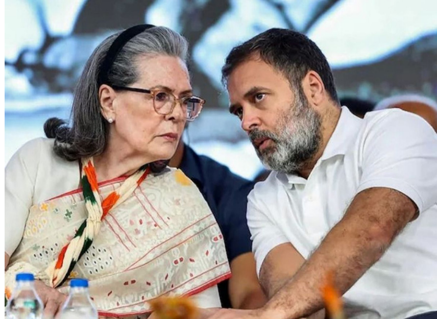
કોર્ટે લેખિત દલીલો રજૂ કરવાનો આખ્યો નિર્દેશ

નવીદિલ્હી, તા. ૧૮ શનિવારે, રાઉઝ એવન્યુ કોર્ટે સોનિયા ગાંધી વિરુદ્ધ દાખલ કરાયેલી સુધારા અરજી પર સુનાવણી કરી, જેમાં આરોપ મુકવામાં આવ્યો હતો કે ભારતીય નાગરિકતા મેળવ્યા વિના તેમનું નામ મતદાર યાદીમાં સામેલ કરવામાં આવ્યું છે. ફરિયાદી પક્ષે તેમની બધી દલીલો પૂર્ણ કરી લીધી હતી. કોર્ટે બંને પક્ષોને એક અઢવાડિયામાં તેમની લેખિત દલીલો રજૂ કરવાનો આદેશ આપ્યો હતો. સોનિયા ગાંધીનું પ્રતિનિધિત્વ કરતા વકીલે આગામી સુનાવણીમાં વધારાની દલીલો રજૂ કરવાની પરવાનગી માંગી હતી. આ બાબત પર વિચાર કર્યો