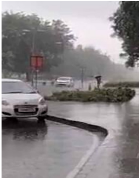
રાજકોટ, તા. ૨૦ રાજકોટ સહિત સમગ્ર સોરાષ્ટ્ર અને કચ્છના વાતાવરણમાં

રવિવારે રાજકોટ ૪૦.૯ ડિગ્રી સાથે રાજ્યનું “હોટેસ્ટ” સીટી : સપ્તાહના અંતમાં તાપમાનનો પારો ૪૨ ડિગ્રી સુધી પહોંચવાની આગાહી