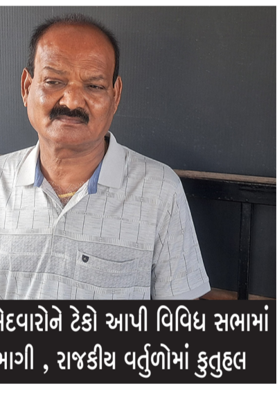
વોર્ડમાં ભાજપના ઉમેદવારોને ટેકો આપી વિવિધ સભામાં થઈ રહ્યા છે સહભાગી, રાજકીય વર્તુળોમાં કુતુહલ