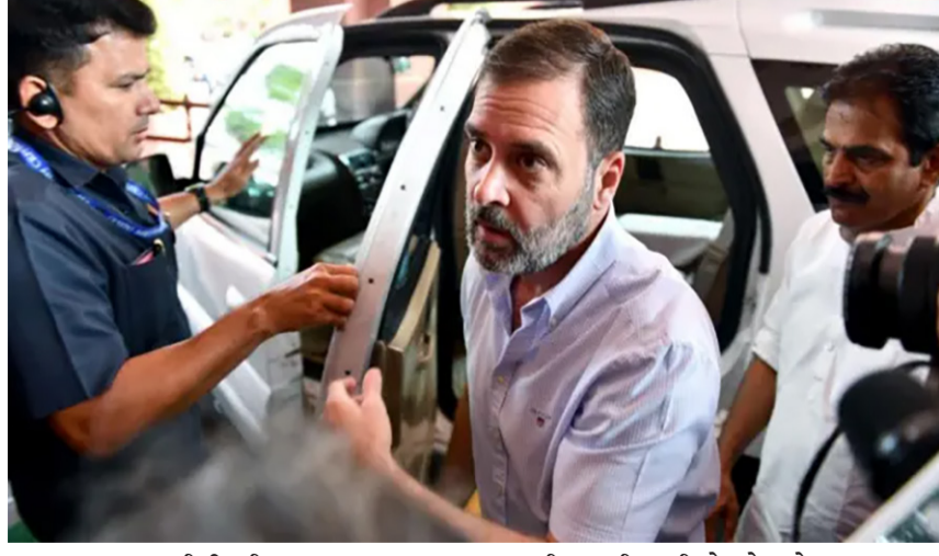
નવી દિલ્હી, તા.૨૦

તમિલનાડુની રેલીમાં રાહુલનો આરોપ ; સંસ્કૃતિ, પરંપરા અને ઇતિહાસ પર હુમલો કરવા માટે AIADMK ને ભાગીદાર બનાવ્યું !