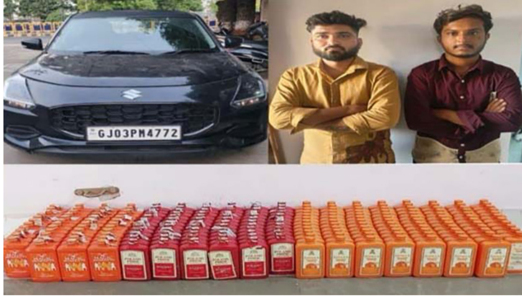
પોલીસ કમિશનર બ્રજેશકુમાર જા, અધિક પોલીસ કમિશનર ચેતન્ય મંડલીક અને ડીસીપી ઝોન-૨ રાકેશ દેસાઈએ દાડ અને જુગાર જેવી ગેરકાયદેસર પ્રવૃત્તિઓ પર અંકુશ લાવવા ખાસ આતમી મુજબ, ૧૫૦ ફૂટ રીંગ રોડ પર ૨ ની ટીમ પેટ્રોલિંગમાં હતી ત્યારે તેમને એક ચોક્કસ બાતમી મળી હતી. આતમી મુજબ, ૧૫૦ ફૂટ રીંગ રોડ પર

હતાં. વિગતો પર નજર કરીએ તો અગામી મહાનગર પાકિલાની ચૂંટણી અંતર્ગત શહેર પોલીસ કાયદો વ્યવસ્થા જળવાઈ રહે તે માટે સતર્ક છે અને દાડની હેરફેર અટકાવવા માટેની પણ કડક કામગીરી કરી રહી છે. આવા સમયે નાના મોટા દાડના ધંધાથી વધુ ને વધુ સક્રિય થઈ કમાણી કરી લેવા મેદાનમાં આવી ગયા છે. સામે પોલીસ પણ સતત દરોડા પાડી આવા તત્વોના ઇરાદાને નાકામ બનાવી રહી છે. વધુ એક વખત એલસીબી ઝોન-૨ ટીમે દાડની હેરફેર અટકાવી છે. ૧૫૦ ફૂટ રીંગ રોડ પર આંબેડકરનગર પાસેથી વિદેશી દાડનો જથ્થો ભરીની નીકળેલા બે શખ્સને પકડી લીધા છે. આ દાડનો જથ્થો કુવાડવા તરફથી બંને શખ્સ ભરી લાવ્યા હોવાનું કહેતાં હોઈ સાચી વિગતો ઓકાવવા રિમાન્ડની તજવીજ થઈ રહી છે. વધુ માહિતી જોઈએ તો શહેર