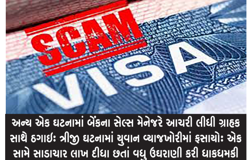
અન્ય એક ઘટનામાં બેંકના સેલ્સ મેનેજરે આચરી લીધી ગ્રાહક સાથે કઠગાઈ: ત્રીજી ઘટનામાં યુવાન વ્યાજખોરીમાં ફસાયો: એક સામે સાડાચાર લાખ દીધા છતાં વધુ ઉધારાણી કરી ધાકધમકી