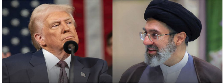
નવી દિલ્હી, તા.૨૦

અમેરિકા અને ઈરાન વચ્ચે ચાલી રહેલા વિવાદ વચ્ચે અમેરિકાના રાષ્ટ્રપ્રમુખ ડોનાલ્ડ ટ્રમ્પનું મહત્વનું નિવેદન સામે આવ્યું છે. બંને દેશોના વિવાદનું નિરાકરણ લાવવા માટે પાકિસ્તાનના ઈસ્લામાબાદમાં બીજી વખત શાંતિ મંત્રણા યોજાવાની છે, જેને લઈને ટ્રમ્પે કહ્યું છે કે, ઉપરાષ્ટ્રપ્રમુખ જેડી વેન્સની આગેવાની હેઠળ અમેરિકા પ્રતિનિધિમંડળ ઈરાન સાથે શાંતિ સમજૂતી પર વાતચીત કરવા માટે આજે પાકિસ્તાનના ઈસ્લામાબાદમાં પહોંચવાનું છે. જોકે મંત્રણા પહેલા સંકટ એ ઉભું થયું છે કે, કેટલાક મુદ્દાઓથી નારાજ થઈને ઈરાને મંત્રણામાં સામે થવાનો ઈન્કાર કરી દીધો છે, જેના કારણે હવે આ સમજૂતી પર સંકટના