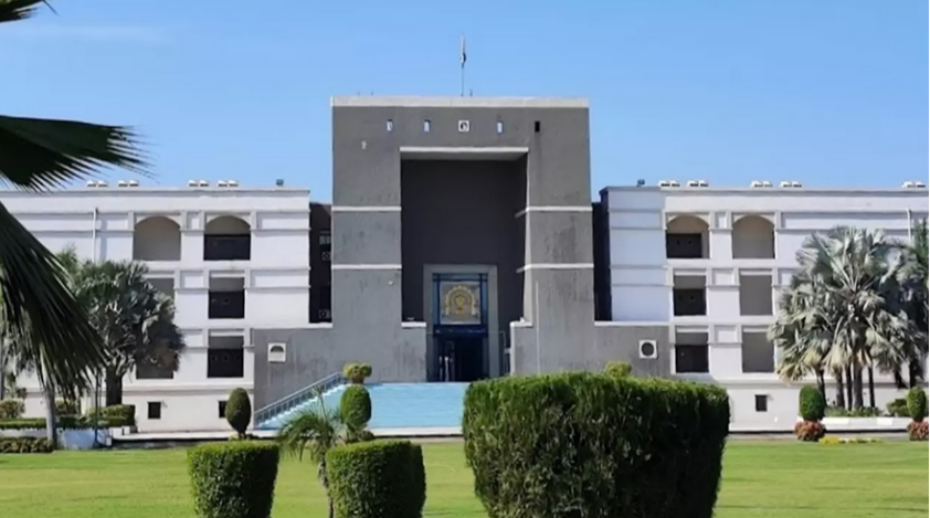
કાયદાકીય મંચ દ્વારા ફરિયાદ કરનાર પક્ષને બેવડું રક્ષણ આપવામાં આવે તો તે પ્રતિકૂળ સાબિત થઈ શકે: કોર્ટે કર્યું અવલોકન

અમદાવાદ, તા. ૨૦ ગુજરાત હાઈ કોર્ટે તાજેતરમાં એક જાણીતી ડેરી કંપનીની પૂર્વ મહિલા કર્મચારી દ્વારા દાખલ કરવામાં આવેલી અરજીને ફગાવી દીધી છે. અરજદારે કંપનીની આંતરિક ફરિયાદ સમિતિના તે અહેવાલને પડકાર્યો હતો, જેમાં તેના દ્વારા ઉચ્ચ અધિકારીઓ પર લગાવવામાં આવેલા જાતીય સતામણીના આરોપોને ખોટા અને પાયાવિહોણ ગણાવવામાં આવ્યા હતા. આ મામલે સુનાવણી દરમિયાન કોર્ટે મહત્વનું અવલોકન કર્યું હતું કે, જાતીય સતામણી જેવા સંવેદનશીલ કિસ્સાઓમાં કોર્ટે એ બાબતે સાવચેત રહેવું જોઈએ કે પુરુષ આરોપીઓ વિરુદ્ધ કોઈ પૂર્વગ્રહ કામ ન કરે. અદાલતે ચુકાદામાં સ્પષ્ટ કર્યું હતું કે, જો કાયદાકીય મંચ દ્વારા ફરિયાદ કરનાર પક્ષને બેવડું રક્ષણ આપવામાં આવે તો તે પ્રતિકૂળ સાબિત થઈ શકે છે. કોર્ટે અવલોકન કર્યું કે POSH એક્ટ (જાતીય સતામણી નિવારણ ધારો)ની જોગવાઈઓનો અતિશય દુરુપયોગ મહિલાઓ માટે પ્રગતિના અવરોધો દૂર કરવાને બદલે નવી પડલાસ સીલિંગથી ઊભી કરશે. આ પ્રકારનો દુરુપયોગ ખરેખર સક્ષમ અને મહેનતુ મહિલા કર્મચારીઓ માટે રોજગારીના ક્ષેત્રમાં નવા બંધનો સર્જી શકે છે, જે કાયદાના મૂળ હેતુથી વિપરીત છે. સમગ્ર મામલાની વિગત મુજબ