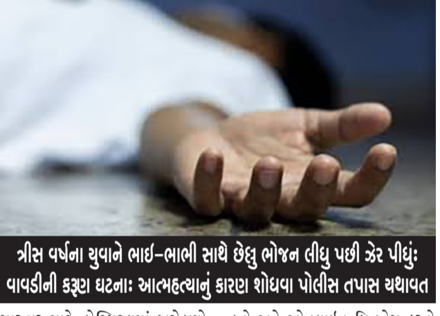
ત્રીસ વર્ષના યુવાને ભાઈ-ભાભી સાથે છેલ્લું ભોજન લીધું પછી ઝેર પીધું: વાવડીની કચ્છા ઘટના: આત્મહત્યાનું કારણ શોધવા પોલીસ તપાસ થયાપાત

હતો અને ઓનલાઇન બિઝનેસ કરતો હતો. સાંજે તેણે ભાઈ-ભાભી સાથે જમ્યા બાદ પોતાના રૂમમાં જઈ ઝેર પી લીધું હતું. ઉદ્દેશીએ કરવા માંડતા મોટા ભાઈએ તપાસ કરતાં તેણે દવા પી લીધાનું જણાવ્યું તુરત જ સારવાર માટે ખસેડ્યો હતો. પરંતુ જીવ બચી શક્યો નહોતો. આ બનાવથી પરિવારમાં કષ્ટાંત સર્જાયો છે. પોલીસે આપઘાતનું કારણ બહાર ન આવતાં અંતિમવિધી બાદ પોલીસ મૃતકના સ્વજનો, મિત્રો સહિતની પાસેથી કારણ જાણવા વિગતો મેળવવા પ્રયાસ કરશે.