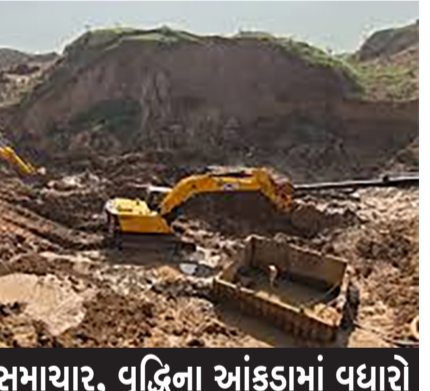
દરેક મોરચે સારા સમાચાર, વૃદ્ધિના આંકડામાં વધારો

ટકા નોંધાયો હતો. ચાલો આપણે સરકાર દ્વારા જાહેર કરાયેલા ડેટાને પણ સમજાવીએ. ગજવ ડેટા એ પણ દર્શાવે છે કે ઉત્પાદન ક્ષેત્રનું ઉત્પાદન માર્ચ ૨૦૨૬માં ધીમું થઈને ૪.૩ ટકા થયું હતું, જે ગયા વર્ષના સમાન મહિનામાં ૪ ટકા હતું. ખાણકામ ઉત્પાદન વૃદ્ધિ એક વર્ષ અગાઉ નોંધાયેલા નજીવ છે. ૧.૨ ટકાના વિકાસથી વધીને ૫.૫ ટકા થઈ છે. માર્ચમાં વીજળી ઉત્પાદનમાં નજીવો ૦.૮ ટકાનો વધારો થયો છે, જે ગયા વર્ષના સમાન સમયગાળામાં ૦.૫ ટકાનો વધારો હતો. નાણાકીય વર્ષ ૨૦૨૫-૨૬માં, દેશનો ઔદ્યોગિક ઉત્પાદન વૃદ્ધિ ૪.૧ ટકા પર લગભગ સ્થિર રહ્યો છે, જે એક વર્ષ અગાઉ ૪ ટકા હતો. નિવેદનમાં કહેવામાં આવ્યું છે કે ઉત્પાદન ક્ષેત્રમાં, ૨૩ ઉદ્યોગ જૂથોમાંથી ૧૪ એ માર્ચ ૨૦૨૫ ની સરખામણીમાં માર્ચ ૨૦૨૬ માં સકારાત્મક વૃદ્ધિ નોંધાવી હતી. માર્ચ ૨૦૨૬ માં ટોચના ત્રણ સકારાત્મક