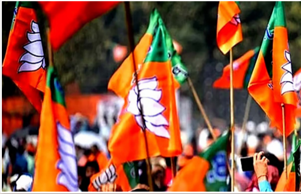
આ ચૂંટણીમાં વિપક્ષ પાસે જનતાનો અવાજ બનીને ઉભરવાની અને ભાજપને ટક્કર આપવાની પૂરતી તક હતી, પરંતુ વિપક્ષી નેતાઓમાં આ તકનો લાભ

રાજકોટ, તા. ૨૮ રાજકોટ મહાનગરપાલિકાની ચૂંટણીના પરિણામોએ સ્પષ્ટ કરી દીધું છે કે સૌરાષ્ટ્રના રાજકોટમાં ભાજપનો દબદબો અકબંધ છે. 'રંગીલું રાજકોટ' હવે કેસરી રંગના પ્રચંડ જુવાળમાં 'ભાગપું' બની ગયું છે. કુલ ૭૨ બેઠકોમાંથી ૬૫ બેઠકો પર ભાજપે ભવ્ય વિજય મેળવ્યો છે. આ પરિણામો માત્ર એક પક્ષની જીત નથી, પરંતુ વિપક્ષો માટે ગંભીર આત્મચિંતન અને સત્તાધારી પક્ષ માટે જવાબદારીનો નવો અધ્યાય છે.