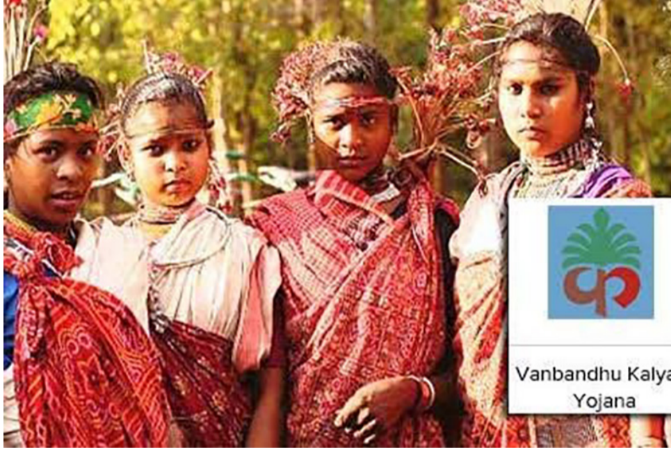
Vanbandhu Kalyan Yojana

ગાંધીનગર, તા.૩૦ આદિજાતિ ગામોની શાળાઓ અને પ્રાથમિક આરોગ્ય કેન્દ્ર સાથે જોડતા માર્ગો તેમજ સ્ટ્રક્ચર નિર્માણ માટે રૂ. ૩૬૨ કરોડના કામોને મંજૂરી આપી