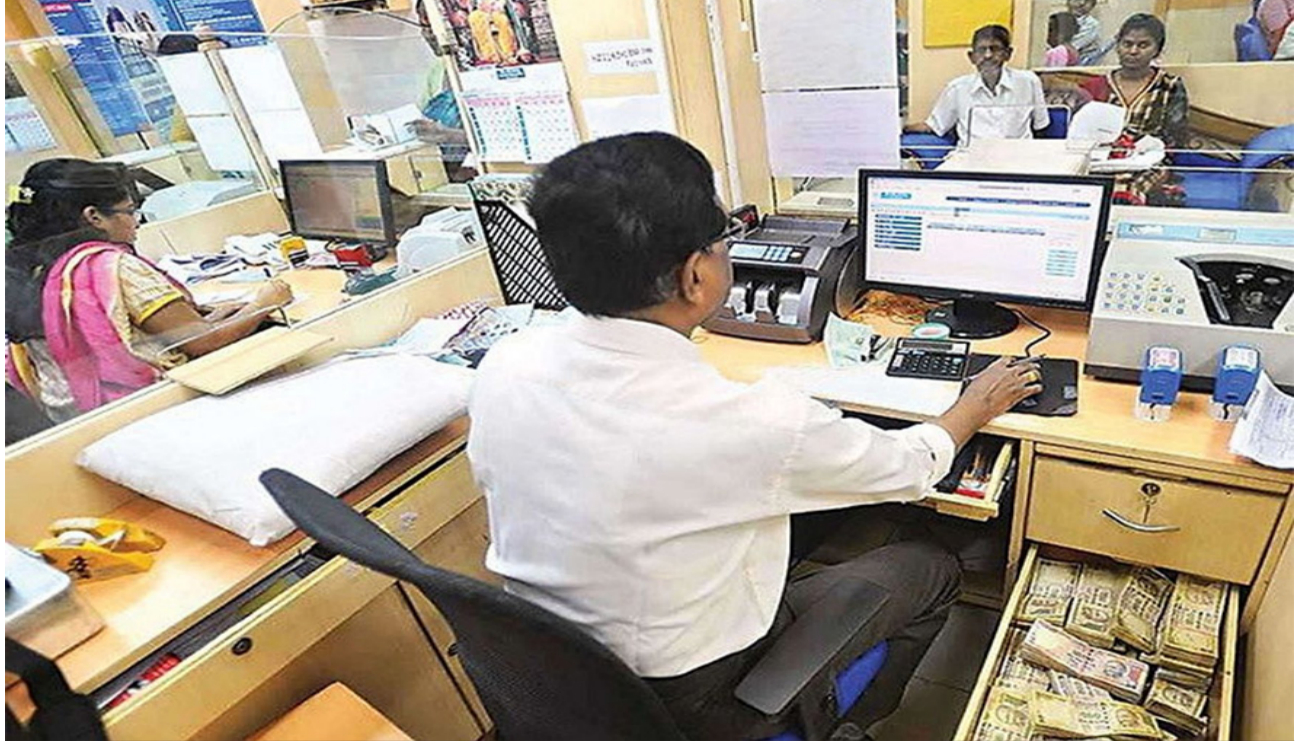
રાજ્યના ૧૩ વિભાગોની ૨૦૦થી વધુ ઉંચક યોજનાઓમાં આધાર પ્રમાણીકરણ સેવાઓનો ઉપયોગ: ગત નાણાકીય વર્ષમાં ૫૬ કરોડથી વધુ આધાર પ્રમાણીકરણ ટ્રાન્ઝેક્શન

રાજ્યમાં ડિજિટલ ટ્રાન્સફોર્મેશન અને ઇ-ગવર્નન્સ થકી સરકારી સેવાઓમાં પારદર્શિતા અને કાર્યક્ષમતાનો નવો સૂર્યોદય