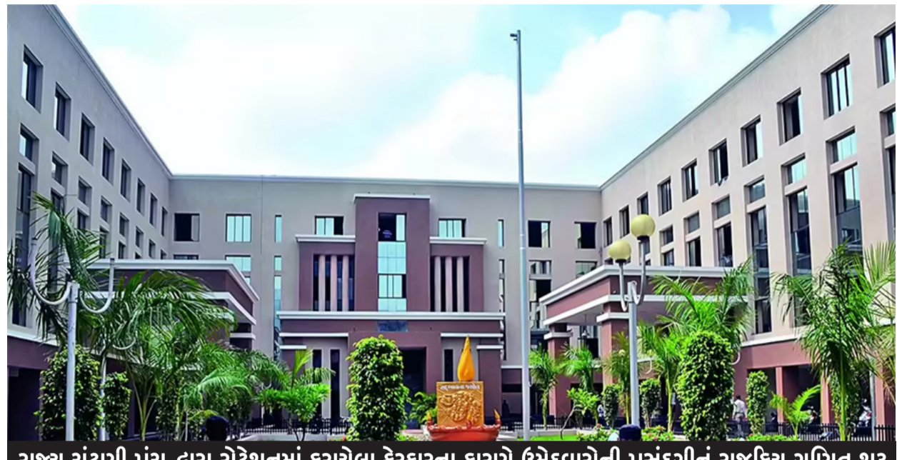
રાજ્ય ચૂંટણી પંચ દ્વારા રોટેશનમાં કરાયેલા ફેરફારના કારણે ઉમેદવારોની પસંદગીનું રાજકોટ ગણિત શરૂ

પાટીદાર સમાજના ૨૦ થી ૨૨, દરબાર અને આચર જ્ઞાતિના ૧૨ થી ૧૭, બ્રાહ્મણ જ્ઞાતિના છ થી સાત, સોની મહાજન અને વણિક જ્ઞાતિના ઉમેદવારોને એક થી બે, દલિત સમાજના પાંચ અને અનુસુચિત જાતીના એક ઉમેદવારને ટિકિટ મળે તેવી સંભાવના દર્શાવતા રાજકોટ નિરીક્ષકો