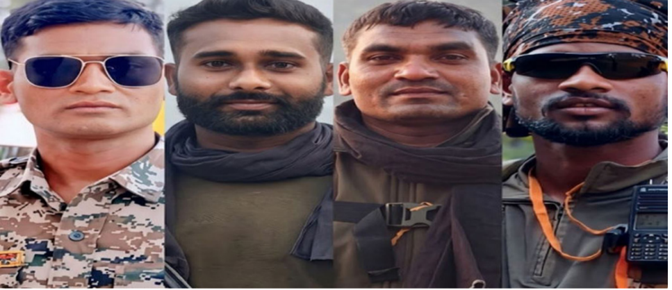
નક્સલીઓ દ્વારા પ્લાન્ટ કરવામાં આવેલા આઈઈડી (IED) ને નિષ્ક્રિય કરવા ગયેલી ટીમના ચાર જવાનો બચ્યા ભોગ

નવી દિલ્હી, તા. ૨ છત્તીસગઢના બસ્તર ડિવિઝનમાં ક્રિકેટ અને નારાયણપુર જિલ્લાની સરહદ પર નક્સલ વિરોધી અભિયાન દરમિયાન એક દુર્ભાગ્યપૂર્ણ ઘટના બની છે. નક્સલીઓ દ્વારા પ્લાન્ટ કરવામાં આવેલા આઈઈડી (IED) ને નિષ્ક્રિય કરવા ગયેલી ડિસ્ક્રિટ રિઝર્વ ગાર્ડ (DRG) ની ટીમ પર વિસ્ફોટ થતા ૪ બહાદુર જવાન શહીદ થયા છે. ક્રિકેટ એસપી નિખિલ રાખેયાએ જણાવ્યું કે, ક્રિકેટ જિલ્લાના છોટેબેડિયા પોલીસ સ્ટેશન વિસ્તારના કોરોસકોડા જંગલમાં સર્વિંગ અને ડી-માઈનિંગ ઓપરેશન ચલાવવામાં આવી રહ્યું હતું. આ વિસ્તાર ક્રિકેટ અને નારાયણપુરની બોર્ડર પર આવેલો છે. નક્સલીઓએ જવાનોને નુકસાન પહોંચાડવા માટે જમીનમાં વિસ્ફોટકો દાટ્યા હોવાની બાતમીના આધારે જવાનો તેને નિષ્ક્રિય કરવા નીકળ્યા હતા. આ કામગીરી