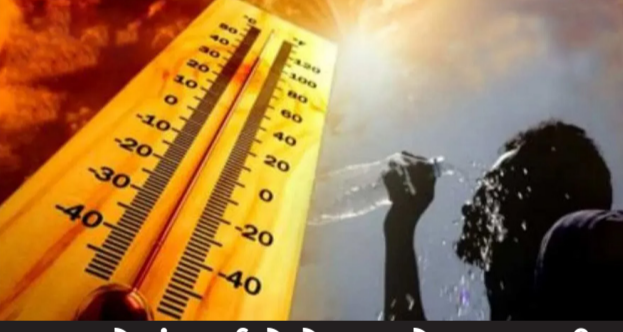
બજારોમાં કફ્ટું જેવો સપાટો : આગામી દિવસોમાં લોકોએ સહન કરવી પડશે ગરમી

રહેલી છે. ધૂળની આંધીની સાથે કેટલાક વિસ્તારોમાં છૂટોછવાયો વરસાદ પણ પડી શકે છે. પવન અને વરસાદની આ સંયુક્ત અસરથી ઉનાળાની આકરી ગરમીમાં ઘટાડો થશે. મે મહિનાના મધ્યમાં વાતાવરણ પલટાની તીવ્રતા વધુ રહેવાની ધારણા છે. વાતાવરણમાં થતા સતત બદલાવ અલ-નીનોની સાથે સાથે ગ્લોબલ વોર્મિંગનું પણ કારણ મામા આવે છે ત્યારે મે મહિનો હિટ થવાની સાથે સાથે લોકોને પરસેવે રેબઝેબ કરશે તેનું આગાહીકારો માની રહ્યા છે.