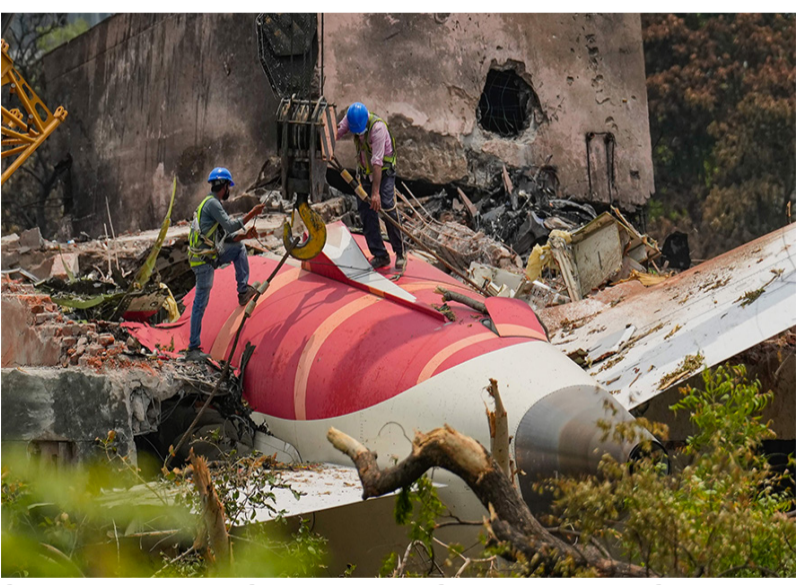
એ. AAIB ના પ્રારંભિક અહેવાલમાં સમય કમની ચકાસણીની જરૂર છે, રેકોર્ડ કરેલા ઈંધણ કટ-ઓફ અને RAT હાઈડ્રોલિક સક્રિયકરણ વચ્ચે ઓછું અંતર છે. આ અંગે ઊંડાણપૂર્વક તપાસ માટે હાકલ કરતા, પાઈલટ્સ સંગઠને ઓપરેટિંગ રીલે સરકારને તેના તારણોને પરીક્ષણયોગ્ય પૂર્વધારણા તરીકે ગણવા વિનંતી કરી છે.

નાગરિક ઉડ્ડયન મંત્રાલય (MoCA) અને એરકાફ્ટ એક્સિડન્ટ ઈન્વેસ્ટિગેશન બ્યુરો (AAIB) ને સુપરત કરાયેલ વિગતવાર તકનીકી નોંધમાં, પાઈલટ્સના સંગઠને કહ્યું કે: નક્ષલિથિયમ-આયન બેટરીની નિષ્ફળતા, અસામાન્ય વોલ્ટેજ ઉંડળ રિલે અને બોઈંગ ૭૮૭ ઈલેક્ટ્રિકલ ડિઝાઈનના આધારે, પ્રી-લિફ્ટ-ઓફ ઈલેક્ટ્રિકલ ડિસ્ટર્બન્સ પાઈલટ ઈનપુટ વિના અનિચ્છનીય રિલે ઓપરેશન અને જ્યુઅલ એન્જિન ક્યુઅલ કટ-ઓફનું કારણ બની શકે છે.