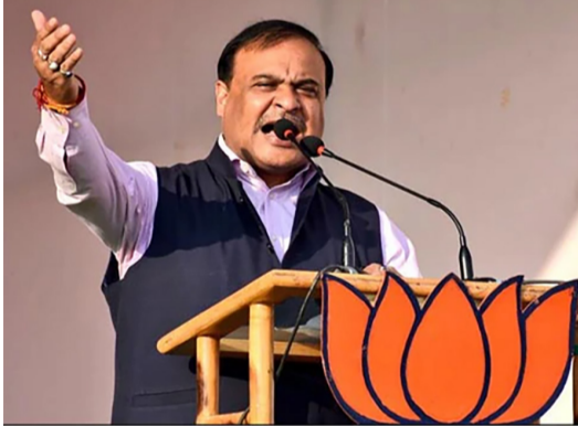
સતત ત્રીજી વખત ચૂંટણી જીતી એનડીએ થશે સત્તાઝૂ

નવીદિલ્હી, તા. ૪ આસામમાં ૭૦ બેઠકો જીતીને ભાજપની આગેવાની હેઠળના ગઠબંધને બહુમતી મેળવી હોવાથી, શાસક ગૃહ આસામમાં સતત ત્રીજી વખત સરકાર બનાવવા માટે તૈયાર છે. મતગણતરી ચાલુ છે તેમ, ભાજપે ૫૮ બેઠકો જીતી છે, તેના સાથી પક્ષ બોડો પીપલ્સ ફ્રન્ટ (BPF) સાત અને આસામ ગણ પરિષદ (AGP) પાંચ બેઠકો જીતી છે. ભાજપની આગેવાની હેઠળના ગૃહ માટે હેટ્રિક અટકાવવાનો પ્રયાસ કરી રહેલ વિપક્ષી ગઠબંધન પાછળ છે, અને કોંગ્રેસને ૨૦ બેઠકોનો આંકડો પાર કરવાની બહુ ઓછી આશા છે. આસામમાં, ૧.૨૯% મતદારોએ ઇલેક્ટ્રોનિક વોટિંગ મશીનો (EVM) પર NOTA બટન દબાવ્યું. ૧૨૬ સભ્યોની વિધાનસભામાં ૧૬ બેઠકો પર ચૂંટણી લડવા છતાં ઝારખંડ મુક્ત મોર્યા (JMM) આસામમાં પોતાનું ખાતું ખોલવામાં નિષ્ફળ ગયું. જોકે, પાર્ટીએ કહ્યું કે તેણે આસામમાં પોતાનું સ્થાન સુરક્ષિત કરી લીધું