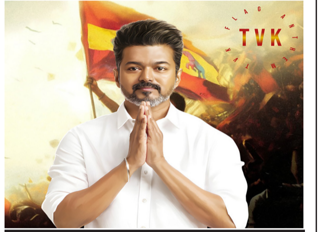
સુપરસ્ટાર થલાપતિ વિજયે તમિલનાડુ વિધાનસભા ચૂંટણીમાં કર્યા આશ્ચર્યચકિત

નવીદિલ્હી, તા. ૪ પાંચ રાજ્યોમાં ચૂંટણી પરિણામો વચ્ચે “થલાપતિ” નામ ગુંજતું રહ્યું છે. દક્ષિણ ભારતના સુપરસ્ટાર થલાપતિ વિજયે તમિલનાડુ વિધાનસભા ચૂંટણીમાં બધાને આશ્ચર્યચકિત કરી દીધા છે. જ્યારે થલાપતિએ ચૂંટણી પહેલાં નવી પાર્ટી બનાવવા અને ચૂંટણી લડવાનો પોતાનો ઇશારો જાહેર કર્યો, ત્યારે ઘણા લોકોએ તેને ગંભીરતાથી લીધું ન હતું. ઘણા લોકોએ તેને તેમના ચાહકોનો ઉપયોગ કરીને તમિલનાડુના રાજકારણમાં પગપેસારો કરવાના પ્રયાસ તરીકે જોયું. તે સમયે, ભાગ્યે જ કોઈએ અનુમાન કર્યું હશે કે થલાપતિ વિજયી બનશે. તમિલનાડુમાં કિલ્મ સ્ટાર્સને નેતા તરીકે ચૂંટવાનો ઇતિહાસ છે. એમજીઆર અને જયલલિતા જેવા દિગ્ગજોએ મુખ્યમંત્રી તરીકે પોતાનું વર્ચસ્વ સ્થાપિત કર્યું, જ્યારે કમલ હાસન અને રજનીકાંત જેવા નેતાઓ નિષ્ફળ ગયા. હવે મોટો પ્રશ્ન એ છે કે થલાપતિ કેવી રીતે સફળ થયા. જ્યારે થલાપતિ વિજયે ૨૦૨૪ માં પોતાની પાર્ટી, ટીવીકેની રચના કરી, ત્યારે તેમણે સ્પષ્ટ સંદેશ આપ્યો કે રાજકારણ તેમના માટે માત્ર એક પ્રિય બન્યું. તમિલનાડુના મુખ્યમંત્રી એમકે સ્ટાલિન અને તેમની પાર્ટીએ તેમના ચૂંટણી પ્રચારને હિન્દી વિરોધી ભાવના અને