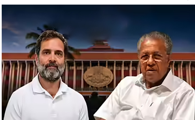
૧૦૦ બેઠકો સાથે, યુડીએફ રાજ્યમાં સરકાર બનાવવા સજ્જ

નવીદિલ્હી, તા. ૪ ૨૦૨૬ ની કેરળ વિધાનસભા ચૂંટણીમાં કોંગ્રેસની આગેવાની હેઠળની યુનાઇટેડ ડેમોક્રેટિક ફ્રન્ટ (UDF) સત્તાનો તાજ પહેર્યો છે, ત્યારે ભારતીય જનતા પાર્ટી (BJP) એ રાજ્યના રાજકારણમાં નોંધપાત્ર અને