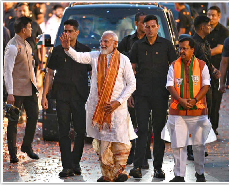
વડાપ્રધાન મોદીની ગર્જના, ગંગોત્રીથી ગંગાસાગર સુધી કમળ

મોદીની ગેરંટી, શાહની રણનીતિમાં મમતા બેનજીનો પેચ ફસાયો : ભાજપના અનેક મુદ્દાઓ ટ્રમ્પકાર્ડ સાબિત