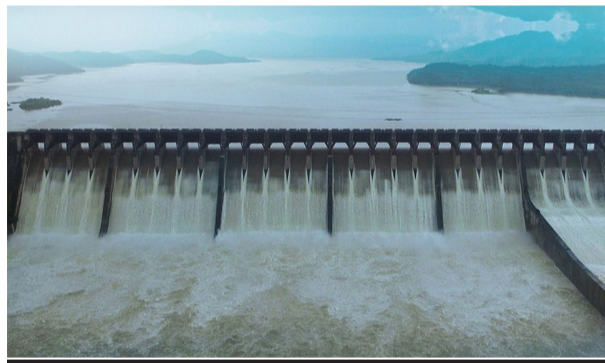
મુખ્ય જળાશયોમાં વર્તમાન સ્થિતિએ સંગ્રહાયેલ કુલ પાણીનો જથ્થો ૫૯ ટકાથી વધુ