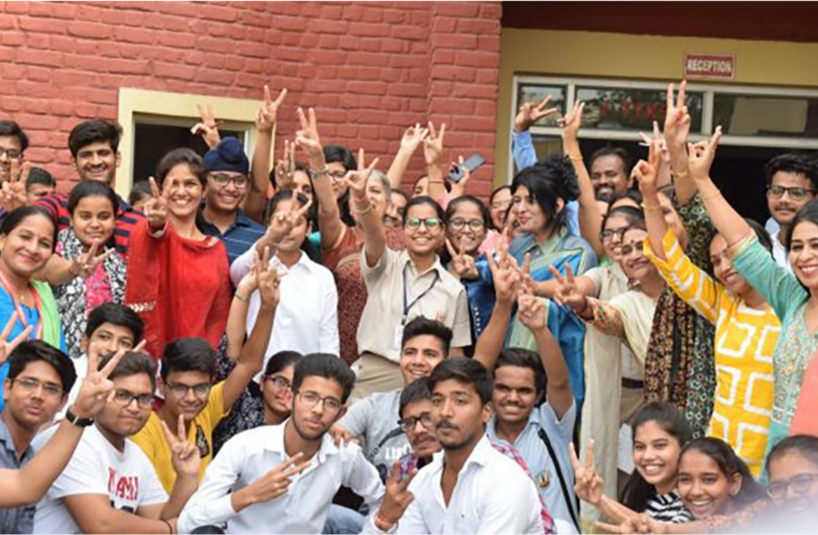
રાજકોટ, તા. ૪ માર્ચ ૨૦૨૬માં ગુજરાત માધ્યમિક અને ઉચ્ચતર માધ્યમિક શિક્ષણ બોર્ડ દ્વારા લેવામાં આવેલી ધો. ૧૨ સામાન્ય અને વિજ્ઞાન પ્રવાહની પરિક્ષાનું પરિણામ જાહેર થઈ ચૂક્યું છે જેમાં ધો. ૧૨ સામાન્ય પ્રવાહનું ૯૨.૭૧

સામાન્ય પ્રવાહમાં રાજકોટ પૂર્વનું ૯૩.૮૯ ટકા, પશ્ચિમનું ૯૪.૨૮ ટકા, દક્ષિણનું ૯૬.૦૪ ટકા , ઉત્તરનું ૯૩.૧૪ ટકા અને રાજકોટ સેન્ટ્રલ નું ૯૦.૨૯ ટકા પરિણામ : વિજ્ઞાન પ્રવાહમાં રાજકોટ પૂર્વનું ૮૬.૮૩ ટકા અને પશ્ચિમનું ૯૩.૩૧% પરિણામ