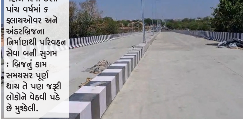
મહાનગરમાં છેલ્લા પાંચ વર્ષમાં ૬ ફ્લાયઓવર અને અંડરબ્રિજના નિર્માણથી પરિવહન સેવા બની સુગમ : બ્રિજનું કામ સમયસર પૂર્ણ થાય તે પણ જરૂરી લોકોને વેહવી પડે છે મુશ્કેલી.

બ્રિજ ગોંડલ ચોકડી તરફ જતા વાહન ચાલકોને સિગ્નલ પર અટક્યા વગર ઝડપથી આગળ વધવામાં મદદરૂપ બની રહ્યો છે. જ્યારે રામદેવપીર ચોક પર નિર્મિત ફ્લાયઓવર બ્રિજ પરિવહન સેવા સુગમ બનવા મદદરૂપ થઈ રહ્યો છે. કાલાવડ રોડ પર પ્રેમ મંદિર - મોટા મવા વચ્ચેના ફ્લાયઓવર બ્રિજે પણ લોકોની પરિવહન સુવિધામાં વધારો કર્યો છે. સમયની માંગને ધ્યાને લઈ રાજકોટથી જામનગર તરફ જવા માટે રેલવે લાઈન પર હયાત સાંકિયા પુલ પર પરિવહન સેવા સુદૃઢ બને તે માટે વિસ્તરણ અર્થે નવો બ્રિજ બનાવવાનો નિર્ણય લેવામાં આવ્યો હતો. જામનગર રોડ પર મહાનગરપાલિકા દ્વારા રૂ. ૭૪.૩૨ કરોડના ખર્ચે બનતો રેલવે ઓવરબ્રિજ (સાંકિયા પુલ) પૂર્ણતાના આરે છે, જેનું લોકાર્પણ ટૂંક સમયમાં કરવામાં આવશે. વિકાસની હરણફાળ ભરી રહેલા રાજકોટના બીજા રીંગ રોડ અને કાલાવડ રોડને જોડતા કટારીયા જંકશન ખાતે રૂ. ૧૬૭ કરોડના ખર્ચે મલ્ટીલેવલ આર્થરોનિક બ્રિજનું નિર્માણ કાર્ય પણ ઝડપથી આગળ વધી રહ્યું છે. મ્યુનીસીપલ કમિશનરશ્રી તુષાર સુમેરાના જણાવ્યા મુજબ હાલમાં આશરે ૪૦ ટકા જેટલું બ્રિજ નિર્માણ કાર્ય