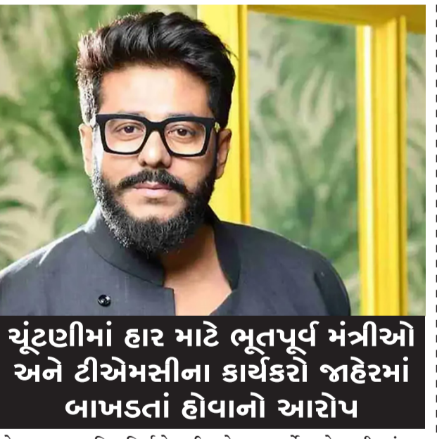
ચૂંટણીમાં હાર માટે ભૂતપૂર્વ મંત્રીઓ અને ટીએમસીના કાર્યકરો જાહેરમાં બાખડતાં હોવાનો આરોપ

કોલકાતા, તા.૮ બેરકપુરના તુષમ્બના ભૂતપૂર્વ ધારાસભ્ય, ફિલ્મ નિર્માતા રાજ ચક્રવર્તીએ ગુરુવારે જાહેરાત કરી કે તેઓ રાજકારણ છોડી રહ્યા છે. ચૂંટણીમાં હાર માટે ભૂતપૂર્વ મંત્રીઓ અને ટીએમસીના કાર્યકરો જાહેરમાં નેતૃત્વ પર હુમલો કરી રહ્યા છે, સંગઠનાત્મક ઘમંડ અને પાયાના સ્તરના જોડાણને જવાબદાર ઠેરવી રહ્યા છે તેના પગલે ચક્રવર્તીનું આ નિવેદન આવ્યું છે.