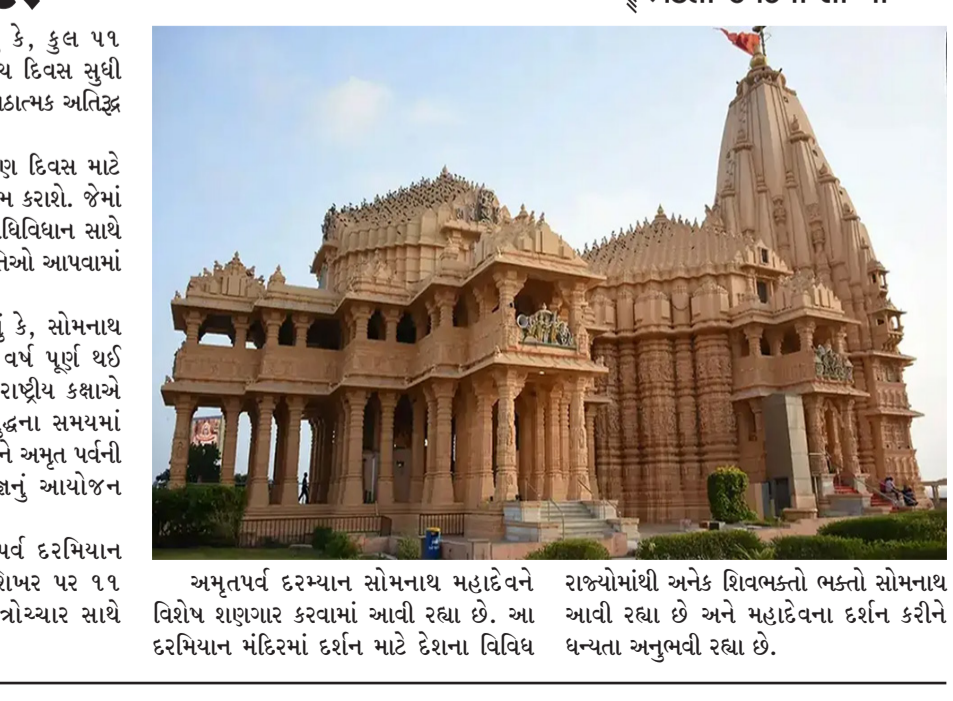
અમૃતપર્વ દરમિયાન સોમનાથ મહાદેવને વિશેષ શણગાર કરવામાં આવી રહ્યા છે. આ દરમિયાન મંદિરમાં દર્શન માટે દેશના વિવિધ રાજ્યોમાંથી અનેક શિવભક્તો ભક્તો સોમનાથ આવી રહ્યા છે અને મહાદેવના દર્શન કરીને ધન્યતા અનુભવી રહ્યા છે.