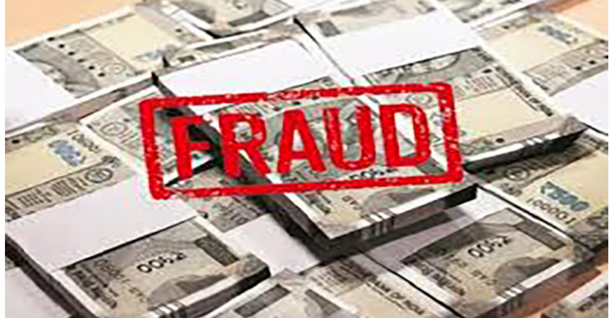
સોશિયલ મિડીયામાં વેપારીએ જાહેરાત જોઈ સંપર્ક કર્યો અને ગઠીયાએ જાળમાં ફસાવી લીધા

રાજકોટ,તા.૮ અલગ અલગ રીતે લોકોને છેતરી લેવાની ઘટનાઓ રોજીંદી છે. દરમિયાન એક વેપારી સાથે ગઠીયાએ ચાઈનાથી માલ આયાત કરાવી આપવાના નામે લાખોની ઠગાઈ કરી છે. વેપારીને ગઠીયાએ ચીનથી સસ્તા ભાવે કાપડ મંગાવી દેશે તેવું કહી જાળમાં ફસાવી લીધો હતો અને ઓગણત્રીસ લાખની ઠગાઈ કરી લીધી હતી. વિગતો પર નજર કરીએ તો સુરત શહેરના એક વેપારી સાથે ચીનથી કાપડ આયાત કરાવવાના નામે આશરે ૨૯.૪૩ લાખ રૂપિયાની ઠગાઈનો મામલો સામે આવ્યો છે. પાસોદરા પાટિયા વિસ્તારમાં રહેતા પાંચત્રીસ વર્ષીય વેપારીએ ફરિયાદ નોંધાવી છે કે બે વર્ષ પહેલા ટેક્સટાઈલ વ્યવસાય શરૂ કરવાના હેતુથી તેઓ પોતાના પાર્ટનર સાથે ચીન ગયા હતાં. જ્યાં તેઓએ બે સપ્તાહસં સાથે ડીલ કરી હતી. ત્યારબાદ શિપિંગ એજન્ટની શોધ દરમિયાન સોશિયલ મીડિયા પર રાધે ઈમ્પેક્સ નામે જાહેરાત શોયા બાદ સંપર્ક કરવામાં આવ્યો હતો. આરોપ છે કે એજન્ટ તરીકે મળેલા વ્યક્તિએ તેમને પોતાની ઓફિસ બોલાવીને ભરોસો અપાવ્યો હતો કે તે ચીનમાં તેમના સપ્લાયરને પેમેન્ટ કરી માલ સુરક્ષિત ભારત મોકલી આપશે. વિશ્વાસમાં આવીને વેપારીએ રોકડ અને બેંક ટ્રાન્સફરના માધ્યમથી કુલ ૨૯.૪૩ લાખ રૂપિયા આપી દીધા હતા. પણ થોડા દિવસો બાદ ચીનના સપ્લાયરે પેમેન્ટ ન મળ્યાની જાણકારી આપી હતી. જેના પછી ઠગાઈનો ખુલાસો થયો હતો. છેતરાયેલા વેપારીએ વધુમાં કહેવા મુજબ આરોપીએ બાદમાં બહાના બતાવી આંશિક રકમ પરત કરી હતી, પરંતુ બાકીના ૧૮.૪૩ લાખ રૂપિયા પરત કર્યા નહોતા. જ્યારે પૈસાની માંગ કરવામાં આવી ત્યારે આરોપીએ ધમકી પણ