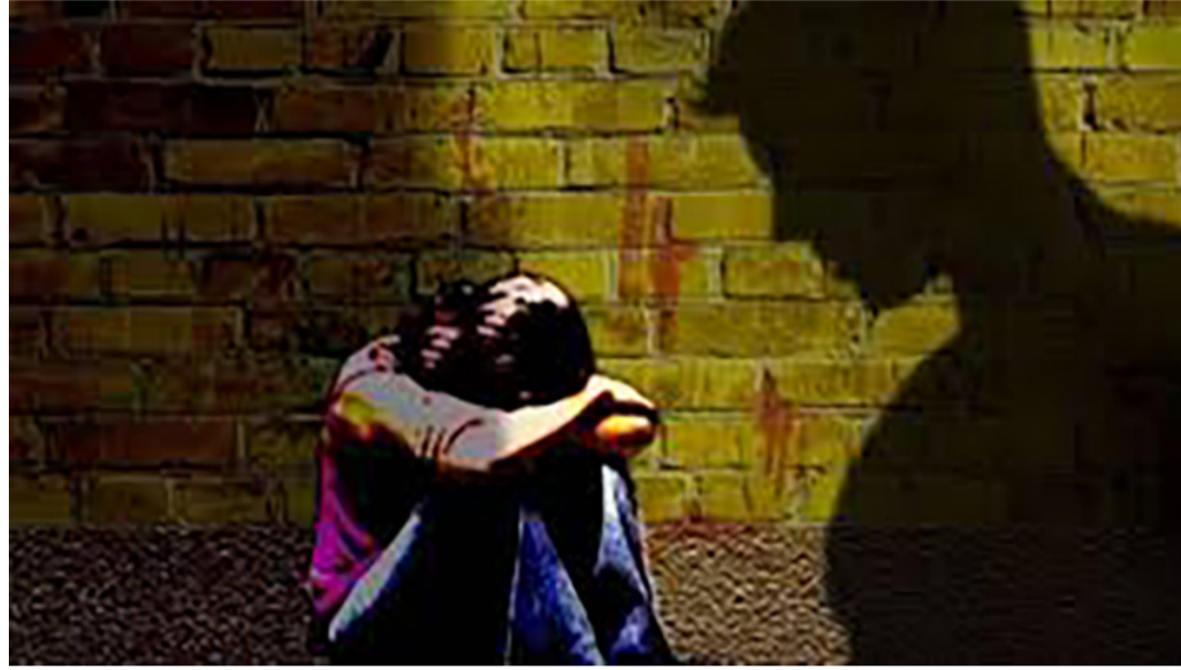
બીજી ઘટનામાં પ્રેમના નામે યુવતિ સાથે ખેલ: ગર્ભ રાખી દઈ બીજી સાથે પરણી ગયો: યુવતિએ મૃત બાળકને જન્મ દીધો

બની છે. જેમાં પંદર વર્ષની સગીરા સાથે કિશોર આંખો મળી ગઈ હતી. જેનો લાભ લઈને કિશોર ઘરના બધા સભ્યો કામ પર જાય ત્યારે સગીરાને ઘરે બોલાવી તેની સાથે વારંવાર દુષ્કર્મ ગુજારતો હતો. જેના કારણે સગીરાને સાડા ત્રણ મહિનાનો ગર્ભ રહી ગયો હતો. પેટમાં દુખાવો થતાં સગીરાને હોસ્પિટલમાં તપાસ માટે લઈ જતા તેણી ગર્ભવતી હોવાનો ભાંડો ફટકો હતો. લક્ષ્મીપુરા પોલીસે દુષ્કર્મ ગુજારનાર કાયદાના સંઘર્ષમાં આવેલ કિશોરને ડિટેઈન કરીને વધુ તપાસ હાથ ધરી હતી. પંદર વર્ષની એક સગીરાને ગર્ભવતી હાલતમાં સારવાર માટે દાખલ કરવામાં આવી છે. આ માહિતી મળતાં જ પોલીસ ટીમ તાત્કાલિક હોસ્પિટલ પર પહોંચી હતી. મહિલા પોલીસ અધિકારીઓ અને મહિલા કાઉન્સેલર દ્વારા ભોગ બનનાર અને તેની માતાનું કાઉન્સેલિંગ કરવામાં આવ્યું હતું. જેમાં ખુલાસો થયો કે કાયદાના સંઘર્ષમાં