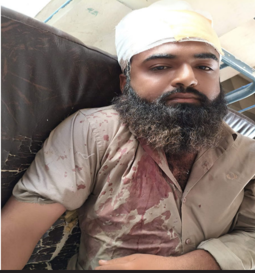
મારામારીની બીજી ઘટનામાં થોરાળામાં ગુજરીટોકના આરોપીના માતા પર હુમલો: ઘર ઉપર પાણકાના ઘા