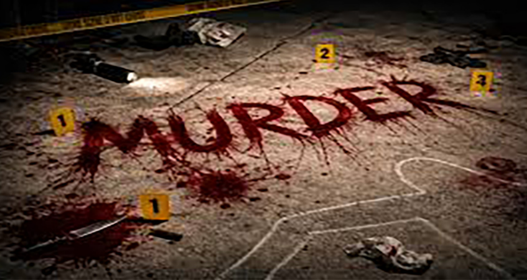
બંનેનો પરિચય થતા પ્રમ સંબંધ બંધાયો હતો જે કારણ હત્યાનું હોવાનું પ્રાથમિક મનાતું હતું.