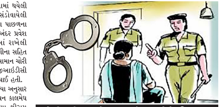
રેકી કરી હાઈપ્રોફાઈલ બંગલાઓને નિશાન બનાવતાં: ચોરીના લાખનો મુદ્દામાલ થયો કબ્જે

રાજકોટ,તા.૮ તસ્કરો પણ અલગ અલગ મોડસ ઓપરેન્ડીનો ઉપયોગ કરી ચોરીઓ કરતાં હોય છે. કોઈ એકલા જ ચોરી કરતાં હોય છે કે કોઈ પછી સાગ્રીતો સાથે ગંગ બનાવીને કે મિત્ર સાથે મળીને ચોરીઓ કરતાં હોય છે. પરંતુ એક એવી ટોળકીનો પદ્ધતિ થયો છે જેની હકિકત સામે આવતાં પોલીસ પણ ચોંકી ગઈ હતી. ફોર્ચ્યુનર કાર લઈને ચોરીઓ કરવા નીકળતી સાળી-બનેવીને ગંગને પોલીસે પકડી લીધી છે. આ ટોળકી હાઈપ્રોફાઈલ ટોળકી તરીકે ઓળખાય છે. તેની પાસેથી પોલીસે ચોરીના લાખનો મુદ્દામાલ કબ્જે કર્યો છે. બંધ બંગલાઓમાં રેકી કરીને ત્રાટકતી આ ટોળકીની આદત રસોડાનો દરવાજો તોડીને અંદર ઘુસવાની છે. વિગતો પર નજર કરીએ તો વલસાડ પોલીસે નાસિકની એક આંતરરાજ્ય ચોર ગંગનો પદ્ધતિ કર્યો છે. આ ગંગના સભ્યો સફેદ ફોર્ચ્યુનર કારમાં આવીને હાઈપ્રોફાઈલ બંગલાઓને નિશાન બનાવતા હતા. પોલીસે ગંગના મુખ્ય બે સાગરીતોની ધરપકડ કરી ચોરીના લાખનો મુદ્દામાલ કબ્જે કર્યો છે. આ ગંગ વાપી જીઆઈડીસીના પોશ ગુજન વિસ્તારમાં