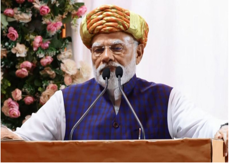
જનસભાને સંબોધન કર્યા બાદ પીએમ મોદી રાત્રિરોકાણ માટે સર્કિટ હાઉસ રવાના થયા હતા. આવતીકાલે ૧૧ મેના રોજ સોમનાથ જવા રવાના થશે. વડોદરામાં પણ એક વિશાળ જાહેર સભાને સંબોધશે તેવો કાર્યક્રમ જાહેર કરાયો છે.