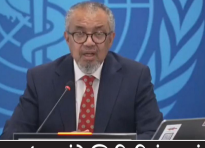
હેન્ટાવાઈરસ અંગે સ્થિતિ નિયંત્રણમાં હોવાનું પ્રમુખનું મોટું નિવેદન

નવી દિલ્હી, તા.૧૦ હેન્ટાવાઈરસ થી પ્રભાવિત લકઝરી ફૂલ શિપ એમવી હોન્ડિયસ (MV Hondius) ગ્રાનાડિલા બંદર પર પહોંચતા જ આરોગ્ય વિભાગ હરકતમાં આવી ગયું છે. વિશ્વ સ્વાસ્થ્ય સંગઠનના વડા ડો. ટેડ્રોસ ગેબ્રેયેસસે સ્થિતિની ગંભીરતાને જોતા સ્થાનિક રહીશોને આસ્વાસન આપ્યું છે કે, ગભરાવાની જરૂર નથી, સ્થિતિ સંપૂર્ણ નિયંત્રણમાં છે. રવિવારની વહેલી સવારે એમવી હોન્ડિયસ શિપ બંદર પર લાંગરવામાં આવ્યું હતું. આ શિપમાં હેન્ટાવાઈરસ નો ચેપ ફેલાવો હોવાની આશંકા બાદ યુરોપની પશ્ચિમ હૅથ એજન્સીએ તમામ મુસાફરોને હાઈ-રિસ્ક કોન્ટેક્ટ જાહેર કર્યાં છે. જોકે, રાહતની વાત એ છે કે, અત્યાર સુધી કોઈ પણ મુસાફરમાં સંક્રમણના લક્ષણો જોવા મળ્યા નથી, પરંતુ સાવચેતીના ભાગરૂપે તમામને મેડિકલ સ્ક્રિનિંગ કરવામાં આવી રહ્યું છે. મુસાફરોને જમીન પર ઉતારવા માટે ખાસ સુરક્ષિત પ્રોટોકોલ તૈયાર કરવામાં આવ્યો છે. નાની નીકાઓ દ્વારા મુસાફરોને ઉતારવામાં આવશે. ત્યાંથી સીલબંધ બસો દ્વારા માત્ર ૧૦ મિનિટના અંતરે આવેલા ટેનેરિક મુખ્ય એરપોર્ટ પર લઈ જવામાં આવશે. એરપોર્ટ પરથી તમામ મુસાફરો પોતપોતાના દેશ જવા રવાના થશે, જ્યાં પણ તેમની સ્વાસ્થ્ય પર દેખરેખ રાખવામાં આવશે.