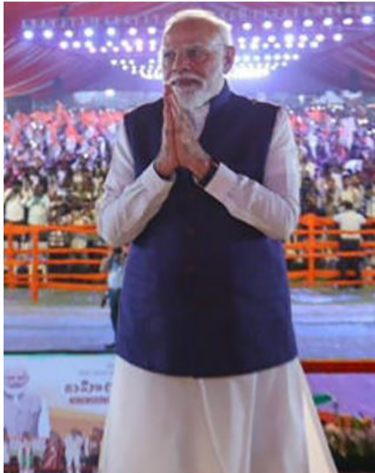
એક જનસભા દરમિયાન પીએમ મોદીએ વધતા પેટ્રોલ-ડીઝલના ભાવ અને તેલ સંકટ અંગે ચિંતા વ્યક્ત કરી હતી. તેમણે કેટલાક સૂચનો કર્યા હતા. ઈંધણ બચાવવા માટે ફરીથી વર્ક ફોમ હોમ અને ઓનલાઈન મીટિંગ્સને પ્રાથમિકતા આપવી જોઈએ. પેટ્રોલ અને ડીઝલનો ઉપયોગ

ભારત તેની જરૂરિયાતનું મોટાભાગનું સોનું વિદેશથી આયાત કરે છે, જેના માટે અબજો ડોલરની વિદેશી મુદ્રા ખર્ચવી પડે છે. જો દેશવાસીઓ એક વર્ષ માટે સોનાની ખરીદી ઘટાડી દે, તો તેનાથી અનેક મોટા ફેરફારો આવી શકે છે. સોનાની આયાત ઘટતા દેશનું આયાત બિલ ઓછું થશે અને વિદેશી હુડિયામાણની બચત થશે. સરવાળે વેપાર ખાધમાં ઘટાડો થશે તેવું મનાય છે. ડોલરની માંગ ઘટવાને કારણે ભારતીય રૂપિયા પરનું દબાણ ઘટશે એટલે રૂપિયો મજબૂત બનવાની શક્યતા પ્રબળ મનાય છે. સોનામાં નિષ્ક્રિય પડેલા નાણાં જો બેંક FD, SIP કે શેરબજારમાં રોકવામાં આવે, તો ઉદ્યોગોને મૂડી મળશે અને રોજગારની નવી તકો ઉભી થશે. હૈદરાબાદમાં