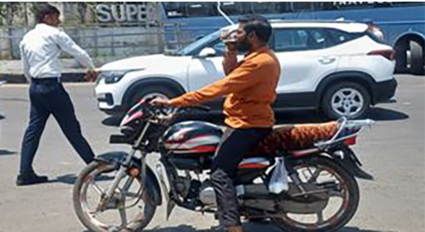
ઠંડના ડર વચ્ચે વાહનચાલકોને TRB જવાનોએ પીવાડવી ઠંડી છાશ