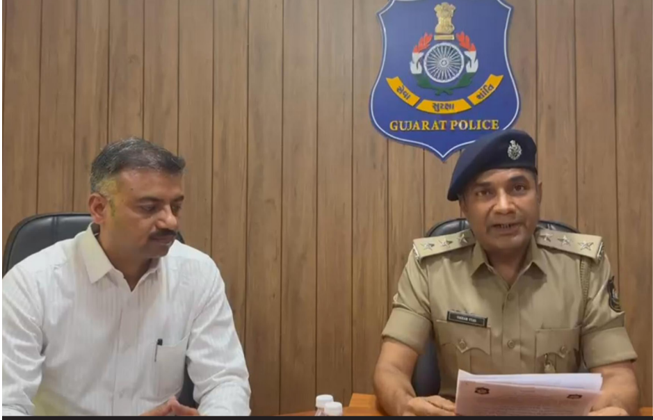
રાજકોટ ગ્રામ્ય LCBની ટીમે CCTV અને ટેકનિકલ એનાલિસિસની મદદથી ગણતરીની કલાકોમાં જ આરોપી દંપતીને દબોચ્યું

રાજકોટ, તા. ૧૦ ગ્રામ્ય લોકલ ક્રાઇમ બ્રાન્ચ (કઈઈ) દ્વારા કોટડા સાંગાણીના નારણકા ચોકડી પાસે થયેલ અજાણ્યા પુરુષની હત્યાના ગુન્હાનો ગણતરીની કલાકોમાં ભેદ ઉકેલી નાખવામાં આવ્યો છે. આ કિસ્સામાં પોલીસે મૃતકની ઓળખ કરી આરોપી પતિ-પત્નીની ધરપકડ કરી છે. પત્ની સાથે આડા સંબંધ ધરાવતાં શખ્સને પત્ની મારફત જ રાત્રે ઘરે બોલાવી પતિને મોક્ષાક કાવતરાને અંજામ આપ્યો હતો. રાજકોટ જિલ્લાના કોટડા સાંગાણી પોલીસ સ્ટેશન વિસ્તારમાં આવેલા નારણકા ચોકડી પાસે એક અજાણ્યા પુરુષની લાશ મળતા સમગ્ર પંથકમાં ચક્રવાર મચી ગઈ હતી. ગળાના ભાગે તિક્ષ્ણ હથિયારના જીવલેણ ઘા અને હાથ-પગ દોરીથી બાંધેલી હાલતમાં મળેલી આ લાશના વણશોધાયેલ ગુન્હાને રાજકોટ ગ્રામ્ય લોકલ ક્રાઇમ બ્રાન્ચ-એલસીબીએ ગણતરીની કલાકોમાં ઉકેલી નાખ્યો છે. આ હત્યા પાછળ પ્રેમ પ્રકરણ જવાબદાર હોવાનું સામે આવ્યું છે. વીડીમાં ફેંકી દેવાયેલી લાશ અને પોલીસનો કાફલો ઘટનાની વિગત મુજબ શનિવારે