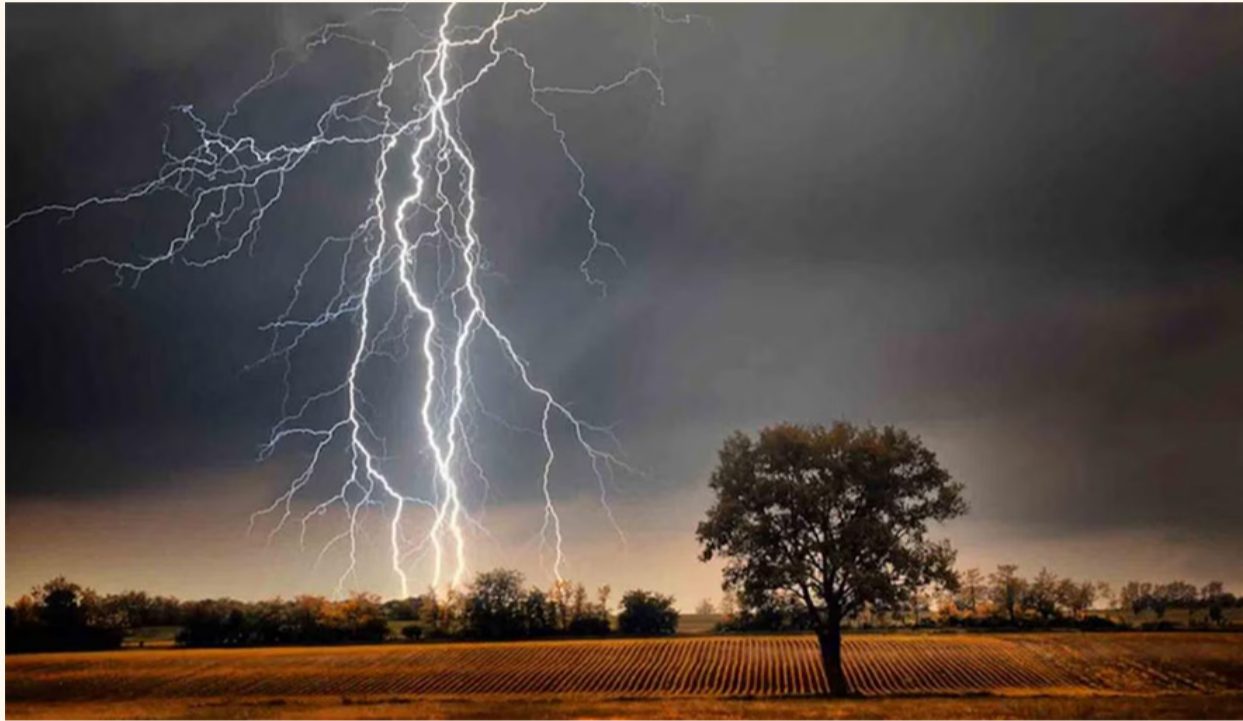
ઉગ્રાવ જિલ્લામાં ભારે વાવાઝોડા અને વરસાદ દરમિયાન અલગ-અલગ ઘટનાઓમાં ત્રણ લોકોના મોત થયા છે. ઘડી પોલીસ સ્ટેશન આસીવન પોલીસ સ્ટેશન વિસ્તારમાં નીલગિરીનું ઝાડ પડવાથી ૯ વર્ષના અંશનું મોત નીપજ્યું હતું. અન્ય બે લોકો ગંભીર રીતે ઘાયલ છે અને તેમની સારવાર લખનઉ ટ્રોમા સેન્ટરમાં ચાલી રહી છે.

નવી દિલ્હી, તા.૧૩ ઉત્તર પ્રદેશમાં આજે બુધવારે આવેલા ભીષણ વાવાઝોડા, વરસાદ અને કરા પડવાને કારણે ભારે તબાહી મચી છે. રાજ્યના અલગ-અલગ જિલ્લાઓમાં ઝાડ પડવા, દીવાલ ધરાશયી થવી, વીજળી પડવી અને ટીન શેડ ઉડવા જેવી ઘટનાઓમાં અત્યાર સુધીમાં અંદાજે ૫૪ લોકોના મોત થયા છે, જ્યારે હજારો લોકો ઘાયલ થયા છે. હવામાન વિભાગે રાજ્યના ૩૮ જિલ્લાઓમાં વાવાઝોડું, વરસાદ અને વીજળી પડવા અંગે ચલો એલર્ટ જાહેર કર્યું છે. હવામાન વિભાગના જણાવ્યા મુજબ પશ્ચિમ ઉત્તર પ્રદેશ પર અનેલી ચક્રવાત સિસ્ટમ અને દક્ષિણ રાજસ્થાનથી આવતા પૂર્વીય પવનોની અસરને કારણે રાજ્યમાં અનેક સ્થળોએ ૮૦ થી ૧૦૦ કિલોમીટર પ્રતિ કલાકની ઝડપે પવન ફૂંકાયો હતો. બુધવારે બપોર પછી શરૂ થયેલો હવામાનનો આ ફેરફાર સાંજ સુધીમાં મોટા વાવાઝોડામાં ફેરવાઈ ગયો હતો. મડના અનેક જિલ્લાઓમાં મોટી જાનહાનિ થઈ છે. ભદોલીમાં ૧૦, પ્રયાગરાજ મંડળમાં ૧૦, ફતેહપુરમાં ૮, ઉગ્રાવમાં ૭, બદાયુનું ૬, બરેલીમાં ૪, સીતાપુરમાં ૨ અને રાયબરેલીમાં ૧ મૃત્યુ નોંધાયું છે. આ સિવાય હરદોઈ, ઝાંસી, કાનપુર દેહાત, સંભલ, પ્રતાપગઢ અને અન્ય જિલ્લાઓમાં પણ લોકોએ જીવ ગુમાવ્યા છે.