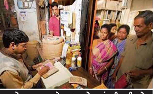
રાજકોટના ભૂપગઢ તેમજ આટકોટ, કાંગસીયાળી, મોટા માંડવા, ખડવાવડી અને દેવગામની દુકાનોની તપાસ