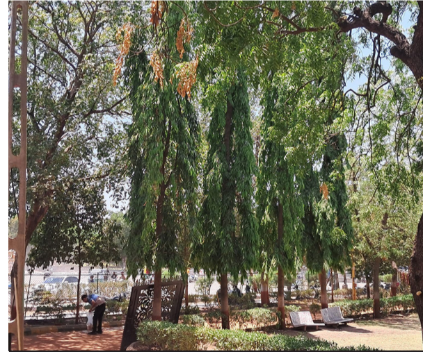
મનપા પાંચ વર્ષમાં રૂ. ૨૨ કરોડનાં ખર્ચે ૧૭.૫૦ લાખ કરતા વધુ વૃક્ષો રોપ્યાનો દાવો કરે છે છતાં રાજકોટ સૌથી વધારે ગરમ શહેર શા માટે !

વનખાતા પ્રયાસોમાં પર્યાવરણની જે રીતે અવગણવામાં આવી રહી છે તે આવનારા સમય માટે ખતરાની આ આંકડાકીય વિરોધાભાસ અને જવાબદારી પૂરી થતી નથી. પણ તેને ઘટાદાર વૃક્ષ બનાવવું તે તંત્રની બેદરકારી સામે તંત્રએ જવાબદારી તેને ઘટાદાર વૃક્ષ બનાવવું તે તંત્રની ફરજ છે. મનપા હજુ પણ જમીની આગામી વર્ષોમાં રાજકોટમાં હકીકત સ્વીકારીને વૃક્ષોના જતન માટે કોઈ ટેકનોલોજી આધારિત મોનિટરિંગ સિસ્ટમ નહીં અપનાવે, તે પણ એક કડવી વાસ્તવિકતા છે.