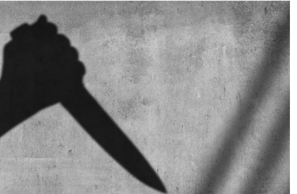
મેથમયાનગરમાં જુના મનદુઃખનો ખાર રાખી દિયરે ભાભી સાથે મવાવી ધમાલ: માલવીયાનગરમાં દાખલ થઈ ફરિયાદ