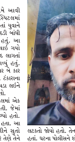
લટકતો જોયો હતો. તેના પગ નીચે અડી ગયેલા હતાં. ઘટના પોલીસને શંકાસ્પદ લાગતાં મૃતદેહને

રાજકોટ, તા. ૧૩ અપમૃત્યુની વધુ બે ઘટના સામે આવી છે જેમાં ગોંડલમાં રહેતાં અને હોસ્પિટલમાં એમ્બ્યુલન્સ ડ્રાઈવર તરીકે નોકરી કરતાં યુવાને રાતે ઘરના દરવાજાના બારસાંખમાં ચુંદડી બાંધી ગળાકાંસો ખાઈ મોત મેળવી લીધું હતું. આ બનાવને પગલે પરિવારમાં શોક છવાઈ ગયો હતો. જો કે પોલીસને ઘટના શંકાસ્પદ લાગતાં મૃતદેહનું ફોરેન્સિક પોસ્ટમોર્ટમ કરાવ્યું હતું. બીજી તરફ રાજકોટ-મોરબી હાઈવે પર બે કાર વચ્ચે સર્જાયેલા અકસ્માતમાં ધવાયેલા ટંકારાના યુવાનનું મોત થયું હતું. રાજકોટથી કપડા લઈને પરત જતી વખતે આ બનાવ બન્યો હતો. વિગતો પર નજર કરીએ તો ગોંડલમાં એક શંકાસ્પદ આપવાની ઘટના બની હતી. જેમાં યુવાન ઘરના દરવાજા પર લટકતો મળ્યો હતો. તેના પગ નીચે જમીન પર અડી ગયા હતા. આ યુવાન રાતે ઘર બહાર ખાટલો ઢાળીને સુતો હતો. મોડી રાતે તેનો ભાઈ જાઓ ત્યારે તેણે તેને