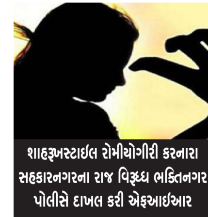
શાહરૂખસ્ટાઈલ રોમીયોગીરી કરનારા સહકારનગરના રાજ વિઠ્ઠલ ભક્તિનગર પોલીસે દાખલ કરી એફઆઈઆર

રાજકોટ, તા. ૧૩ ઘણીવાર ફિલ્મોમાં એવા રોમીયાઓ જોવા મળતાં હોય છે જે કોઈ હિરોઇનની પાછળ પડી જતાં હોય છે. વર્ષો પહેલા આવી એક ફિલ્મમાં શાહરૂખે આવી રોમીયોગીરી કરી હતી. આવી જ એક ઘટના લોકોમાં બની છે. જેમાં એક યુવતિ કોલેજમાં ભણતી ત્યારે ઈન્સ્ટાગ્રામથી એક શખ્સ સાથે મિત્રતા થઈ હતી. પણ તેણીની સગાઈ થતાં મિત્રતા ખતમ કરતાં આ શખ્સે મંગતર પાસે જઈ સગાઈ તોડાવી નાંખી હતી. હવે આ યુવતિના લગ્ન થઈ ગયા છે છતાં આ શાહરૂખ સ્ટાઈલ રોમીયો તેણીનો પીછો છોડતો નથી અને સતત તેણીને હરાન પરેશાન કરી પોતાની સાથે પરાણે સંબંધ રાખવા વાત કરવા દબાણ કરી મારી નાંખવાની ફોટા વાયરલ કરવાની ધમકી આપી રહ્યો છે. થાકી હારીને પરિણીતાએ હવે પોલીસને જાણ કરતાં કાર્યવાહી થઈ હતી.