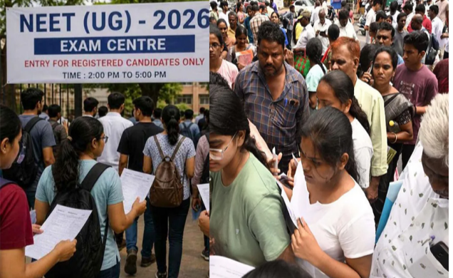
જણાવ્યું હતું કે પરીક્ષા રદ કરવાનો નિર્ણય ભારત સરકારની મંજૂરી મળ્યા પછી લેવામાં આવ્યો હતો. દરમિયાન, જ્યારે દિલ્હીમાં મીડિયા દ્વારા શિક્ષણ મંત્રી ધર્મેન્દ્ર પ્રધાનને આ બાબતે પ્રશ્ન કરવામાં આવ્યો, ત્યારે તેઓ કોઈ ટિપ્પણી કર્યા વિના ચાલ્યા ગયા. પ્રશ્ન બેંકમાં ભૌતિકશાસ્ત્ર, રસાયણશાસ્ત્ર અને જીવવિજ્ઞાનના ૩૦૦ થી વધુ પ્રશ્નો હતા. આમાંથી, ૧૫૦ પ્રશ્નો NEET પરીક્ષાના પ્રશ્નો જેવા જ હતા. પેપરમાં કુલ મળ્યા પછી લેવામાં આવ્યો હતો. દરેકમાં ૪ ગુણ છે. આનો અર્થ એ થયો કે ૭૨૦ પ્રશ્નોમાંથી ૬૦૦ પ્રશ્નો સીધા પ્રશ્ન બેંકમાંથી આવ્યા હતા. નિષ્ણાતો કહે છે કે જ્યારે કેટલાક પ્રશ્નોનો સુરક્ષા ઇળો દ્વારા સુરક્ષા પ્રશ્ન બેંકમાંથી સમાન દેખાઈ શકે છે, ત્યારે આટલી મોટી સંખ્યામાં પ્રશ્નો સામાન્ય રીતે અસંભવિત છે.

નકલો આપવામાં આવી હતી. જ્યારે આ મામલો પ્રકાશમાં આવ્યો, ત્યારે કેટલાક શિક્ષકોએ શરૂઆતમાં ફરિયાદ નોંધાવવાનો પ્રયાસ કર્યો હતો, પરંતુ સીકર પોલીસે કથિત રીતે કેસ નોંધવાનો ઇનકાર કર્યો હતો. ત્યારબાદ તેઓએ NTA ને ઇમેઇલ કર્યો, જેણે ઇન્ટેલિજન્સ બ્યુરો (IB) ને જાણ કરી હતી. ત્યારબાદ IB એ રાજસ્થાન સ્પેશિયલ ઓપરેશન ગ્રુપ (SOG) ને આ મામલાની તપાસ કરવાનો નિર્દેશ આપ્યો. તપાસમાં સમગ્ર ઘટનાનો પુલવરો થયો. NTA ના ડિરેક્ટર જનરલ અભિષેક સિંહે જણાવ્યું હતું કે, "આ વિસંગતતા માટે અમે જવાબદાર છીએ. પરીક્ષા કરીથી લેવામાં આવશે." છ થી આઠ દિવસમાં નવી તારીખ જાહેર કરવામાં આવશે. દરમિયાન, કેન્દ્ર સરકારે તપાસ CBI ને સોંપી દીધી છે. એજન્સીએ આ મામલે FIR દાખલ કરી છે. બુધવારે, CBI ની એક ટીમ તપાસ માટે NTA ઓફિસ પહોંચી હતી. NTA એ