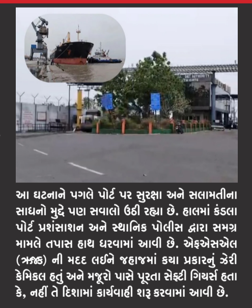
આ ઘટનાને પગલે પોર્ટ પર સુરક્ષા અને સલામતીના સાધનો મુદ્દે પણ સવાલો ઉઠી રહ્યા છે. હાલમાં કંડલા પોર્ટ પ્રશંસાશાળ અને સ્થાનિક પોલીસ દ્વારા સમગ્ર મામલે તપાસ હાથ ધરવામાં આવી છે. એક્સેસચેલ (અજ્ઞ) ની મદદ લઈને જહાજમાં કયા પ્રકારનું ઝેરી કેમિકલ હતું અને મજૂરો પાસે પૂરતા સેફ્ટી ગિયર્સ હતા કે, નહીં તે દિશામાં કાર્યવાહી શરૂ કરવામાં આવી છે.

રાજકોટ, તા. ૧૩ ગુજરાત સહિત સમગ્ર ભારતમાં સતત દુર્ઘટના ઘટી રહી છે ત્યારે ગઈકાલે કંડલા પોર્ટ પર ૧૩ નંબરની જેટી પર કામ કરતા ત્રણ મજૂરોના ઝેરી ગેસ ફાટી નીકળતા મોત નીપજ્યા છે. પ્રાથમિક અહેવાલ મુજબ, જહાજમાં રાખવામાં આવેલા લાકડામાં વપરાતા કેમિકલની ઝેરી અસરને કારણે આ દુર્ઘટના ઘટી હોવાની આશંકા છે. જેટી નંબર ૧૩ પર લાકડા ભરેલું એક જહાજ લાંગરવામાં આવ્યું હતું. આ જહાજમાં માલ ખાલી કરવાની કે, અન્ય કામગીરી દરમિયાન ત્રણ મજૂરો અચાનક બેભાન થઈ ગયા હતા. લાકડાને જંતુમુક્ત રાખવા માટે વપરાતા ઉગ્ર ઝેરી કેમિકલ અથવા ગેસની અસરને કારણે આ ત્રણેય શ્રમિકોના મોત થયા હોવાનું માનવામાં આવી રહ્યું છે. ઘટનાની જાણ થતા જ પોર્ટના ઉચ્ચ અધિકારીઓ અને એમ્બ્યુલન્સ ડાક્ટરો ઘટના સ્થળે દોડી ગયો હતો. શ્રમિકોને તાત્કાલિક સારવાર માટે ખસેડવામાં આવ્યા હતા, પરંતુ તબીબોએ તેમને મૃત જાહેર કર્યા હતા.