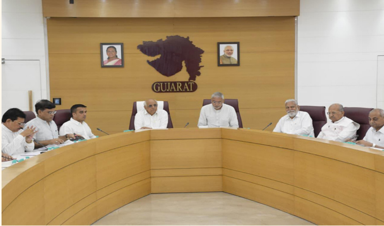
માટે ચાર-ચાર નામની ભલામણ સ્વીકારવામાં આવી છે. તાજેતરમાં મહિલા અનામત બીલ ભાજપ સરકારે પસાર કરીને ગૌરવ લીધું હતું. હવે પદાધિકારીઓની નિયુક્તિમાં પણ મહિલાઓને વધુ મહત્વ આપવા માટે મુખ્ય પાંચ પૈકી એક નહીં પરંતુ બે હોદ્દા પર મહિલાની નિમણૂક કરવામાં આવે તેવી શક્યત પણ વ્યકત થઈ છે. હાલના સાંપ્રત સમયમાં

રાજકોટ, તા. ૧૪ ગઈકાલે સવારના સમયે રાજકોટ મહાનગરપાલિકાના તમામ મુખ્ય હોદ્દાઓ માટે પ્રદેશ ભાજપ પાલમિન્ટ્રી બોર્ડની બેઠકમાં અનેક નામો પર ચર્ચા કરવામાં આવી હતી ત્યારે સૂત્રોના જણાવ્યા અનુસાર દરેક હોદ્દા માટે ચાર ચાર નામોની પેનલ બનાવવામાં આવી હોવાનું જાણવા મળ્યું હતું ત્યારે આ બોર્ડ બેઠકમાં શહેર ભાજપ પ્રમુખ, ધારાસભ્ય, સાંસદ સભ્ય, રાજકોટ શહેરના પ્રભારી મંત્રી સહિતના ટોચના ભાજપના આગેવાનો હાજર રહ્યા હતા અને નવા પદાધિકારીઓની પસંદગી માટે પોતાના સુજાનો આપ્યા હતા. સૂત્રોના જણાવ્યા અનુસાર હાલ જે નામો અંગે ચર્ચા વિચારણા કરવામાં આવી હતી. હાલ જે આંતરિક સૂત્રોના જણાવ્યા અનુસાર જે વિગતો મળી રહી છે તેમાં ચાર ચાર કોર્પોરેટરોના નામોની પેનલ રજૂ કરવામાં આવી છે એટલું જ નહીં ઘણા મહાનગરો સાથે સરખામણી તથા ત્યાંની પરિસ્થિતિ જોઈને અન્ય નામોમાંથી પણ પસંદગી કરવામાં આવે તો નવાઈ નહીં. બીજી મહત્વની વાત તો એ છે કે હાલ જે પેનલોમાં નામ આવ્યા છે તેમાંથી જ પાલમિન્ટ્રી બોર્ડ હોદ્દાઓ નક્કી કરે તેવું પણ જરૂરી નથી અન્ય નામો પર પણ વિચાર કરવામાં આવી શકે તેમ છે. રાજકોટના મેયર, ડે.મેયર, સ્ટે.ચેરમેન પદ