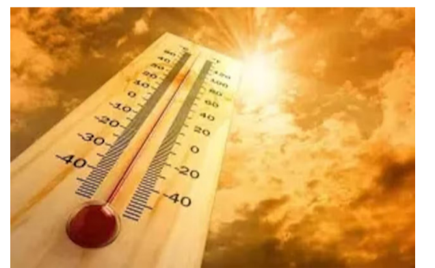
૪૧થી ૪૫ ડિગ્રી તાપમાન રહેવાનું અનુમાન છે. ૨૪ કલાક બાદ પવનની દિશા બદલાઈ શકે ૪૮ કલાક બાદ ધીમે ધીમે બેથી ચાર ડિગ્રી તાપમાન ઓછું થઈ શકે છે. કેટલાક વિસ્તારોમાં તોફાની પવન અને વરસાદ પડી શકે છે, જ્યારે અન્ય વિસ્તારોમાં ગરમીનો અનુભવ થઈ રહ્યો છે. આગામી ૩ થી ૪૮ કલાક ઘણા રાજ્યો માટે મહત્વપૂર્ણ માનવામાં આવે છે, કારણ કે આ તે સમયગાળો છે જે દરમિયાન હવામાન પ્રવૃત્તિ સૌથી તીવ્ર રહેવાની ધારણા છે.

રાજકોટ, તા. ૧૪ સૌરાષ્ટ્ર કચ્છના વાતાવરણમાં સતત બદલાવ જોવા મળી રહ્યો છે અને ગરમીનું પ્રમાણ ક્યાંક વધ્યું છે તો ક્યાંક ઘટ્યું પણ છે ગઈકાલની ઘટના ઉપર ધ્યાન કેન્દ્રિત કરવામાં આવે તો ખંભાળિયા તથા દેવભૂમિ દ્વારા જિલ્લામાં વંટોળિયો ફકાવો હતો અને લોકોને ગરમીમાંથી આંશિક રાહત પણ મળી હતી. તો બીજી તરફ અમદાવાદ ૪૪.૧ ડિગ્રી સાથે રાજ્યનું સૌથી ગરમ શહેર નોંધાયું છે. હાલ છે વિગત મળી રહી છે તે મુજબ રાજકોટનું ગઈકાલનું તાપમાન ૪૨.૨ ડિગ્રી નોંધાયું હતું. કચ્છ સુરેન્દ્રનગર સહિત ૧૧ જિલ્લામાં હીટ વેવની ચેતવણી પણ હવામાન વિભાગ દ્વારા આપવામાં આવી છે. હવામાનશાસ્ત્રીઓના જણાવ્યા અનુસાર બંગાળની ખાડી અને અરબી સમુદ્રની આસપાસ વિકસિત હવામાન પ્રણાલીઓ સમગ્ર ઉત્તર ભારત અને ગુજરાતના હવામાન પેટર્નને પ્રભાવિત કરી રહી છે. હવામાન વિભાગની આગાહી પ્રમાણે, ગુજરાતમાં આજે કચ્છ અને સુરેન્દ્રનગરમાં ઓરિજન એલર્ટ આપવામાં આવ્યું છે. અહીં આગ ઓકતી ગરમી પડવાની આગાહી છે. આ સાથે દ્વારકા, રાજકોટ, અમરેલી, બોટાદ, અમદાવાદ, વાડોદરા, ગાંધીનગર, પાટણ, બનાસકાંઠામાં યલો એલર્ટ સાથે હીટવેવની આગાહી આપવામાં આવી છે. ગુજરાતના અનેક વિસ્તારોમાં આગામી બે દિવસ