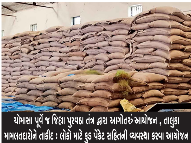
ચોમાસા પૂર્વે જ જિલ્લા પુરવઠા તંત્ર દ્વારા આગોતરું આયોજન, તાલુકા મામલતદારોને તાકીદ : લોકો માટે ફૂડ પેકેટ સહિતની વ્યવસ્થા કરવા આયોજન

ગોડાઉનમાં ઓછામાં ઓછા ત્રણ માસની જરૂરિયાત મુજબનો અનાજનો જથ્થો જળવાઈ રહે તેવું આયોજન કરવા જણાવ્યું છે. જો ભારે વરસાદને કારણે રસ્તાઓ બંધ થાય, તો અસરગ્રસ્ત ગામો સુધી ડમ્પર અથવા હાઈ-ચેસીસ વાહનો દ્વારા પુરવઠો પહોંચાડવા માટે ડ્રાઈવરો અને વાહનોની યાદી તૈયાર રાખવા મામલતદારોને સૂચના અપાઈ છે. આપત્તિ સમયે અસરગ્રસ્ત લોકો માટે ફૂડ પેકેટની વ્યવસ્થા કરવા તેમજ જિલ્લા અને તાલુકા ઇમરજન્સી ઓપરેશન સેન્ટર સાથે સતત સંકલનમાં રહેવા જણાવ્યું છે. તમામ પેટ્રોલ પંપ પર પેટ્રોલ-ડીઝલનો અનામત જથ્થો રાખવા અને ગેસ એજન્સીઓને ગેસ સિલિન્ડરનો બાકી રહેલ બેકલોગ શૂન્ય કરી સમયસર વિતરણ કરવા આદેશ અપાયા છે. આમ, ચોમાસા દરમિયાન