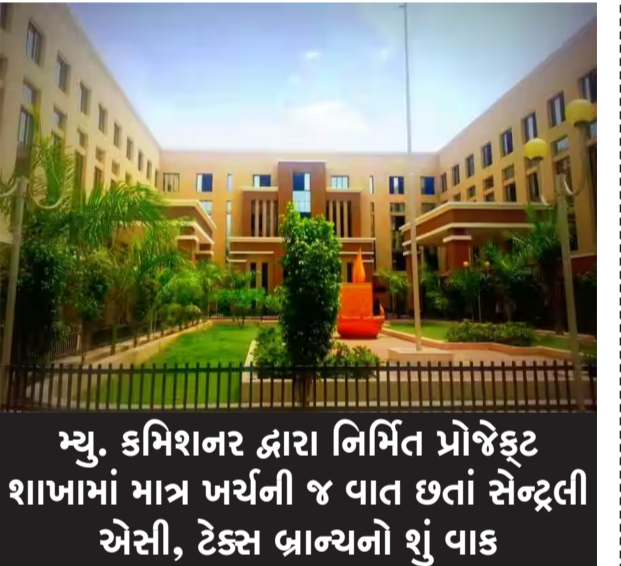
મ્યુ. કમિશનર દ્વારા નિર્મિત પ્રોજેક્ટ શાખામાં માત્ર ખર્ચની જ વાત છતાં સેન્ટ્રલી એસી, ટેક્સ બ્રાન્ચનો શું વાક

રાજકોટ, તા. ૧૫ સમગ્ર રાજ્યમાં હાલ ગરમી એ માઝા મૂકી છે અને ખાસ તાપમાન સરેરાશ ૪૩ ડિગ્રીને પાર પહોંચ્યું છે. આ સમયગાળા દરમિયાન રહેવાસીઓને ભારે હાલાકીનો સામનો પણ કરવો પડતો હોય તેવા એક નહીં અનેક વિધ ઉદાહરણો સામે આવ્યા. એક તરફ મહાનગરપાલિકાના આરોગ્ય વિભાગ દ્વારા એડવાઈઝરી બહાર પાડવામાં આવી છે કે કામ વગર લોકોએ બહાર ન નીકળવું પરંતુ ખુદ મહાનગરપાલિકાની કચેરીમાં જ ગુંગળામણ અને બકારો અસહ્ય થઈ ચૂક્યો છે જેના પગલે કોર્પોરેશનની કમાઉ બ્રાન્ચ એટલે કે ટેક્સ વિભાગના કર્મચારીઓ તથા અધિકારીઓએ સ્વખર્ચે એર કુલર મૂકી દીધા છે. જે ખરા અર્થમાં મહાનગરપાલિકા માટે યોગ્ય વાત ન કહી શકાય કારણ કે ખુદ સત્તાધીશો એ પણ આ બાબતની ગંભીરતા દાખવી જરૂરી છે કે તેમના કર્મચારીઓને ક્યા પ્રકારની તકલીફ પડે છે. હાલ જે સ્થિતિનું નિર્માણ થયું છે તેમાં પ્રોજેક્ટ બ્રાન્ચ કે જે કમિશનરના આદેશથી અને ભલામણથી શરૂ કરવામાં આવી અને તેનાથી મહાનગરપાલિકાને એક રૂપિયાની પણ આક ધવાની