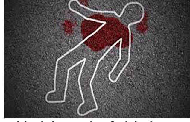
તેની સાથે એમના વતનનો મુશરફ ઉર્કે મુસા સલામ શોખ પણ હતો. આ વાતથી જાણ જ્યારે યાંદ શોખને થઈ ત્યારે બંને વચ્ચે વિવાદ વકર્યો હતો. દરમિયાન યાંદ શોખે વર્ષોથી દીકરી સાથે વાત કરાવવા માટે દબાણ કરતો હતો. આ વાતની જાણ જ્યારે યાંદ શોખને થઈ ત્યારે બંને વચ્ચે વિવાદ વકર્યો હતો. દરમિયાન યાંદ શોખે

રાજકોટ, તા.૧૫ જ કામ કરતા મિત્રની દીકરી પર ઘટનાઓ વધી ગઈ છે. આ વચ્ચે વધુ એક ચોંકાવનારી ઘટના સામે આવી છે. જેમાં એક યુવતિના એકતરફી પ્રેમમાં અંધ બની ગયેલા શખ્સે આ યુવતિના પિતાને પતાવી દીધા છે. પોતે જેને એકતરફી પ્રેમ કરતો હતો તે યુવતિના પિતા સાથે જ કામ કરતાં હોઈ આ બંને વચ્ચે બબાલ થયા બાદ તેણે કાતરના ઘા મારી યુવતિના પિતાને ઢાળી દીધા હતાં. વિગતો પર નજર કરીએ તો હત્યાની આ ઘટના સુરતના પુણા વિસ્તારમાં બની છે. એકતરફી પ્રેમમાં યુવકે કૂરતાની તમામ હદો વટાવી દીધી હતી. સાથે