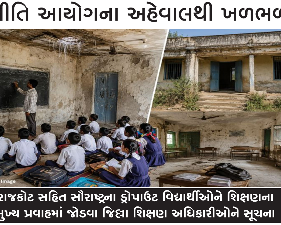
રાજકોટ સહિત સૌરાષ્ટ્રના ડ્રોપાઉટ વિદ્યાર્થીઓને શિક્ષણના મુખ્ય પ્રવાહમાં જોડવા જિલ્લા શિક્ષણ અધિકારીઓને સૂચના

રાજકોટ, તા. ૧૮ કેન્દ્ર સરકાર અને રાજ્ય સરકાર સંયુક્ત રીતે ભાર વગરના ભણતરની વાત કરી રહી છે અને તે દિશામાં અનેકવિધ પગલાંઓ લેવા માટેની પણ હાકલ કરવામાં આવી છે. અનેકવિધ યોજનાઓ પણ હાલ સરકાર દ્વારા અમલી બનાવવામાં આવી છે પરંતુ ક્યાંક ને ક્યાંક વાસ્તવિકતા એ છે કે સરકારના પ્રયાસો છતાં શિક્ષણનું સ્તર ગગડી રહ્યું છે. તેવામાં કેન્દ્ર સરકારના નીતિ આયોગ દ્વારા હાલ જે અહેવાલ રજૂ કરવામાં આવ્યો છે તેમાં પ્રાથમિક શિક્ષણમાં ૨૨ વિદ્યાર્થીઓ સામે એક શિક્ષક, જ્યારે માધ્યમિકમાં ૨૭ વિદ્યાર્થીઓ સામે એક શિક્ષક હોવાનો યોગ્યતાનો ખુલાસો કર્યો છે. મતલબ સ્પષ્ટ છે કે સરકારી શાળાઓમાં પણ હાલ શિક્ષકોની ઘટ ખૂબ વ્યાપક પ્રમાણમાં છે અગાઉ રાજ્ય સરકારના શિક્ષણ વિભાગ દ્વારા જ્ઞાન સહાયકોની ભરતી કરવામાં આવી હતી પરંતુ એ ભરતીમાં ઘણા ખરા શિક્ષકો સહભાગી થયા ન હતા અને