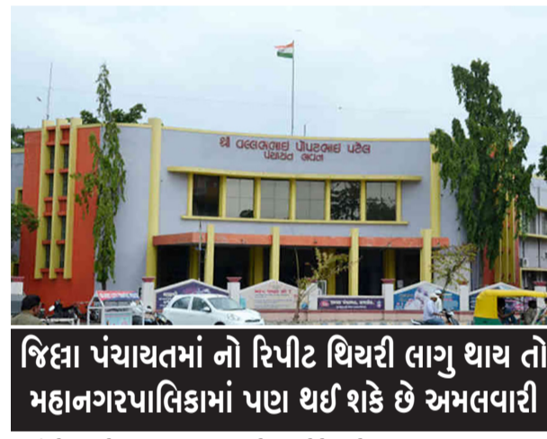
જિલ્લા પંચાયતમાં નો રિપીટ થિયરી લાગુ થાય તો મહાનગરપાલિકામાં પણ થઈ શકે છે અમલવારી

રહી છે કે રાજકોટ શહેરની જ્યારે પાલિમેન્ટરી બોર્ડ બેઠક મળી ત્યારે એક બુર્ગુ ભાજપના સક્રિય નેતાએ ચૂંટાયેલા સભ્યોન ઉપસ્થિતિમાં ટિકીટમાં રોકડી થયા અંગેનો પ્રશ્ન પુછતા જ થોડીવાર મિટીંગમાં સમ્રાટો મચી ગયો હોવાનું ચર્ચાઈ રહ્યું છે ત્યારે આ વાતને ધ્યાને લેવામાં આવે તો એ વાત તો સ્પષ્ટ છે કે મજબૂત અને હરિક્ષ્મ જૂથના પ્રયાસો એ છે કે હાલ જે નામો ચર્ચાઈ રહ્યાં છે તેઓને હોદ્દો ન મળે. આ તમામ બાબતોની ગંભીરતાને ધ્યાને લેતાં જો પ્રદેશ ભાજપ જિલ્લા પંચાયતમાં નો રિપીટ થિયરી અપનાવે તો તેની સીધી જ અસર મહાનગરપાલિકા ઉપર જોવા મળશે અને હાલ જે નામો ચર્ચાઈ રહ્યાં છે તેમાં પણ પૂર્ણ વિરામ લાગી શકે તો નવાઈ નહીં