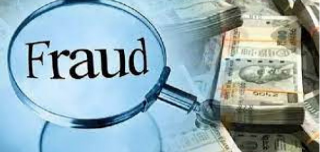
કોમ્પ્યુટર ઈન્સ્ટીટ્યુટમાં એડમિશન લેનારા અનેક છોતરાયા: બીજી ઘટનામાં લાખોની કાર ભાડે લઈ ગયા પછી પાછી જ ન દીધી