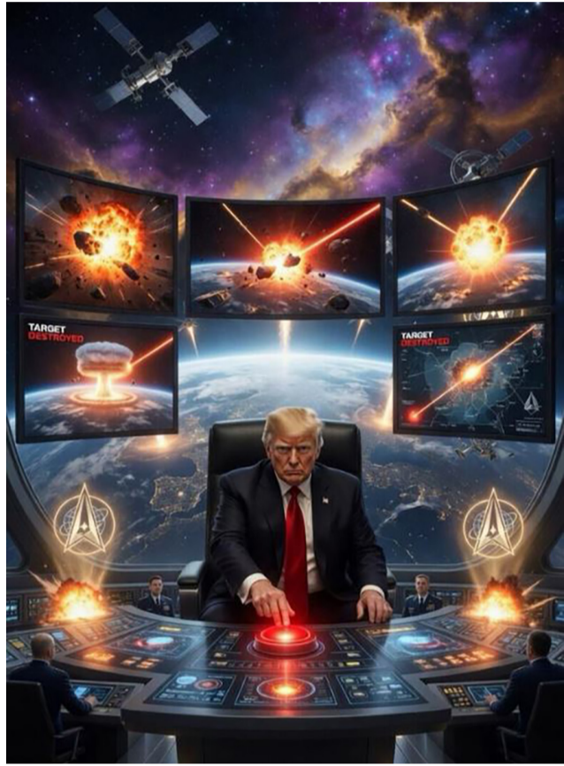
નવી દિલ્હી, તા.૧૮ અમેરિકા અને ઈરાન વચ્ચે ચાલી રહેલા યુદ્ધને કારણે મધ્ય પૂર્વમાં ભારે તણાવની સ્થિતિ છે. આ મહાગાંડ વચ્ચે બંને દેશોમાંથી કોણ પીછેહઠ કરશે તેના પર સમગ્ર

ઈરાનના નકશા પર અમેરિકાનો ઝંડો અને ટ્રમ્પે 'ફિલ બટન' દબાવતી તસવીરો કરી પોસ્ટ