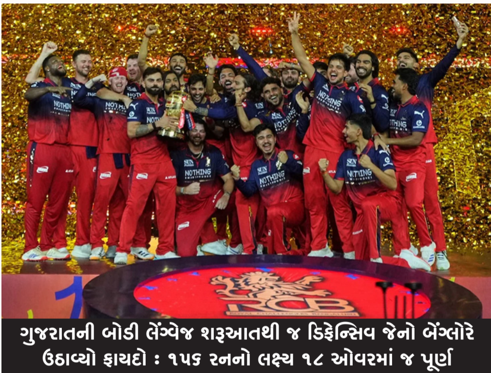
ગુજરાતની બોડી લેંગ્વેજ શરૂઆતથી જ ડિક્લેન્ડ જેનો બેંગલોરે ઉઠાવ્યો ફાયદો : ૧૫૬ રનનો લક્ષ્ય ૧૮ ઓવરમાં જ પૂર્ણ

રોયલ ચેલેન્જર્સ બેંગલોરે ગુજરાત ટાઈટન્સને પાંચ વિકેટે આપી મ્હાત: કિંગ કોહલીનું સ્ટાર પર્ફોમન્સ