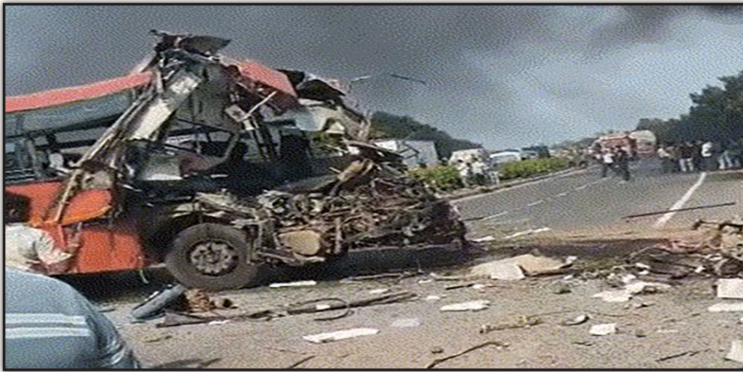
અમદાવાદ, તા. ૨ જુજ રાતમાં એક દુઃખદ અકસ્માતમાં આઠ લોકોના મોત થયા છે. સુરતના બારડોલી નજીક

૧૫ થી વધુ ઘાયલો સારવાર અર્થે હોસ્પિટલમાં : વડાપ્રધાને પાઠવી સાંત્વના : જાહેર કરી આર્થિક સહાય