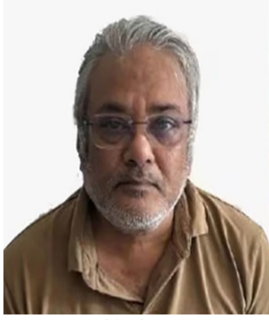
નવીદિલ્હી, તા. ૨ આંતરરાષ્ટ્રીય ડ્રગ ટ્રાફિકિંગ નેટવર્ક સામે મોટી કાર્યવાહીમાં, એન્ફોર્સમેન્ટ ડિરેક્ટોરેટ (ED) એ મુંબઈ, સુરત, અંકલેશ્વર અને

રાજકોટ સહિત ૨૦ સ્થળોએ દરોડા : દાઉદ ઇબ્રાહિમના નજીકના સાથીઓમાં