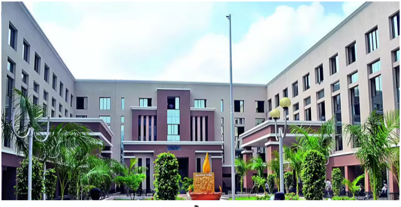
રાજકોટ, તા. ૪

મનપામાં ભ્રષ્ટાચારની ગંગાના બદલે સેવા યજ્ઞનો નવા ચૂંટાયેલા જન પ્રતિનિધિનો નિર્ધાર