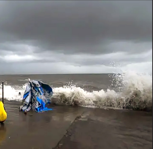
બેકકો યોજી હતી અને રાજ્યોને જિલ્લા સ્તરીય આકસ્મિક યોજનાઓ તાત્કાલિક અમલમાં મૂકવા નિર્દેશ આપ્યો હતો.

સરકારે આપત્તિ વ્યવસ્થાપન અને રાજ્ય અધિકારીઓ સહિત કટોકટી વ્યવસ્થાપન જૂથોની રચના કરી