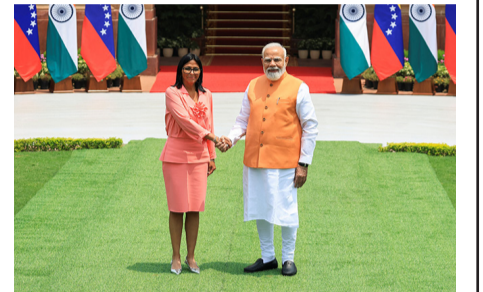
તેમની ભારતની મુલાકાત દરમિયાન વેનેઝુએલાના કાર્યકારી રાષ્ટ્રપતિ ડેલ્સી રોડ્રિગ્સ વડાપ્રધાન નરેન્દ્ર મોદીને મળ્યા હતા

નવી દિલ્હી, તા.૪ વડાપ્રધાન નરેન્દ્ર મોદી ગુરુવાર, ૪ જૂને રાષ્ટ્રીય રાજધાનીમાં વેનેઝુએલાના કાર્યકારી રાષ્ટ્રપતિ ડેલ્સી રોડ્રિગ્સને મળ્યા હતા. પશ્ચિમ એશિયા કટોકટીથી પુરવઠામાં વિક્ષેપ વચ્ચે નવી દિલ્હી તેના કૂડ ઓઇલ ખરીદીને વૈવિધ્યીકરણ કરવા માંગે છે ત્યારે રોડ્રિગ્સ બુધવારે ઊર્જા સહયોગને વિસ્તૃત કરવા માટે પાંચ દિવસની મુલાકાતે ભારત પહોંચ્યા હતા. જાન્યુઆરીમાં યુએસ દળો દ્વારા તત્કાલીન રાષ્ટ્રપતિ નિકોલસ માદુરોની અટકાયત બાદ રોડ્રિગ્સે વેનેઝુએલાના કાર્યકારી રાષ્ટ્રપતિ તરીકેનો કાર્યભાર સંભાળ્યો હતો. વિદેશ મંત્રી એસ જયશંકર અને વિદેશ સચિવ વિક્રમસિંહી પણ આ બેઠકમાં હાજર હતા. ભારત અને વેનેઝુએલા તેમની આ ચર્ચા દરમિયાન વેપાર, રોકાણ, ફાર્માસ્યુટિકલ્સ અને નવીનીકરણીય ઊર્જામાં સહયોગ કરશે. આ વ્યાપક એજન્ડાનો હેતુ ઊર્જા ઉપરાંત દ્વિપક્ષીય સંબંધોને મજબૂત બનાવવાનો છે, જે વિવિધ ક્ષેત્રોમાં સહયોગ વધારવામાં પરસ્પર હિતને દર્શાવે છે. આજે આગાઉ, ઊંચાનું જયશંકરે રોડ્રિગ્સ સાથે અલગથી મુલાકાત કરી હતી. જયશંકરે કહ્યું હતું કે તેઓ "આજે નવી દિલ્હીમાં વેનેઝુએલાના કાર્યકારી રાષ્ટ્રપતિ ડેલ્સી રોડ્રિગ્સને મળવાનો આનંદ અનુભવે છે. ભારત-વેનેઝુએલા સંબંધો પ્રત્યે તેમની લાંબા સમયથી પ્રતિબદ્ધતાની પ્રશંસા કરું છું. વેનેઝુએલાના કાર્યકારી રાષ્ટ્રપતિ સાથે અન્ય મંત્રીઓ છે, જેમાં વિદેશ, અર્થતંત્ર અને નાણાં, વિશાન અને ટેકનોલોજી, સંદેશવ્યવહાર અને માહિતી અને પરિવહન મંત્રીઓનો સમાવેશ થાય છે. ભારત વેનેઝુએલાના કૂડનું મુખ્ય પ્રોસેસર હતું, અને તેના સ્તરે દરરોજ ૪,૦૦,૦૦૦ બેરલથી વધુ