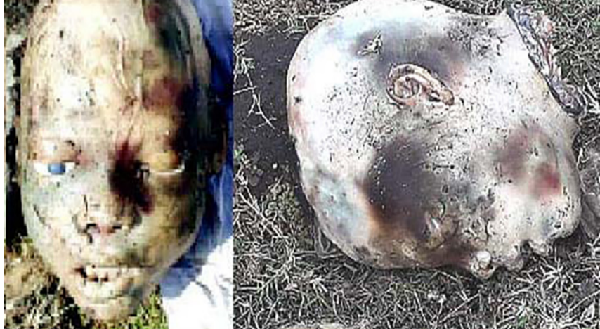
રાજકોટ, તા.૪ સૌરાષ્ટ્રભરમાં ચક્રવાર જગાવનાર કેસમાં આઠ વર્ષ પછી શહેર પોલીસને સફળતા મળવાની આશા જન્મી છે. શહેરના ભગવતીપરા