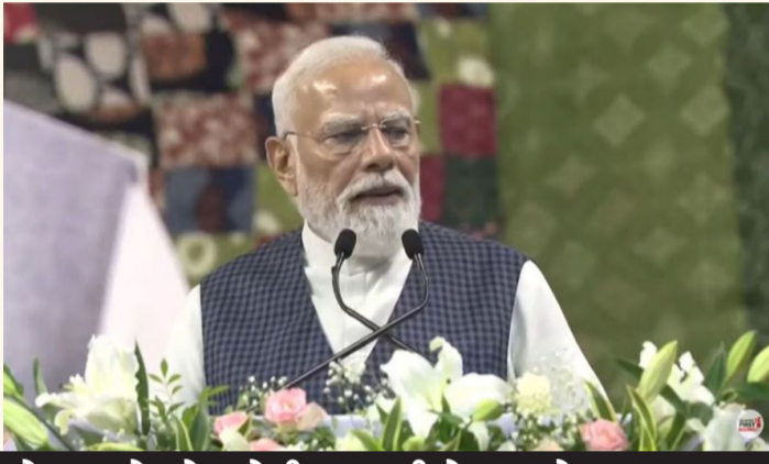
એક સમયે પ્લેગ જેવી મહામારીનો સામનો કરનાર સુરત આજે સમગ્ર દેશમાં સ્વચ્છતા અને ગ્રીન એનજીના મોડેલ તરીકે ઉભરી આવ્યું છે: વડાપ્રધાન નરેન્દ્ર મોદી

સુરત,તા.૫ વિશ્વ પર્યાવરણ દિવસના અવસરે વડાપ્રધાન નરેન્દ્ર મોદીએ સુરત ખાતેથી કેન્દ્ર અને રાજ્ય સરકારના કુલ ૨૪ વિવિધ પ્રોજેક્ટ્સનું ખાતમુહૂર્ત અને લોકાર્પણ કરી દક્ષિણ ગુજરાતને ૩,૧૮,૭૭૮ કરોડના વિકાસ પ્રકલ્પોની ભેટ આપી હતી. સુરતના દીનદયાળ ઉપાધ્યાય ઈન્ડોર સ્ટેડિયમમાં મુખ્યમંત્રી ભૂપેન્દ્ર પટેલ, નાયબ મુખ્યમંત્રી હર્ષ સંઘવી અને મંત્રીગણ, મહાનુભાવોની ઉપસ્થિતિમાં આયોજિત સમારોહમાં વડાપ્રધાનએ સુરતી સ્પિરીટની સરાહના કરતા જણાવ્યું હતું કે, સુરત માત્ર એક શહેર નથી, પણ 'સ્પિરીટ' છે. એક સમયે પ્લેગ જેવી મહામારીનો સામનો કરનાર સુરત આજે સમગ્ર દેશમાં સ્વચ્છતા અને ગ્રીન એનજીના મોડેલ તરીકે ઉભરી આવ્યું છે.