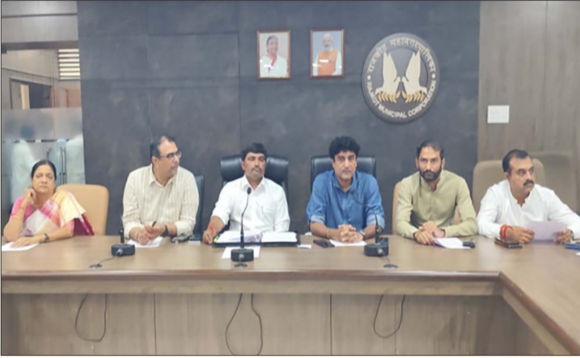
રાજકોટ, તા. ૫ મહાનગરપાલિકાની સ્ટેન્ડિંગ કમિટીની બેઠક ગઈકાલે મળી હતી જેમાં એજન્ડા પર રહેલી ૨૪ દરખાસ્ત પૈકી એક દરખાસ્ત નામંજૂર કરવામાં આવી છે તો ત્રણ અરજી-ટ દરખાસ્ત અધ્યક્ષ સ્થાનેથી મંજૂર કરાઈ

૨૪ દરખાસ્ત પૈકી બે વધુ અભ્યાસ અર્થે પેન્ડિંગ, એક નામંજૂર : રેસકોર્સ રીંગ રોડનું ડેકોરેશન, ગ્રીન પોલીસી દરખાસ્ત પેન્ડિંગ