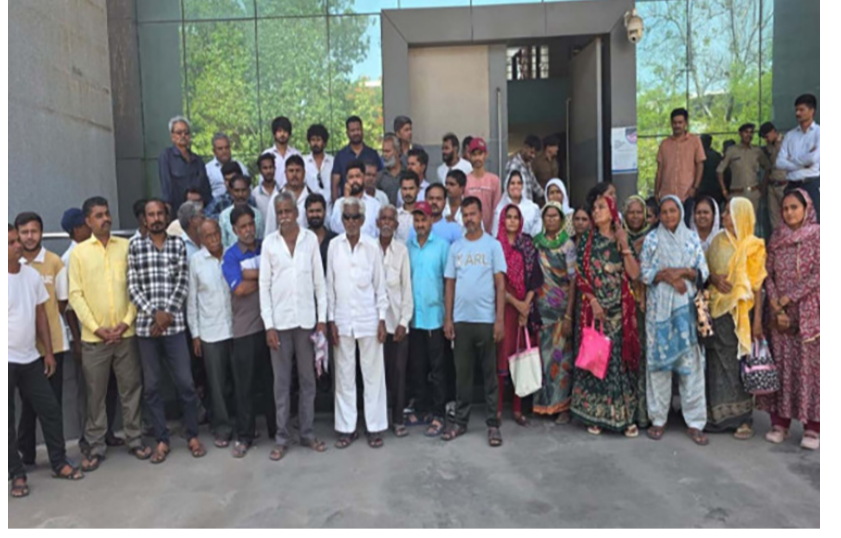
કલેક્ટરે સંબંધિત વિભાગના અધિકારીઓને તપાસના આપી આદેશ : ગ્રામજનોએ હાલવી હૈયાવરાળ

રાજકોટ, તા. ૧૦ રાજ્ય સરકારના ચોક્કસ આદેશથી હાલ તમામ સરકારી વિભાગો દ્વારા સરકારી જગ્યા પર દબાણો થયેલા હોય તેને દૂર કરવા માટેની કામગીરી હાથ ધરવામાં આવી રહી છે ત્યારે થોડા દિવસો પૂર્વે છે રાજકોટ તાલુકા મામલતદાર દ્વારા કોઠારીયાની સરકારી જમીન પરના ૧૦૦ જેટલા દબાણો મામલે નોટિસ પાઠવવામાં આવી હતી. જે બાદ ગઈકાલે કોઠારીયાના લોકોએ જિલ્લા કલેક્ટરને રૂબરૂ મળી રજૂઆત કરતા જણાવ્યું હતું કે, રાજકોટ નજીકના કોઠારીયા ગામમાં જમીન કૌભાંડ, મફત પ્લોટ અને અન્ય સરકારી યોજનાઓમાં મોટા પાયે ગેરરીતિઓ આચર્યા હોવાના ગંભીર આક્ષેપો કરવામાં આવ્યા છે.