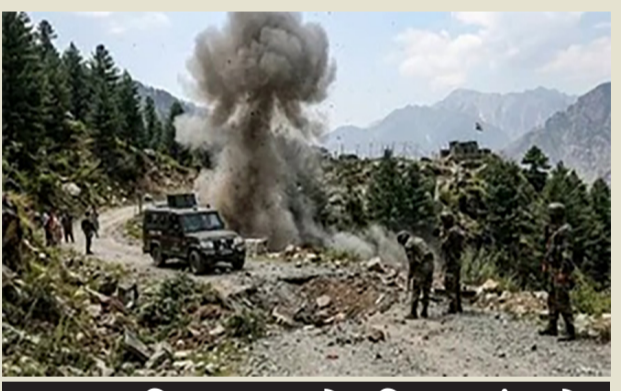
ફરજ દરમિયાન કમલકોટ વિસ્તારમાં થયો જોરદાર વિસ્ફોટ: ગંભીર હાલતમાં એરલિફ્ટ કરાયેલા બંને વીર જવાનોએ હોસ્પિટલમાં દમ તોડ્યો, સમગ્ર દેશમાં શોકનું મોજું

નવી દિલ્હી, તા. ૧૦ જમ્મુ-કાશ્મીરના ઉરી સેક્ટરમાં લાઈન ઓફ કન્ટ્રોલ (LoC) નજીકથી એક અત્યંત હદયદ્રાવક અને દુઃખદ ઘટના સામે આવી છે. મંગળવારે મોડી સાંજે ઉરીના કમલકોટ વિસ્તારમાં સરહદ પર પેટ્રોલીંગ અને ફરજ બજાવી રહેલા ભારતીય સેનાના જવાનો અચાનક એક ભયાનક બ્લાસ્ટનો ભોગ બન્યા હતા. આ આકસ્મિક વિસ્ફોટમાં સેનાના બે જવાન ગંભીર રીતે ઘાયલ થયા હતા અને ત્યારબાદ લશ્કરી હોસ્પિટલમાં સારવાર દરમિયાન તેમણે અંતિમ શ્વાસ લેતા વીરગતિને વર્યા હતા. આ ભયાનક ઘટનાને પગલે સમગ્ર ભારતીય સૈન્ય અને દેશ સહિત શહીદ જવાનોના પરિવારમાં ભારે શોકનું મોજું ફરી વળ્યું છે.