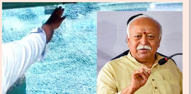
રેલવે તંત્ર અને સુરક્ષા એજન્સીઓમાં હોડધામ : એક્ઝિક્યુટિવ કોચ પર અજાણ્યા શખ્સોનો હુમલો, બારીના કાચ તૂટ્યા; સંઘ પ્રમુખ સહિત તમામ મુસાફરો સુરક્ષિત, સીસીટીવીથી તપાસ શરૂ

નવી દિલ્હી, તા. ૧૨ લખનઉથી નવી દિલ્હી જઈ રહેલી હાઈપ્રોફાઈલ શતાબ્દી એક્સપ્રેસ ટ્રેન પર ઉત્તર પ્રદેશના ફિરોઝાબાદ નજીક અચાનક પથ્થરમારો થવાની સળગતી ઘટના સામે આવતા રેલવે પ્રધાસન, ગુમ્વાર એ જ ન્સીઓ અને ઉચ્ચ સુરક્ષા દળોમાં ભારે હડકંપ મચી ગયો છે. આ ઘટના એટલે વધુ સંવેદનશીલ અને ગંભીર બની છે કારણ કે આ જ ટ્રેનમાં રાષ્ટ્રીય સ્વયંસેવક સંઘ (RSS)ના સરસંઘચાલક મોહન ભાગવત પણ મુસાફરી કરી રહ્યા હતા. આ અચાનક થયેલા હુમલામાં સદ નસીબે સંઘ પ્રમુખ મોહન ભાગવત અથવા અન્ય કોઈ પણ મુસાફરને જાનહાનિ કે શારીરિક ઈજા પહોંચી નથી અને તમામ લોકો સંપૂર્ણ સુરક્ષિત છે. જો કે, દેશના આટલા મોટા વીઆઈપી નેતા જે ટ્રેનમાં હોય તેના પર પથ્થરમારો થતાં સુરક્ષા વ્યવસ્થા સામે મોટા સવાલો ઉભા થયા છે અને તંત્ર દ્વારા આ મામલે સીસીટીવી (CCTV) ફૂટેજની ચકાસણી સહિત ઉચ્ચ સ્તરીય તપાસ શરૂ કરી દેવામાં આવી છે. સુરક્ષા સૂત્રો પાસેથી મળતી સત્તાવાર વિગતો મુજબ, ગુરુવારે સાંજે જ્યારે શતાબ્દી એક્સપ્રેસ ટ્રેન મકનનપુર અને ફિરોઝાબાદ રેલવે સ્ટેશન વચ્ચેના