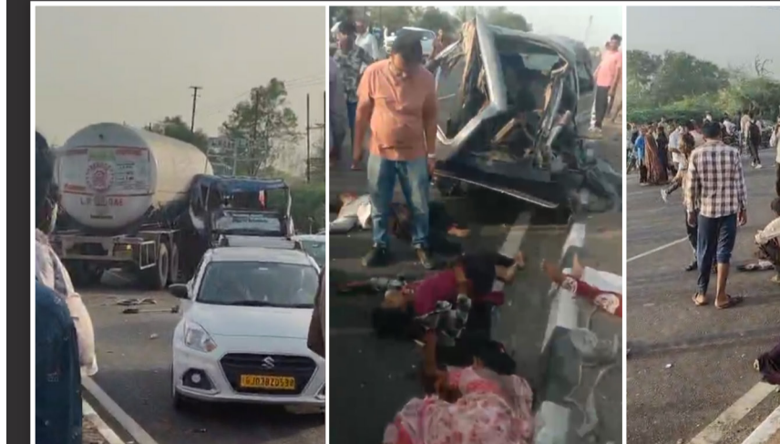
રાજકોટ, તા.૧૨ રાજકોટ: ચોટીલા-રાજકોટ હાઈવે પર બેટી રામપર ગામ નજીક આજે કાળજી કંપાવી મૂકે તેવી એક ગોઝારી

બેટી રામપર નજીક સર્જાયેલા ગોઝારા ઢ્રશ્યો ધુજાવી દેનારા: કારખાનેથી નોકરી પતાવી પરત ફરતા ડાભી અને મેઘાણી પરિવાર પર કાળનો પંજો, ગંભીર પ ઈજાગ્રસ્તો સારવાર હેઠળ