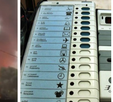
માળ ફૂટાવીને આગળ વધેલી આગની વિચિત્ર પેટર્નથી રાજકીય કાવતરાના આક્ષેપો; હાઈપ્રોફાઈલ તપાસ શરૂ

કોલકાતા, તા.૧૨ પશ્ચિમ બંગાળના પાટનગર કોલકાતાના અલીપુર વિસ્તારમાં આવેલી એક બહુમાળી સરકારી ઈમારતમાં બુધવારે અચાનક ભીષણ આગ ભભૂકી ઉઠતાં ભારે અકડાતકડી મચી ગઈ છે.