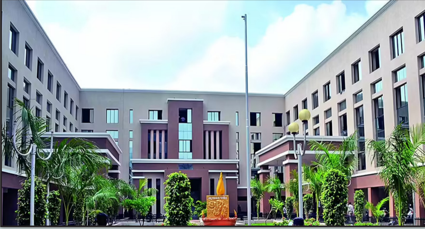
રાજકોટ, તા. ૧૨ મહાનગરપાલિકાના નવનિયુક્ત હોદ્દદારોની વર્ણી થઈ ચૂકી છે પરંતુ હજી ૧૫ સમિતિઓની રચના કરવામાં થયેલો પ્રથમ સમય વ્યક્ત થઈ ચૂક્યો છે અને એ વાતની પણ સ્પષ્ટતા થતી નથી કે ખાસ જનરલ બોર્ડ હવે ક્યારે બોલાવવામાં આવશે.

આવી હતી અને તેઓની નારાજગીને જોતા તેઓને શિક્ષણ સમિતિના ચેરમેનનું પદ આપવાનો નિર્ણય કર્યો હોવાનું સૂત્રોએ જણાવ્યું હતું પરંતુ ભાજપમાં કંઈ પણ થઈ શકે છે ત્યારે શિક્ષણ સમિતિ નું પદ કોને આપવામાં આવશે તે તો સમય જ જણાવશે પરંતુ હાલ ખાસ લોબિંગ શરૂ કરી દેવામાં આવ્યું છે.