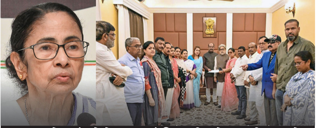
બળવાખોર સાંસદોએ NCPI માં વિલયની જાહેરાત કરી NDA ને સમર્થન આપ્યું, અસલી તુણમૂલ કોણ તેનો ફેસલો હવે કોર્ટમાં થશે

નવી દિલ્હી, તા.૧૪ દિલ્હીમાં રવિવારે એક મોટો રાજકીય ડ્રામા સર્જાયો હતો, જેમાં મમતા બેનરજીની પાર્ટી ટીએમસી (ઝમઈ) ના આશરે ૨૦ જેટલા સાંસદો બળવાખોર થઈ ગયા છે. આ તમામ નેતાઓ પહેલા ભાજપના મંત્રી ભૂષેન્દ્ર યાદવના ઘરે ગયા હતા અને ત્યાં આશરે બે કલાક સુધી મેરથોન બેઠક કરી હતી. ત્યાર બાદ આ તમામ બળવાખોર સાંસદોએ લોકસભા સ્પીકર ઓમ બિરલા સાથે પણ મુલાકાત કરી હતી. પશ્ચિમ બંગાળ વિધાનસભા ચૂંટણીમાં હાર બાદ તુણમૂલ કોંગ્રેસની અંદર લાંબા સમયથી ચાલી રહેલી કલહ અને નારાજગી હવે ખુલ્લીને સામે આવી ગઈ છે. બળવાખોર સાંસદોમાં સુદીપ બંધોપાધ્યાય, કાકોલી ઘોષ અને શતાબ્દી રોય જેવા મોટા અને ડિગ્ગજ નામો સામેલ છે. આ જૂથે સત્તાવાર રીતે જાહેરાત કરી છે કે, તેઓ અસમ, ત્રિપુરા, બંગાળ અને ઉત્તર-પૂર્વના રાજ્યોમાં અસ્તિત્વ ધરાવતી પનેશનાલિસ્ટ સિટિઝન્સ પાર્ટી ઓફ ઈન્ડિયા (એઈસી) થી નામની પાર્ટીમાં પોતાનો વિલય કરી રહ્યા છે. તેઓ હવે આગળ જઈને ભાજપની આગેવાની હેઠળના એનડીએ (ગઈએ) ગઠબંધનને પોતાનું પૂરું સમર્થન આપશે. આ બાગી સાંસદોની સંખ્યા બે-તૂતીયાંશથી વધુ હોવાથી તેમના પર પક્ષપલટા વિરોધી કાયદો લાગુ થશે નહીં, જે મમતા બેનરજી માટે એનડીએ સાથે મળીને કામ કરશે. આ જ મામલે અન્ય ડિગ્ગજ બાગી