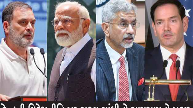
કેન્દ્રની વિદેશનિતિ પર રાહુલ ગાંધીનો સણસણાવો પ્રહાર

નવી દિલ્હી, તા.૧૪ ઓમાન દરિયા નજીક અમેરિકી સેન્ય કાર્યવાહીમાં ભારતીય નાવિકોના મોત અને હોર્મુઝ જળમાર્ગ અંગે અમેરિકાના તાજેતરના નિવેદનો પર કોંગ્રેસ નેતા રાહુલ ગાંધીએ વડાપ્રધાન નરેન્દ્ર મોદી પર આકરા પ્રહાર કર્યા છે. રાહુલ ગાંધીએ સવાલ ઉઠાવ્યો છે કે, અમેરિકાની ધમકી અને કડક સંદેશા છતાં પીએમ મોદી મૌન કેમ છે? તેમણે આક્ષેપ કર્યો કે કોઈપણ સાર્વભૌમ દેશ આવી ભાષા ક્યારેય સ્વીકારી ન શકે. રાહુલ ગાંધીની આ પ્રતિક્રિયા અમેરિકી વિદેશ મંત્રી માર્કો રબિયો અને ભારતીય વિદેશ મંત્રી એસ. જયશંકર વચ્ચેની વાતચીત બાદ સામે આવી છે, જેમાં અમેરિકાએ હોર્મુઝમાં પોતાના નિર્દેશોનું પાલન કરવા પર ભાર મૂક્યો છે. લોકસભામાં વિપક્ષના નેતા રાહુલ ગાંધીએ સોશિયલ મીડિયા પ્લેટફોર્મ એક્સ પર પોસ્ટ કરીને જણાવ્યું કે, અમેરિકી હુમલામાં ત્રણ ભારતીય