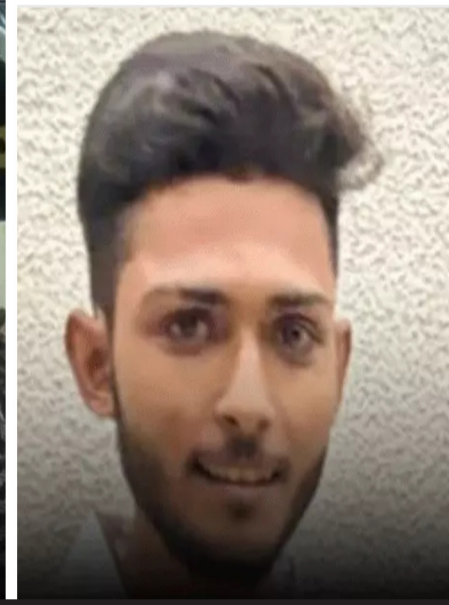
વચ્ચે પડેલા નાનાજી સાસુને પણ છરીના ઘા ઝીંકી દીધા: આરોપીને યુનિવર્સિટી પોલીસે સર્કજમાં લીધો

રાજકોટ, તા. ૧૪ શહેરના વિમલનગર રોડ પર આવેલી એક સોસાયટીમાં મોડી રાત્રે કોટ્ટેબિક ઝઘડા અને મનદુઃખના કારણે એક અત્યંત ચક્રચારી હત્યાની ઘટના સામે આવી છે. લગ્નજીવનના વિવાદની ખાર રાખીને દિકરીના જમાઈએ મોડી રાત્રે ઘરમાં ઘુસીને સુતેલા નાનાજી સસરા અને નાનીજી સાસુ પર છરી વડે આડેઘડ વાતકી હુમલો કરી દીધો હતો. આ હુમલામાં ગંભીર રીતે ઘવાયેલા વૃદ્ધ નાનાજી સસરાનું કચ્છા મોત નીપજ્યું છે, જ્યારે માજી સાસુને શરીરે ઘા વાગતા તેઓ લોહીલુહાણ હાલતમાં સિવિલ હોસ્પિટલમાં સારવાર હેઠળ