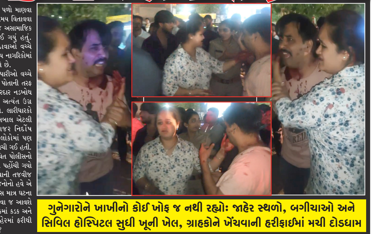
ગુનેગારોને ખાખીનો કોઈ ખોફ જ નથી રહ્યો: જાહેર સ્થળો, બગીચાઓ અને સિવિલ હોસ્પિટલ સુધી ખૂની ખેલ, ગ્રાહકોને ખેંચવાની હરીફાઈમાં મચી દોડધામ

રાજકોટ, તા. ૧૫ રાજકોટ શહેરમાં જાણે કાયદો અને વ્યવસ્થાની સ્થિતિ સાવ કચળી ગઈ હોય અને ગુનેગારોને ખાખી વર્દીનો કોઈ જ ભય ન રહ્યો હોય તેવો ડરામણો માહોલ ઊભો થયો છે. રંગીલા રાજકોટમાં છેલ્લા કેટલાક સમયથી લૂંટ, ચોરી, હત્યા અને ખૂની હુમલા જેવા ગંભીર બનાવો છાસવારે અને નિરંતર બની રહ્યા છે. ગુનેગારો અને અસામાજિક તત્ત્વો એટલા બેકામ બની ગયા છે કે તેમને કાયદાનો કે પોલીસનો કોઈ જ ડર રહ્યો નથી. અવારનવાર જાહેર વિસ્તારો, વ્યસ્ત ચોક, બગીચાઓ અને છેક સિવિલ હોસ્પિટલના પ્રાંગણમાં પણ મારામારી અને ખૂની હુમલાના બનાવો ખૂલેઆમ બની રહ્યા છે, જે શહેરની સુરક્ષા વ્યવસ્થા અને પોલીસની કામગીરી સામે મોટા સવાલો ઊભા કરે છે. આ કચળાતી કાયદાકીય પરિસ્થિતિ વચ્ચે વધુ એક શરમજનક ઘટના રાજકોટ શહેરનું હૃદય ગણાતા અને લોકોના આકર્ષણના કેન્દ્ર સમાન રેસકોર્સ ગ્રાઉન્ડ ખાતે બની છે. રેસકોર્સ ગ્રાઉન્ડની અંદર આવેલી ફૂડ કોર્ટ અને લારીખજારમાં ભારે હોબાળો મચી ગયો હતો. રોજ હજારો નાગરિકો, મહિલાઓ