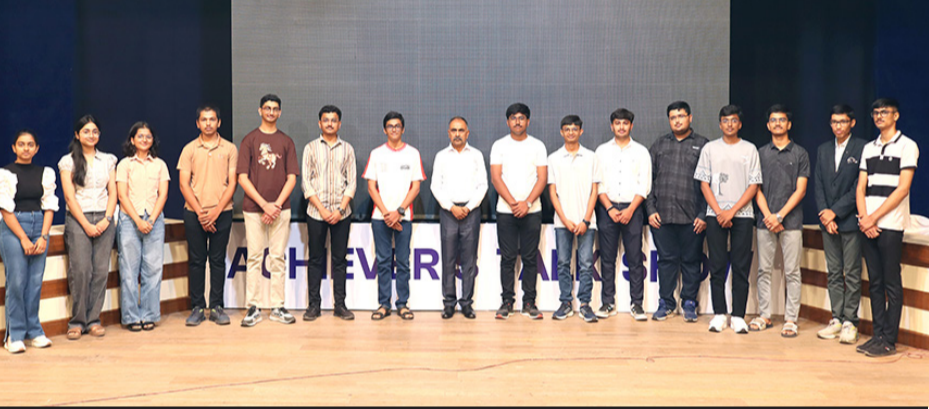
અચીવર્સ ટોક સોના માધ્યમથી આપી માહિતી

રાજકોટ, તા.૧૫ વર્ષ ૨૦૨૬માં CBSE બોર્ડ કે ગુજરાત બોર્ડ, ગુજકેટ તથા JEE (Mains + Advanced) માં મોદી સ્કૂલના પરિણામો સમગ્ર સૌરાષ્ટ્રમાં ટોચ પર રહીયાં છે. જ્યાં, JEE Mains માં ૯૯ PR કે તેથી વધુ ૭૪ વિદ્યાર્થીઓએ સ્થાન મેળવી સમગ્ર ગુજરાતમાં શાળા મોખરે રહી છે. આ