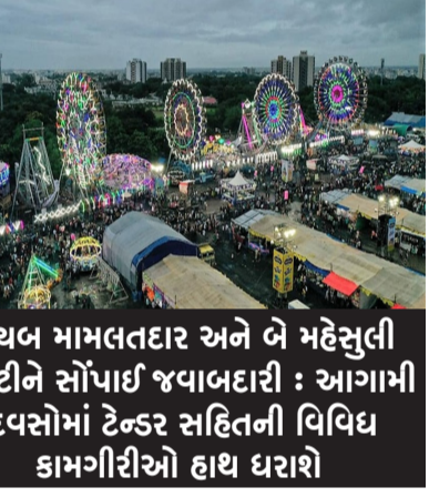
નાયબ મામલતદાર અને બે મહેસુલી તલાટીને સોંપાઈ જવાબદારી : આગામી દિવસોમાં ટેન્ડર સહિતની વિવિધ કામગીરીઓ હાથ ધરાશે

રાજકોટ, તા. ૧૫ લોકમેળાને લઈને તંત્ર અત્યારથી જ હરકતમાં આવી ગયું છે ત્યારે કલેક્ટર વિભાગ તથા લોકમેળા સમિતિ દ્વારા દર વખતની જેમ આ વખતે પણ રેસકોર્સમાં જ મેળો યોજવાનું નક્કી કરાયું છે. અગાઉ અટલ સરોવર નજીક લોકમેળાનું આયોજન હાથ ધરવામાં આવે તેવી વાત પ્રસરી હતી પરંતુ મોદી વાત એ સામે આવી છે કે કલેક્ટર વિભાગ દ્વારા જે ગ્રાન્ટ સરકાર પાસેથી માંગવામાં આવી તે ન મળતા હાલ આયોજન મુલતવી રાખવામાં આવ્યું છે અને દર વખતની જેમ રેસકોર્સમાં જ લોકમેળો યોજવાનું નક્કી કરાયું છે. ત્યારે આયોજનમાં કોઈ પણ પ્રકારનો પ્રશ્ન કે તકલીફ ઊભી ન થાય તે હેતુસર હાલ સમિતિની રચના પણ કરી દેવામાં આવી છે. રાજકોટ કલેક્ટર તંત્ર અને લોકમેળા સમિતિ દ્વારા શહેરના રેસકોર્સ ગ્રાઉન્ડમાં દર વર્ષની જેમ ચાલુ વર્ષે પણ શહેરના રેસકોર્સ ગ્રાઉન્ડમાં જન્માષ્ટમીના તહેવારો પર આયોજીત કરાયેલા લોકમેળા અંગે તૈયારીઓ આરંભી દેવામાં આવી છે. કલેક્ટર ડી. ઓમપ્રકાશ દ્વારા આ ભાતીગળ લોકમેળા માટે નાયબ મામલતદાર એક અને બે મહેસુલી તલાટીનું કાસ મહેકમ ફાળવી આ કર્મચારીઓને વિશેષ જવાબદારી સોંપી દેવામાં આવી છે. લોકમેળા માટે વિવિધ ટેન્ડરોની પ્રક્રિયા અને ફોર્મ વિતરણની કામગીરી પણ આગામી ટુંક સમયમાં જ શરૂ કરી દેવામાં આવનાર છે. લોકમેળા માટે જે ત્રણ કર્મચારીઓને જવાબદારી સોંપવામાં આવી છે. તેઓને