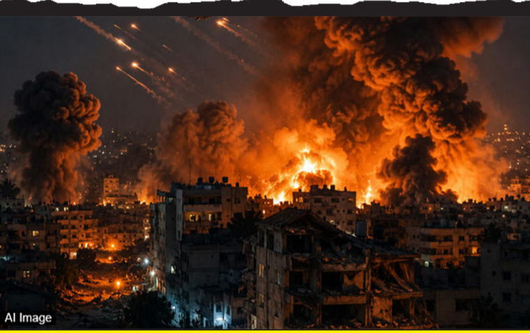
અમેરિકા અને ઈરાન વચ્ચે થયેલી શાંતિ સમજૂતીના ભવિષ્ય સામે હિંસક વળાંક

નવી દિલ્હી, તા.૧૯ અમેરિકા અને ઈરાન વચ્ચે મધ્ય પૂર્વમાં થાલી રહેલા સંઘર્ષને ખતમ કરવા અને લેબેનોનમાં કાયમી શાંતિ સ્થાપવા માટે એક ઐતિહાસિક કરાર પર હસ્તાક્ષર થયાના બરાબર એક દિવસ પછી લેબેનોનમાં કરી એકવાર ભીષણ હુમલાઓ થયા છે. દક્ષિણ લેબેનોનમાં ઈઝરાયલ દ્વારા રાતોરાત કરવામાં આવેલા શ્રેણીબદ્ધ એરસ્ટ્રાઈકમાં આશરે ૧૮ લોકોના મોત થયા છે અને ૩૩થી વધુ લોકો ઘાયલ થયા છે. બીજી તરફ, ઈઝરાયલની સેનાએ પણ સ્વીકાર્યું છે કે આ ઘર્ષણ દરમિયાન તેના ૪ સૈનિકો માર્યા ગયા છે. આ હિંસક વળાંકે અમેરિકા અને ઈરાન વચ્ચે થયેલી શાંતિ સમજૂતીના ભવિષ્ય સામે મોટા સવાલો ઊભા કરી દીધા છે.