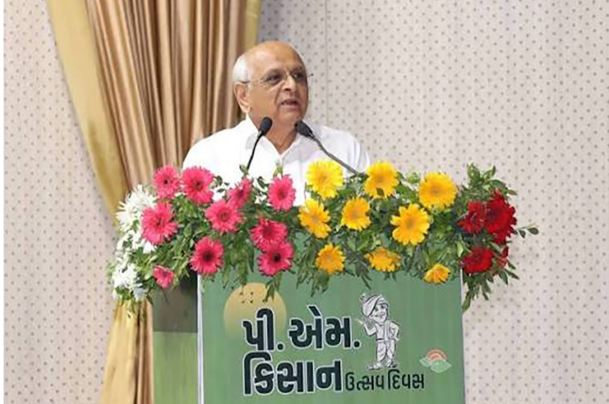
૨૩મા હમા અંતર્ગત દેશના ૯.૪૪ કરોડથી વધુ ખેડૂત પરિવારોને મળશે રૂ. ૧૮,૮૮૦ કરોડથી સહાય

ગાંધીનગર ખાતે મુખ્યમંત્રી ની અધ્યક્ષતામાં રાજ્યકક્ષાનો પીએમ કિસાન ઉત્સવ દિવસ યોજાશે