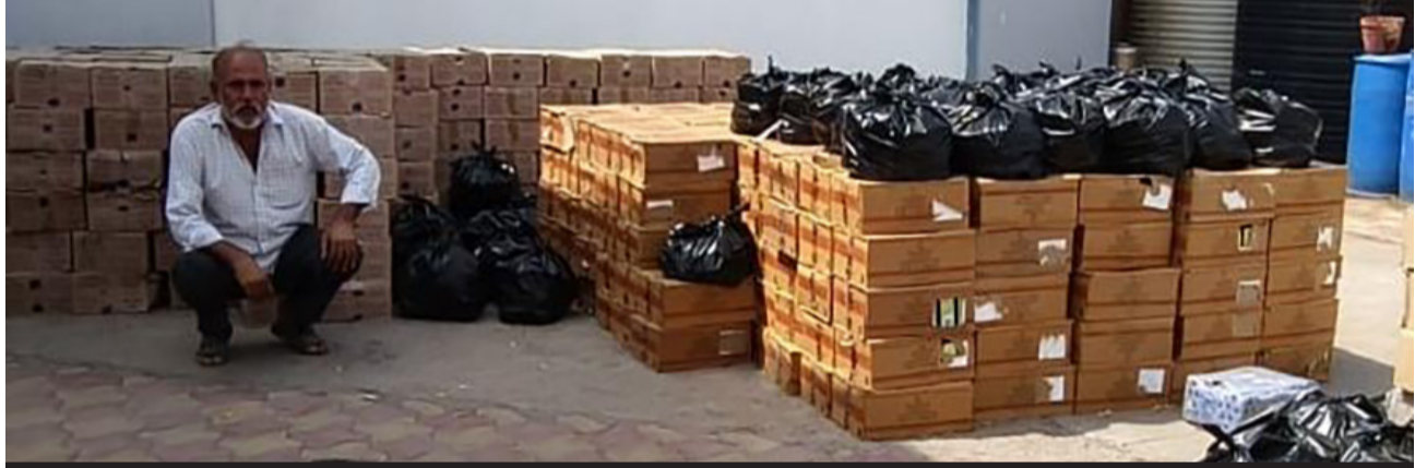
જંગલેશ્વરનો ફિરોઝ સંધિ અને સુલતાન સંધિ સહિત ૬ બુટલેગરો વોન્ટેડ; કુલ ૧ કરોડથી વધુનો મુદ્દામાલ જપ્ત કરતી સ્ટેટ મોનિટરિંગ સેલ

રાજકોટ, તા.૧૯ શહેરના આજીડેમ પોલીસ સ્ટેશન વિસ્તારમાંથી લાખો રૂપિયાનો વિદેશી દારૂ પકડવાના ગણતરીના દિવસોમાં જ સ્ટેટ મોનિટરિંગ સેલની ટીમે સ્થાનિક પોલીસની હાજરી વચ્ચે વધુ એક મોટું ઓપરેશન પાર પાડ્યું છે. આ વખતે એસએમસીની ટીમે કુવાડવા રોડ પોલીસ સ્ટેશનની હદમાં દરોડો પાડીને રૂ. ૭૦ લાખ ૩૮ હજારથી વધુની કિંમતનો વિદેશી દારૂનો મસમોટો જથ્થો ઝડપી લીધો છે. પોલીસ તપાસમાં ખુલ્લેલી વિગતો મુજબ, આ દારૂનો જથ્થો જંગલેશ્વર