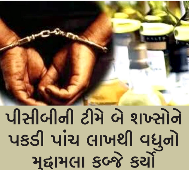
પીસીબીની ટીમે બે શખ્સોને પકડી પાંચ લાખથી વધુનો મુદ્દામલા કબ્જે કર્યો

રાજકોટ: તા.૧૯ દાડની હેરાફેરી અટકાવવા પીસીબીની ટીમ રોજબરોજ સફળ દરોડા પાડી રહી છે. વધુ એક વખત કારમાં થઈ રહેલી હેરાફેરી અટકાવી બે શખ્સને વ્હીસ્કી, જામુન વોડકા સાથે ઝડપી લીધા હતાં.