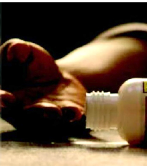
પરંતુ કામધંધો બરાબર ચાલતો ન હોઈ આને કારણે સતત ટેન્શનમાં રહેતાં

હતા. આર્થિક ભીંસ પણ ઉભી થઈ હોઈ કંટાળીને આ પગલુ ભરી લીધું હતું. બનાવને પગલે પીપળીયા-સુશર પરિવારમાં ગમગીની વ્યાપી ગઈ હતી. કામધંધામાં મંદી અને ઘરમાં ઉભી થયેલી આર્થિક સંકડામણ સામે હારી જઈ પરિવારના મોભીએ દુનિયા છોડી દીધી હતી. તેઓ તો કદાચ સમસ્યાથી કાયમી છુટકારો મેળવી ગયા પણ પાછળ રહી ગયેલા સ્વજનોને કારમો આઘાત આપી ગયા છે.