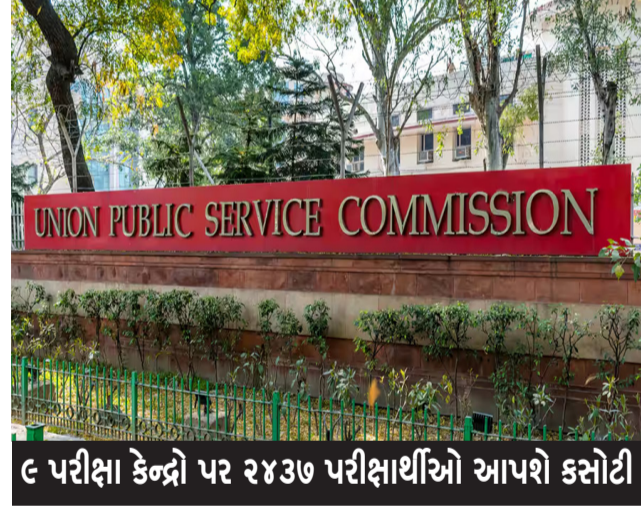
૯ પરીક્ષા કેન્દ્રો પર ૨૪૩૭ પરીક્ષાર્થીઓ આપશે કસોટી

રાજકોટ, તા. ૨૨ સિવિલ સર્વિસમાં યુવા વર્ગ આવવા માટે સખત પરિશ્રમ અને મહેનત કરી રહ્યું છે ત્યારે સમયાંતરે યુનિયન પબ્લિક સર્વિસ કમિશન દ્વારા વિવિધ પરીક્ષાઓ લેવામાં આવતી હોય છે આ પરીક્ષા અત્યંત કઠિન હોવાના કારણે હાલ અનેકવિધ રીતે સુરક્ષાના ભાગરૂપે વહીવટી તંત્ર દ્વારા તૈયારીઓ પણ હાથ ધરવામાં આવે છે. ત્યારે આવતીકાલે રાજકોટ ખાતે યુપીએસસી દ્વારા સિવિલ સર્વિસની પ્રિલિમિનરી પરીક્ષા સમગ્ર દેશભરમાં યોજાશે. હાલ આ માટે વહીવટી તંત્ર દ્વારા તમામ જરૂરી વ્યવસ્થાઓ પૂર્ણ કરી લેવામાં આવી છે અને પરીક્ષાર્થીઓને કોઈપણ પ્રકારની