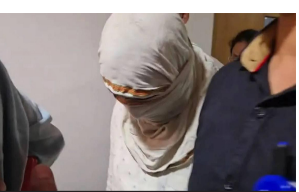
નેશનલ ટેસ્ટિંગ એજન્સી દ્વારા તેની નિમણૂક નિષ્ણાત તરીકે કરવામાં આવી હતી