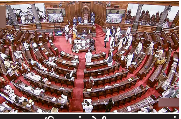
ગુજરાતના ઇતિહાસમાં પહેલી વાર રાજ્યસભામાં ગુજરાતનો કોઈ કોંગ્રેસ પ્રતિનિધિ નહીં હોય

પાડ્યું છે. આગામી જૂનની ૧૮ તારીખે રાજ્યસભાની ચૂંટણીનું મતદાન યોજાશે. ૧૦ રાજ્યોની ૨૪ બેઠકો માટે તારીખ જાહેર કરાઈ છે. ગુજરાતમાં ભાજપના રામ મોકરિયા, નરહરી અમિન અને રમીલાબેન બારા સહિત કોંગ્રેસના શક્તિસિંહ ગોહિલની ટર્મ પૂર્ણ થઈ રહી છે. રાજ્યસભાની ચૂંટણી માટે ૮મી જૂને કોર્મ ભરવાની અંતિમ તારીખ છે. ૯મી જૂને કોર્મની ચકાસણી થશે. જ્યારે ૧૧ જૂને કોર્મ પરત ખેંચવાની અંતિમ તારીખ છે. ૨૦મી જૂને ચૂંટણીની કામગીરી પૂર્ણ થશે. હાલમાં ગુજરાત વિધાનસભામાં કોંગ્રેસના સાંસદોની સંખ્યા ખૂબ જ ઓછી છે. બીજી તરફ ભાજપે ગત વિધાનસભામાં જબરદસ્ત પ્રદર્શન કરીને કોંગ્રેસને કારમી માત આપી છે. ત્યારે રાજ્યસભાની ચારેય બેઠક પર ભાજપના ઉમેદવાર બિનહરીફ જીતી શકે છે. કણાટિક, આંધ્રપ્રદેશ અને ગુજરાતમાંથી ચાર-ચાર બેઠકો ખાલી થશે. રાજસ્થાન અને મધ્યપ્રદેશમાંથી ત્રણ-ત્રણ બેઠકો ખાલી થશે.