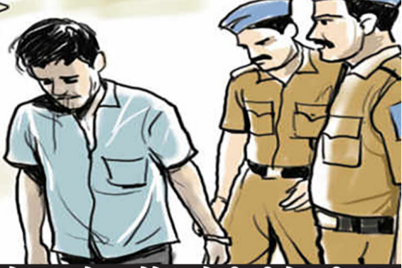
પેરોલ ફરલો સ્કવોડે દબોચી લીધો: બીજી તરફ દાણા ગુનામાં બે વર્ષથી ફરાર ગોંડલના શખસને આજીવન પોલીસે પકડી લીધો

વિગતો પર નજર કરીએ તો શહેર પોલીસની કાઈમ શ્રાંચ શાખા હેઠળ કામ કરતી પેરોલ ફરલો સ્કવોડે રાજકોટ શહેર મહિલા પોલીસ સ્ટેશનમાં વર્ષ ૨૦૧૭માં નોંધાયેલા દુષ્કર્મના ગંભીર ગુનામાં છેલા ૯ વર્ષથી પોલીસને થાપ આપી નાસતા-ફરતા આરોપીને ચોક્કસ ખાતમી અને ટેકનિકલ એનાલિસિસના આધારે રાજકોટ શહેરમાંથી જ દબોચી લીધો હતો. અલગ અલગ ગુનામાં લાંબા સમયથી પોલીસ પકડથી દૂર રહેલા નાસતા-ફરતા અને પેરોલ જમ્મ થયેલા આરોપીઓને ઝડપી પાડવા