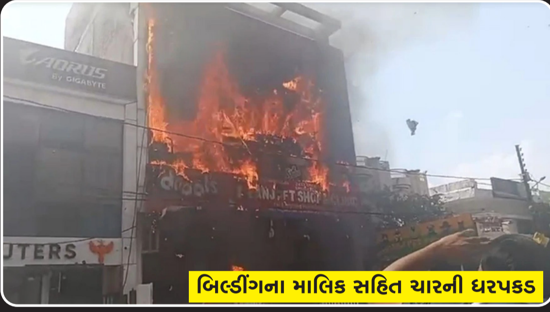
બિલ્ડિંગના માલિક સહિત ચારની ધરપકડ

નવી દિલ્હી, તા.૨૨ ઉત્તર પ્રદેશની રાજધાની લાખનઉમાંથી એક અત્યંત હૃદયદ્રાવક અને ગમખવાર દુર્ઘટનાના સમાચાર સામે આવ્યા છે. લાખનઉના અલીગંજ વિસ્તારમાં પુરનિયા ચોરાહા પાસે આવેલી એક બહુમાળી ઈમારતમાં આજે અચાનક ભીષણ આગ ફાટી નીકળી હતી. આ ભયાનક દુર્ઘટનામાં અત્યાર સુધીમાં ૧૮ લોકોએ પોતાના જીવ ગુમાવ્યા હોવાની સત્તાવાર પુષ્ટિ થઈ ચૂકી છે. મૃત્યુ પામનાર મોટાભાગના યુવાનો ૨૦ થી ૨૪ વર્ષની નાની વયના હોવાનું જાણવા મળ્યું છે, જેના કારણે મૃતકોના પરિવારો પર આભ તૂટી પડ્યું છે. શરૂઆતની માહિતીમાં આ અકસ્માત કોચિંગ સેન્ટર અથવા લાઈબ્રેરીમાં થયો હોવાનું કહેવાતું હતું. પરંતુ, બાદમાં વરિષ્ઠ પોલીસ અધિકારીઓએ સ્પષ્ટતા કરી છે કે આ ઈમારતમાં મોટા ભાગના કોચિંગ ક્લાસ અને એક ગેમિંગ ઝોન કાર્યરત હતા.