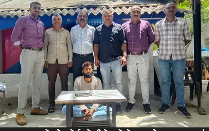
જુનાગઢ ગામે એરપોર્ટ પોલીસે દરોડો પાડ્યો: જૂગટુ રમતાં સગીર સહિત સાત ઝડપાયા, દસ જણા મુઠ્ઠીયું વાળીને ભાગ્યા

પણ તેમાંથી રોકડ, દાગીના, મોબાઇલ ફોન સહિતની માલમત્તા ગાયબ હતી. રેલ્વે એલસીબી પીઆઈ જે. આર. દેસાઈએ