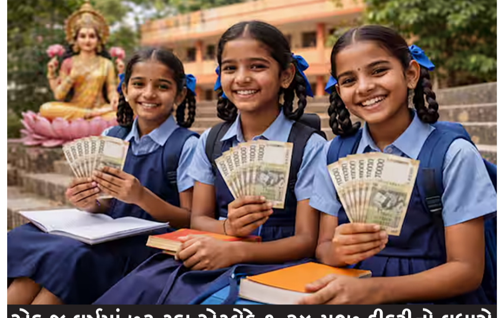
એક જ વર્ષમાં ૭૩ ટકા એટલેકે ૧,૨૪,૫૦૭ દીકરીનો વધારો

ગાંધીનગર, તા.૨૨ ગુણવત્તાયુક્ત શિક્ષણના વિઝનને સાકાર કરવા વડાપ્રધાન નરેન્દ્ર મોદીના, મુખ્યમંત્રી ભૂપેન્દ્ર પટેલના સક્ષમ નેતૃત્વ હેઠળ ગુજરાત સરકારે શિક્ષણ ક્ષેત્રે નવો ઈતિહાસ રચ્યો છે. રાજ્યની દીકરીઓને ધોરણ-૧૨ સુધીનો અભ્યાસ પૂર્ણ કરવા પ્રોત્સાહિત કરતી 'નમો લક્ષ્મી યોજના' અને વિજ્ઞાન પ્રવાહના વિકાસ માટેની 'નમો સરસ્વતી વિજ્ઞાન સાધના યોજના' ના કારણે શાળાઓમાં વિદ્યાર્થીઓની હાજરી અને પ્રવેશમાં અભૂતપૂર્વ વધારો નોંધાયો છે. વિદ્યા સમીક્ષા કેન્દ્રના ઓનલાઈન મોનિટરિંગના આધારે ગત એક જ વર્ષમાં શિક્ષણ જગતમાં આવેલા સકારાત્મક બદલાવની વિગતો જોઈએ તો આર્થિક મુશ્કેલીના કારણે દીકરીઓનું શિક્ષણ અધવચ્ચેથી છૂટી ન જાય તે હેતુથી શરૂ કરાયેલી આ યોજનાના પરિણામે કન્યા કેળવણીને મોટો વેગ મળ્યો છે. ધોરણ-૯ થી ૧૨ના વર્ગખંડોમાં ૮૦૮૬૧ દીકરી આપનારી વિદ્યાર્થીનીઓની સંખ્યા વર્ષ ૨૦૨૪-૨૫માં ૧,૭૧,૯૮૮ હતી, જે વર્ષ ૨૦૨૫-૨૬માં વધીને ૨,૯૬,૪૯૫ થઈ ગઈ છે. એટલે કે એક જ વર્ષમાં ૧,૨૪,૫૦૭ દીકરીઓનો (૭૩૨૬૧