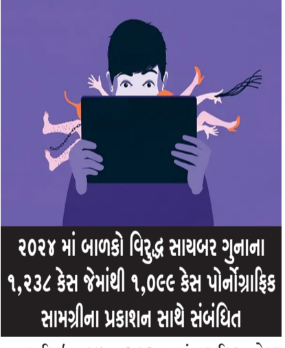
૨૦૨૪ માં બાળકો વિરુદ્ધ સાયબર ગુનાના ૧,૨૩૮ કેસ જેમાંથી ૧,૦૯૯ કેસ પોર્નોગ્રાફિક સામગ્રીના પ્રકાશન સાથે સંબંધિત

રાજકોટ, તા. ૨૪ ગયા વર્ષે બાળકો વિરુદ્ધના ગુનાઓમાં પાંચ ટકાનો વધારો થયો છે. નવી દિલ્હી, એજન્સી. દેશમાં બાળકો વિરુદ્ધના સાયબર ગુનાઓ વધુને વધુ ગંભીર બની રહ્યા છે. નેશનલ કાર્ટમ રેકોર્ડ્સ બ્યુરો (ગઈછ) ના ૨૦૨૪ ના ડેટા અનુસાર, બાળકો વિરુદ્ધના સાયબર ગુનાના ૧૦ માંથી ૯ કેસ પોર્નોગ્રાફિક સામગ્રીના પ્રસારણ સાથે સંબંધિત હતા. ડેટા અનુસાર, ૨૦૨૪ માં બાળકો વિરુદ્ધ સાયબર ગુનાના ૧,૨૩૮ કેસ નોંધાયા હતા, જેમાંથી ૧,૦૯૯ કેસ બાળકો સાથે સંકળાયેલી પોર્નોગ્રાફિક સામગ્રીના પ્રકાશન અથવા પ્રસારણ સાથે સંબંધિત હતા. રાજ્યવાર આંકડાઓમાં, છત્તીસગઢ ૨૬૮ કેસ સાથે ટોચ પર છે, ત્યારબાદ રાજસ્થાન ૧૭૪, દિલ્હી ૧૫૧, ઉત્તર પ્રદેશ ૧૩૭ અને કેરળ ૯૨ કેસ સાથે આવે છે.