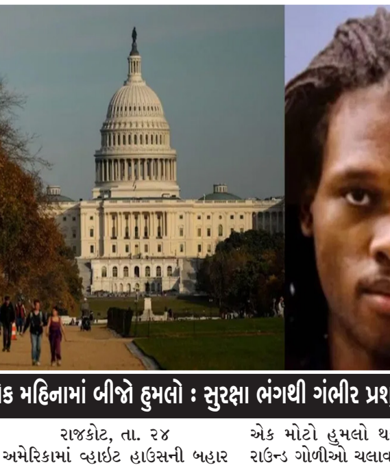
એક મહિનામાં બીજો હુમલો : સુરક્ષા ભંગથી ગંભીર પ્રશ્નો થયા ઉભા

યુધિષ્ઠિરને ઈન્દ્રપ્રસ્થ અને હસ્તિનાપુર બંનેના રાજા બનાવવામાં આવ્યાં. યુદ્ધમાં બને પક્ષે ઘણાં મહાન વીર અને અસંખ્ય સૈનિકો માર્યા ગયાં હતાં. યુધિષ્ઠિરે ફરી દયા બતાવીને ધૃતરાષ્ટ્રને હસ્તિનાપુરના રાજા બની રહેવા કહ્યું. ધૃતરાષ્ટ્રની ભૂલો અને તેના પુત્રોની દુષ્ટિ છતાં યુધિષ્ઠિરે તેમને વડીલ તરીકે પૂરું સન્માન અને સલામતી આપી, આ જોઈ એ ગદગદ થઈ ગયા, અને યુધિષ્ઠિરને પંદર વર્ષ સંયુક્ત શાસન કર્યું, જેમાં ધૃતરાષ્ટ્ર દ્વારા માર્ગદર્શન આપવામાં આવ્યું. પછી ધૃતરાષ્ટ્ર ગાંધારી કુંતી અને વિદુર સાથે વાનપ્રસ્થાશ્રમ માટે જંગલમાં ચાલ્યાં ગયાં, અને હિમાલયા જંગલમાં લાગેલી એક દાવાનળમાં મૃત્યુ પામ્યાં. ધૃતરાષ્ટ્ર પહેલાં સત્યવતી નો વારસદાર માટેનો મોહ, અને મોહ સાથે સાથે જો ઈર્ષા પણ જોડાય તો મહાભારત રચાય! એટલે કે પાંડવોને ખાંડપ્રસ્થ આપી દીધાં પછી એની હસ્તિનાપુર ની રાજગાદી સલામત નહીં, પરંતુ પાંડવો એને ઈન્દ્રપ્રસ્થ બનાવી સુખ શું કામ ભોગવે છે! એ ઈર્ષાને કારણે એ રાજ્ય પડાવી લેવા ઘુતની આખું પડખું રચાયું! જોકે પાંડવો રમવાનો ઈન્કાર કરી શક્યાં હોત! અથવા તો રાજ્ય કે પત્ની એને દાવ પર લગાવવું ચોચ નથી એવું વિચારી શક્યા હોત! આવી તો એવી કેટલીય વાતો છે, જેને આપણે પડકાર પાછળની લીલા તરીકે સ્વીકારવી પડે છે! પણ મૂળમાં વસુ, વસ્તુ, અને વ્યક્તિનાં મોહનું આ પરિણામ છે! એ વાત યાદ રાખી, આપણી આંગળીઓથી એ ઘણાં દુઃરાશીઓ! જેથી એની ઉલ્લજન સુલગ્ધાવચનમાં જીંદગી ચાલી જાય નહીં! એવી એક અનન્ય પ્રાર્થના ઈશ્વર ચરણે રાખી, હું મારા શબ્દોને આજે અહીં જ વિરામ આપું છું. ફરી મળીશું નાનું ચિંતન મનન સાથે, તો સૌને મારાં આજનાં દિવસનાં રમેહ વંદન અને જય સૌરાષ્ટ્ર.