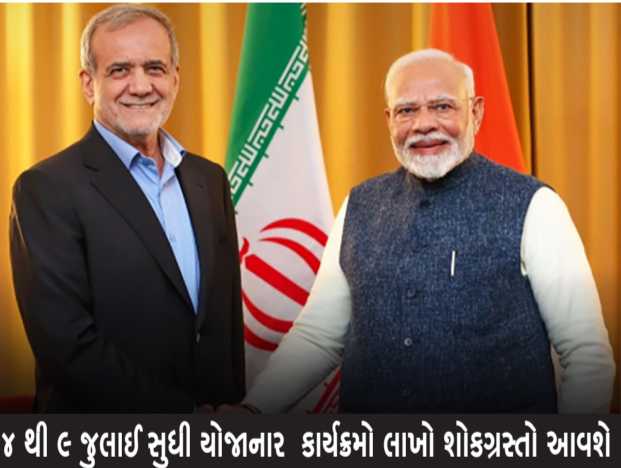
૪ થી ૯ જુલાઈ સુધી યોજનાર કાર્યક્રમો લાખો શોકગ્રસ્તો આવશે

નવી દિલ્હી, તા. ૨૪ ઇરાનના રાષ્ટ્રપતિ મસ્દૂદ પેઝેશ્કિયાને પ્રધાનમંત્રી નરેન્દ્ર મોદીને સ્વર્ગસ્થ સર્વોચ્ચ નેતા આયાતુદ્ધાહ સૈયદ અલી બામેનીના રાજ્ય અંતિમ સંસ્કાર અને દફન સમારોહમાં હાજરી આપવા આમંત્રણ આપ્યું છે. ૪ જુલાઈથી ૯ જુલાઈ સુધી યોજનાર આ કાર્યક્રમો તેહરાન, કોમ અને મશહદમાં હશે, જેમાં લાખો શોકગ્રસ્તો આવશે એવી અપેક્ષા છે અને ઈરાકમાં પણ સ્મારક સમારોહનું આયોજન કરવામાં આવશે. રાજ દ્વારી સૂત્રો અનુસાર, ઇરાનના રાષ્ટ્રપતિ મસ્દૂદ પેઝેશ્કિયાને પ્રધાનમંત્રી નરેન્દ્ર મોદીને દેશના સર્વોચ્ચ સર્વોચ્ચ નેતા આયાતુદ્ધાહ સૈયદ અલી બામેનીના રાજ્ય અંતિમ સંસ્કાર અને દફન સમારોહમાં હાજરી આપવા માટે ઔપચારિક રીતે આમંત્રણ આપ્યું છે. ઇરાન ૪