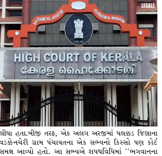
લીધા હતા. બીજી તરફ, એક અલગ અર્થમાં પલક્કડ જિલ્લાના વડકેનચેરી ગ્રામ પંચાયતના એક સભ્યનો કિસ્સો પણ કોર્ટ સમક્ષ આવ્યો હતો. આ સભ્યએ શપથવિધિમાં "ભગવાનના

નવી દિલ્હી તા. ૨૪ કેરળ હાઈકોર્ટ સ્થાનિક સ્વરાજ્યની સંસ્થાઓના ચૂંટાયેલા પ્રતિનિધિઓની શપથવિધિને લઈને એક અત્યંત મહત્વપૂર્ણ અને ઐતિહાસિક ચુકાદો આપ્યો છે. બુધવારે આપવામાં આવેલા આ ચુકાદામાં હાઈકોર્ટે સ્પષ્ટ કર્યું છે કે, કોઈપણ ચૂંટાયેલા પ્રતિનિધિએ કાયદા દ્વારા નિર્ધારિત બંધારણીય કોર્મટમાં જ શપથ લેવાના રહેશે. શપથવિધિ દરમિયાન "ભારત માતા", હિન્દુ દેવી-દેવતાઓ, રાજકીય શહીદો કે અન્ય કોઈ વ્યક્તિના નામે લેવાયેલા શપથ કાયદેસર ગણાશે નહીં. આ કડક વહાણ સાથે કોર્ટે તિરુવનંતપુરમ કોર્પોરેશનના ભાજપના તે કાઉન્સિલરોના શપથને અમાન્ય જાહેર કર્યા છે, જેમણે કાયદાકીય માળખાની બહાર જઈને અન્ય નામોનો ઉપયોગ કર્યો હતો. આ વિવાદ ત્યારે ઊભો થયો જ્યારે તિરુવનંતપુરમ મ્યુનિસિપલ કોર્પોરેશનના ૨૦ જેટલા કાઉન્સિલરોએ શપથવિધિ દરમિયાન કાયદામાં દર્શાવેલા શબ્દોને બદલે વિવિધ હિન્દુ દેવી-દેવતાઓ, "ભારતમા" (ભારત માતા), "ભારત મઠ", ગુરુદેવ અને પોતાની રાજકીય યજ્ઞવળના શહીદોના નામે શપથ