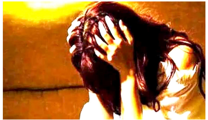
સીસીટીવી ફૂટેજ તપાસ્યા, જેમાં આ પાંચેય જણા સાથે જતા હોવાનું સ્પષ્ટ દેખાયું હતું. ત્યારબાદ આગળની ડાયરેક્શન ચેક કરતા ખબર પડી કે તેઓ ઉધના રેલવે સ્ટેશન તરફ ગયા છે. ઉધના રેલવે સ્ટેશનના સીસીટીવી ચેક કરતા માલુમ પડ્યું કે તેઓ ત્યાંથી ટ્રેનમાં બેસીને નાગપુર તરફ રવાના થયા છે. ગુજરાત પોલીસે તાત્કાલિક નાગપુર રેલવે પોલીસનો સંપર્ક સાધ્યો હતો. બાદમાં નાગપુર રેલવે સ્ટેશન પર ઉતરેલા આ પાંચેય જણાના સીસીટીવી ફૂટેજ ત્યાંની પોલીસે ચેક કર્યાં, તો ખબર પડી કે આરોપીઓ દીકરીઓને