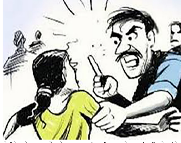
પોલીસે ગુનો દાખલ કર્યો હતો. આ બનાવમાં યુનિવર્સિટી પોલીસે ૧૫૦ રીંગ રોડ વિસ્તારમાં રહેતી બાવીસ વર્ષની યુવતિની ફરિયાદને આધારે ગાંધીગ્રામ મેઈન રોડ નાણાવટી ચોકમાં અમે અહિં રાતના સાડા અગીયાર સુધી બેઠા હતાં. એ પછી મને ઘરે મુકવા આવવા માટે જેનીસાથે મારી સગાઈની વાત ચાલે છે એ

રાજકોટ, તા. ૨૫ અગાઉની મિત્રતા હોય અને પછી તે છુટી થઈ જાય તો જે તે યુવક કે યુવતિ દ્વારા પોતાના પુર્વ મિત્ર સાથે માથાકુટ થતી હોવાના બનાવો વારંવાર બનતા રહે છે. વધુ એક આવો કિસ્સો સામે આવ્યો છે જેમાં એક યુવતિ હાલમાં પોતાની સગાઈ જે યુવાન સાથે થવાની છે તેની સાથે હતી ત્યારે પુર્વ મિત્રએ ઘસી આવી તું આની સાથે બોલીશ કે સગાઈ કરીશ તો બંનેને જાનથી મારી નાંખીશ તેવી ધમકી આપી છરીથી કારમાં નુકસાન કરી ભાગી જતાં પોલીસે કાર્યવાહી કરી હતી. ગાંધીગ્રામ વિસ્તારમાં બનેલા આ બનાવમાં પોલીસે એકાઈઍઆર દાખલ કરી કાર્યવાહી કરી હતી. વિગતો પર નજર કરીએ તો શહેરના ગાંધીગ્રામ દોઢસો ફૂટ રીંગ રોડ પર સ્ટેડિંગ હોસ્પિટલ પાછળ એક યુવતી પોતાની સગાઈ જેની સાથે થવાની છે તે યુવાન સાથે હતી ત્યારે તેણીના પુર્વ મિત્રએ તેણીને આંતરી તું કેમ આ ગાડીવાળા સાથે જાય છે? તેમ કહી ગાળો દઈ છરી કાઢી કારના કાર્યમાં ધા મારી નુકસાન કરી તેમજ જો તું આની સાથે બોલીશ કે સગાઈ કરીશ તો તને અને આ તારી સાથેના શપ્સ એમ બંનેને જાનથી મારી નાંખીશ તેવી ધમકી આપી ધમાલ મચાવતાં લોકોના ટોળા ભેગા થઈ ગયા હતાં. બનાવની જાણ થતાં