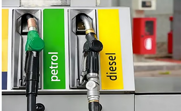
સચિવ સુજાતા શર્માએ કહ્યું, હાલમાં પેટ્રોલ-ડિઝલની કોઈ અછત નથી,

રાજકોટ, તા. ૨૫ પેટ્રોલ પંપ પર તેલની અછત અંગે સરકારે એક નવી માહિતી વિગતવાર જણાવી છે. પેટ્રોલિયમ મંત્રાલયના સચિવ સુજાતા શર્માએ જણાવ્યું છે કે, હાલમાં દેશમાં પેટ્રોલ-ડિઝલની કોઈ અછત નથી, પરંતુ રિટેલ આઉટલેટ એટલે કે પેટ્રોલ પંપ પર કેટલાક રાજ્યોમાં પેનિક બાઉન્ડિંગ, એટલે કે લોકો ગભરાઈને વધુ ખરીદી કરી રહ્યા છે. ખાસ કરીને ગુજરાતના કેટલાક જિલ્લાઓમાં આ સમસ્યા જોવા મળી છે. અમે રાજ્ય સરકારો અને સંબંધિત એજન્સીઓ સાથે સતત વાતચીત કરી રહ્યા છીએ જેથી અછત દૂર કરી શકાય. સુજાતા શર્માએ આ સમસ્યાનું કારણ પણ જણાવ્યું હતું. તેમણે કહ્યું કે, કેટલીક જગ્યાએ કૃષિ માટે ડિઝલની માગ વધુ છે, એટલે કે ખેતરો માટે લોકો ડિઝલ લઈ રહ્યા છે. કેટલાક લોકો બેઝમાં, એટલે કે મોટી માત્રામાં ખરીદી કરી રહ્યા છે. કેટલાક પ્રાઈવેટ સપ્લાયર્સની માગ પણ હવે પબ્લિક સેક્ટરની તેલ કંપનીઓ અને પેટ્રોલ