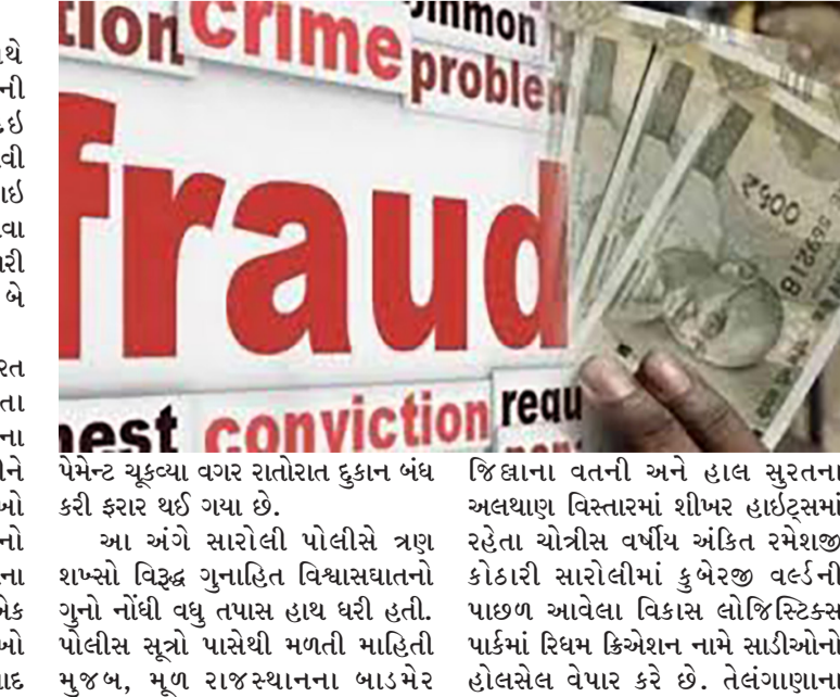
પેમેન્ટ ચુકવ્યા વગર રાતોરાત દુકાન બંધ કરી ફરાર થઈ ગયા છે.

રાજકોટ, તા. ૨૫ અવાર-નવાર વેપારીઓ સાથે વિશ્વાસ કેળવી શરૂઆતમાં માલની ખરીદીનું પેમેન્ટ રોકડેથી કરી દઈ બાદમાં બાકીમાં લાખોનો માલ મેળવી ઘૂંબો મારી દેવાની ઘટનાઓ વધી ગઈ છે. વધુ એક કાપડના વેપારી સાથે સવા અગીયાર લાખની કગાઈ થઈ છે. વેપારી અને દલાલ સાથે બહારના રાજ્યના બે શખ્સોએ આ છેતરપીંડી કરી હતી. વિગતો પર નજર કરીએ તો સુરત શહેરના ટેક્સટાઈલ્સ હબ ગણાતા સારોલી વિસ્તારમાં બહારના રાજ્યના વેપારીઓ અને દલાલે ભેગા મળીને સ્થાનિક કાપડના વેપારી સાથે લાખો રૂપિયાની છેતરપિંડી આચરી હોવાનો કિસ્સો પ્રકાશમાં આવ્યો છે. તેલંગાણાના બે કાપડ વેપારી અને રાજસ્થાનના એક દલાલે સુરતના વેપારી પાસેથી લાખો રૂપિયાની સાડીઓનો માલ ખરીદ્યા બાદ