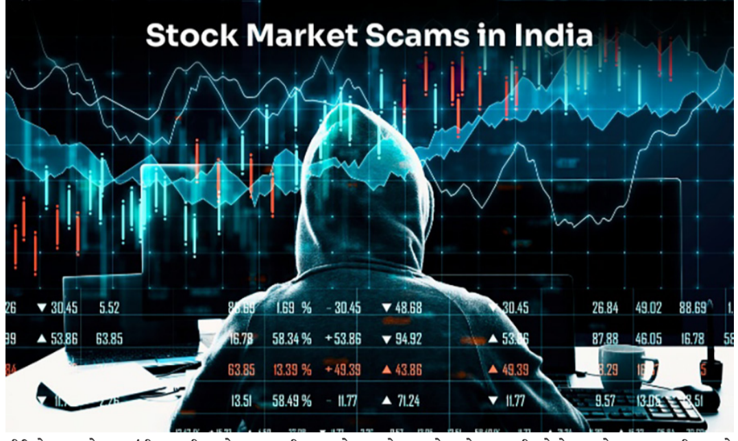
વીડિયો વાળા ફેક આઈડી બતાવી દાવો કર્યો કે આ સેલિબ્રિટીને પણ તેમણે મોટો નફો કરાવ્યો છે. આ જાળમાં ફસાવીને વૃદ્ધ પાસેથી રૂ.૩૧.૩૪ લાખ પડાવી લીધા હતા. આમ શેર બજારમાં કમાણીના નામે યુવાને અડધો કરોડ અને વૃદ્ધે એકત્રીસ લાખથી વધુની રકમ ગુમાવી દીધી હતી. ગઠીયાઓ આરોપીઓ ઉપયોગ કરી લોકોને છેતરે છે છતાં લોકો જાગૃત થતાં નથી. તેનો આ બે ઘટના પરથી પુરાવો મળી રહ્યો છે.