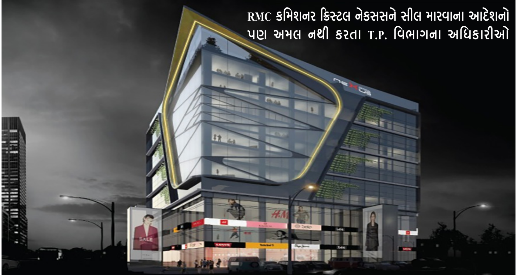
RMC કમિશનર ક્રિસ્ટલ નેક્સસને સીલ મારવાના આદેશો પછા અમલ નથી કરતા T.P. વિભાગના અધિકારીઓ

બિયાંની મીંદડી બનીને ચુપ થઈને જોયા કરે છે. તેથી સામે નિયમોનું પાલન કરાવવામાં નિષ્ફળ રહ્યા છે. આ ક્રિસ્ટલ નેક્સસ બિલ્ડિંગને RMC કમિશનર દ્વારા ૧૪/૦૫/૨૦૨૫ ના રોજ સીલ મારવા માટેની કાર્યવાહી કરવા આદેશ આપ્યો હોવા છતાં, T.P. વિભાગના અધિકારીઓ કોઈને કોઈ બહાના કાઢીને આજ દિવસ સુધી તે ગેરકાયદેસર બાંધકામની સામે કોઈ કાર્યવાહી કરતા નથી. જો કોઈ નાના કે ગરીબનું બિલ્ડિંગ કે મકાન હોત તો T.P. વિભાગના અધિકારીઓ પોતાને સુપર પાવર ગણીને તેવા મકાનો તોડવા પહોંચી ગયા હોત, પરંતુ આ બિલ્ડિંગ એક મોટા માથાનું હોવાથી T.P. વિભાગ તથા કમિશનરશ્રી પોતાને લાયક અને બિચારા ગણીને મોન ધારણ કરીને બેસી ગયા હોવાનો કોંગ્રેસ આગેવાનોએ આક્ષેપ કર્યો છે.