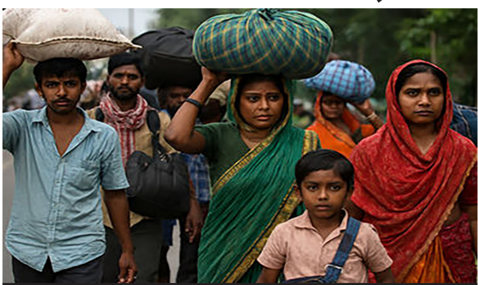
બાંગ્લાદેશની ઘૂસણખોરી રોકવા ભાજપની નટયાલ

નવીદિલ્હી, તા. ૨૭ સરકાર દ્વારા અમલી બનાવાયેલી પડોટક્ટ, ડિલીટ એન્ડ પશ્ચિમ બંગાળમાં ઘૂસણખોરીને રોકવા માટે ભાજપ ડિપોર્ટિંગ (ઓળખો, હટાવો અને દેશનિકાલ કરો) નીતિ બાદ