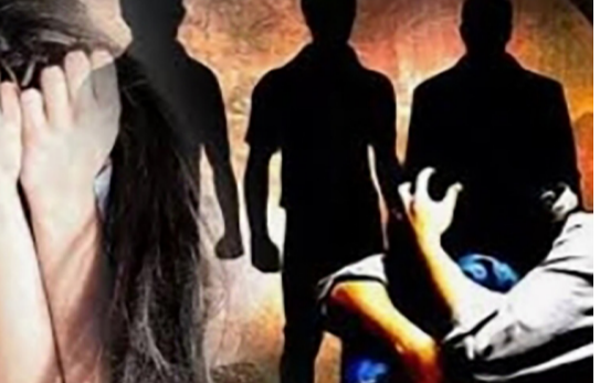
યુવતિના પુરૂષ મિત્રના ફોટા વાચરલ કરી દેવાની બદનામ કરવાની ધમકી આપી બે હવસખોરોએ હોટેલમાં લઈ જઈ ચાર વખત દેહ પીંચ્યો: પોલીસે બંનેને દબોચી હવસખોરી ઉતારી નાંખી