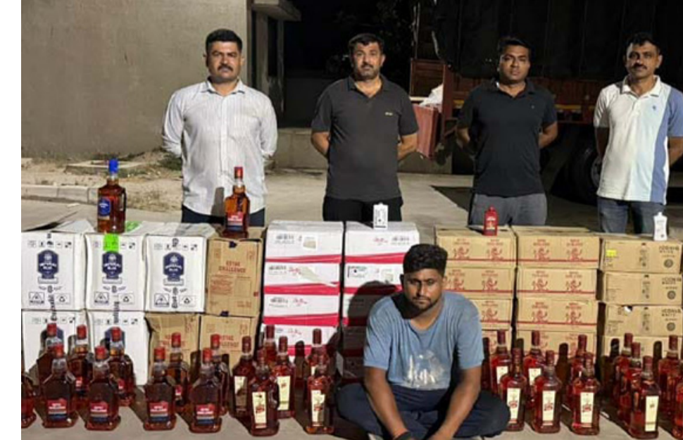
અને ઇમ્પીરીયલ બ્લુ વ્હીસ્કીની ૩૦ બોટલ કિંમત રૂ. ૧૫,૦૦૦ મળી આવી હતી. આ ઉપરાંત ૧૮૦ એમએલના નાના ચપલા રોયલ ચેલેન્જ વ્હીસ્કીની ૪૮૦ નંગ કિંમત રૂ. ૭૯,૨૦૦, આઈકોનીક વ્હાઈટ