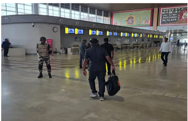
રાજકોટ, તા. ૨૭ કોઈપણ આપત્કાલીન પરિસ્થિતિને પહોંચી વળવા તંત્ર સજ્જ છે કે કેમ તે અંગે તંત્ર દ્વારા

SOG તથા બોમ્બ સ્કવોડની ટીમ તાકીદે પહોંચી એરપોર્ટ : પાર્કિંગ એરિયામાંથી બોમ્બ શોધી કર્યો ડિફ્યુસ