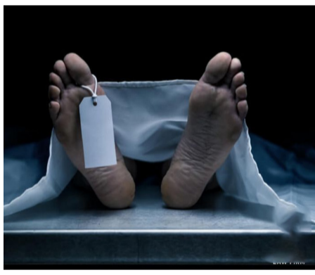
રાજકોટ, તા. ૨૭ એક આધેડ ત્રણ દિવસ પહેલા ધરે કોઈને કંઈ કહ્યા વગર ધરેથી નીકળ્યા બાદ પરત જ ન આવતાં શોધખોળ શરૂ કરવામાં આવી હતી. આ વચ્ચે તેમની કોલવાયેલી લાશ તળાવમાંથી મળી આવતાં ચક્રવાર મર્યા ગઈ હતી. ગોંડલની આ ઘટનામાં

ધરે કંઈ કહ્યા વગર નીકળી ગયા હતાં: ફોરેન્સિક પોસ્ટમોર્ટમ કરાવ્યું