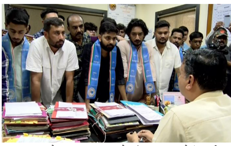
રાજકોટ, તા. ૨૭ સૌરાષ્ટ્ર યુનિવર્સિટીમાં હાલ અનેકવિધ પ્રશ્નો છેલા ઘણા સમયથી ઊભા થયા છે એટલું જ નહીં વિદ્યાર્થીઓને સમયસર રીઝલ્ટ ના મળવા ના પગલે આગળ એડમિશન

સમયસર રિઝલ્ટ ન આપતાં કાર્યકરોએ ગજવી યુનિવર્સિટી, ધરણાની ચીમકી