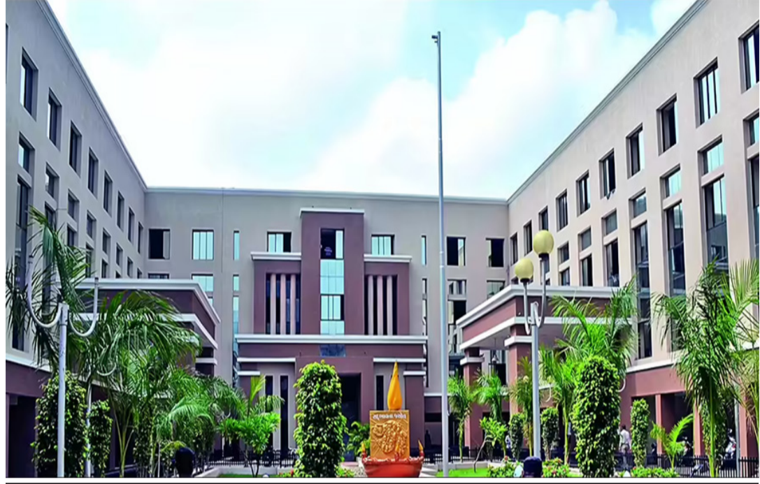
આજે સવારે ૧૦ વાગ્યે ખુલશે પરબીડિયું સરપેન્સ પરથી હટશે પડશે

સુરત, વડોદરા, ભાવનગર, સુરેન્દ્રનગર, વાપી અને આણંદ મનપાના હોદ્દેદારોની પણ થશે નિયુક્તિ