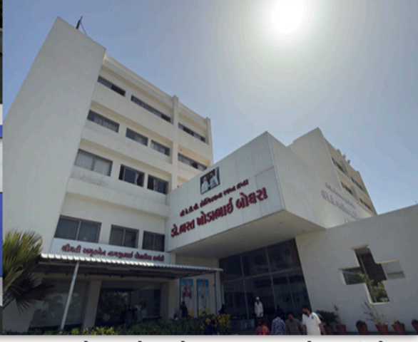
રાજકોટ, તા. ૨૭ સૌરાષ્ટ્રના અંતરિયાળ અને ગ્રામીણ વિસ્તાર ગણાતા જસદણ, વિંછીયા, બાબરા