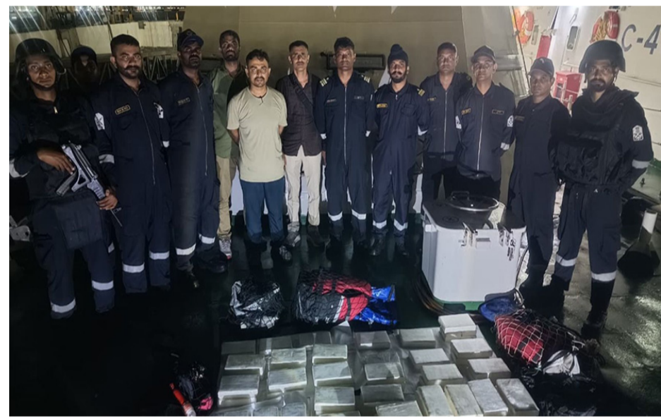
જહાજમાં બે શંકાસ્પદ લોકો સવાર હતા, જેમાંથી એકની ધરપકડ

હતા અને મુન્દ્રા એન્ક્રેજ વિસ્તારમાં વ્યાપક શોધખોળ હાથ ધરવામાં આવી હતી. શોધખોળ દરમિયાન, ટીમે મુન્દ્રા કિનારાથી લગભગ પાંચ નોટિકલ માઈલ દૂર લંગર કરાયેલ કન્ટેનર જહાજ ખટ યુરોપ શોધી કાઢ્યું. શોધખોળ દરમિયાન, અધિકારીઓએ જહાજમાંથી શંકાસ્પદ બેગ સમુદ્રમાં ફેંકવામાં આવતી જોઈ. આ પછી, ICG અને ATS ની સંયુક્ત ટીમ તાત્કાલિક કાર્યવાહીમાં લાગી ગઈ અને અંધારા અને અત્યંત ઓછી દૃશ્યતા જેવી પડકારજનક પરિસ્થિતિઓ હોવા છતાં, સમુદ્રમાં શોધખોળ શરૂ કરી. ઝડપથી કાર્યવાહી કરતા, ટીમે સમુદ્રમાંથી પાંચ બેગ જપ્ત કરી. તપાસ કર્યા પછી, તેમને સફેદ પાવર મળ્યો. પ્રારંભિક પરીક્ષણોમાં આ પદાર્થ કોકેઈન હોવાનું બહાર આવ્યું. અધિકારીઓના જણાવ્યા અનુસાર, કુલ ૧૧૫ પેકેટ મળી આવ્યા