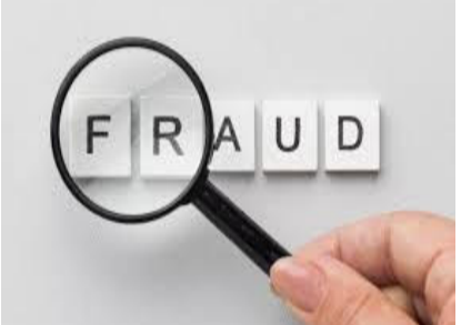
બીજી ઘટનામાં મૃત્યુ પામનાર જેવુ જ નામ ધરાવનારે ખોટી વારસાઈ એન્ટ્રી કરી એક કરોડથી વધુની છેતરપીંડી આચરી