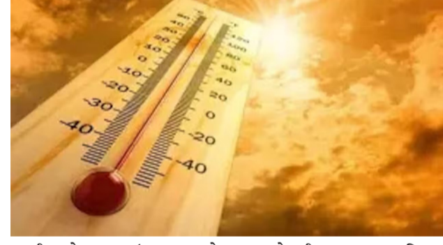
ગરમી અને અસહ્ય ઉકળાટ વચ્ચે હવામાન વિભાગ દ્વારા આગામી ૩૦ મે થી ૨ જૂન દરમિયાન રાજ્યના વિવિધ ભાગોમાં વરસાદની આગાહી કરવામાં આવી છે.

રાજકોટ, તા. ૨૮ રાજ્યમાં ગરમી-ઉકળાટ બાદ વરસાદની આગાહી કરવામાં આવી છે. તારીખ ૩૦ મેથી ૨ જૂન સુધી વરસાદની આગાહી કરવામાં આવી છે. ગાજવીજ અને પવન સાથે વરસાદ પડી શકે છે તેમજ ૪૦થી ૫૦ કિમીની ઝડપે પવન ફુંકાશે. બે દિવસ બાદ તાપમાનમાં ઊંચી પ ડિગ્રીનો ઘટાડો થશે. ઉત્તર ગુજરાત, મધ્ય ગુજરાત, દક્ષિણ ગુજરાતમાં વરસાદની આગાહી કરવામાં આવી છે. ગુજરાતવાસીઓ માટે રાહતના સમાચાર સામે આવ્યા છે. કાળઝાળ ગરમી અને અસહ્ય ઉકળાટ વચ્ચે હવામાન વિભાગ દ્વારા આગામી ૩૦ મે થી ૨ જૂન દરમિયાન રાજ્યના વિવિધ ભાગોમાં વરસાદની આગાહી કરવામાં આવી છે. વેસ્ટર્ન ડિસ્ટર્બન્સની અસર અને અરબ સાગરમાં સર્જાયેલી સાનુકૂળ સ્થિતિને કારણે ગાજવીજ અને ૪૦ થી ૫૦ કિમીની ઝડપે ફુંકાતા પવન સાથે વરસાદ પડવાની શક્યતા છે. આ ફેરફારને પગલે આગામી બે દિવસ બાદ તાપમાનમાં ૩ થી ૫ ડિગ્રીનો ઘટાડો નોંધાશે, જે પાગરિકોને ગરમીથી મોટી રાહત અપાવશે. ૩૦ મેના રોજ કચ્છ, બનાસકાંઠા, પાટણ, સાબરકાંઠા, અરવલ્લી, મહીસાગર, પંચમહાલ, દાહોદ, છોટાઉદેપુર, નર્મદા અને તપીમાં મેઘવરદ થઈ શકે છે. ૩૧ મેના કચ્છ અને ઉત્તર ગુજરાતના જિલ્લાઓ ઉપરાંત મહેસાણા અને ડાંગમાં પણ વરસાદી માહોલ જોવા મળશે. ૧ જૂનના રોજ વરસાદનો વ્યાપ વધશે. અમદાવાદ, ગાંધીનગર, ખેડા, આણંદ, વડોદરા, સુરત, ભરૂચ, નવસારી, વલસાડ અને સૌરાષ્ટ્રના માટે ભાગના વિસ્તારોમાં વરસાદની આગાહી છે. ૨ જૂનના દિવસે સૌરાષ્ટ્ર, ઉત્તર ગુજરાત અને દક્ષિણ ગુજરાતના મોટાભાગના વિસ્તારોમાં વરસાદી ઝાપટા ચાલુ રહેશે.