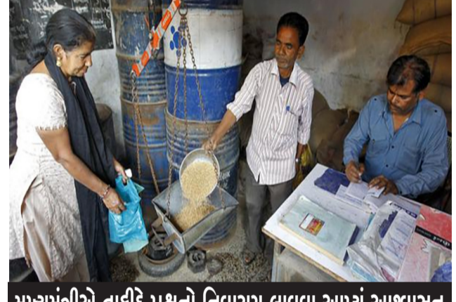
મુખ્યમંત્રીએ તાકીદે પ્રશ્નો નિવારણ લાવવા આપ્યું આશ્વાસન

યલન જનરેટ કરીને પેમેન્ટ નિગમને કરવા માટે વિનંતી છે. ઉલ્લેખનીય છે કે વેપારી આગેવાન પ્રહલાદભાઈ મોદી દ્વારા ફરીથી પરીણામ વગર હડતાલ હેકી મુકવામાં આવી છે ત્યારે ગુજરાતના વાજબી ભાવની દુકાનના વેપારી ભાઈઓ પરીથી છેતરાયા હોવાનો ગુણગણાટ છે.