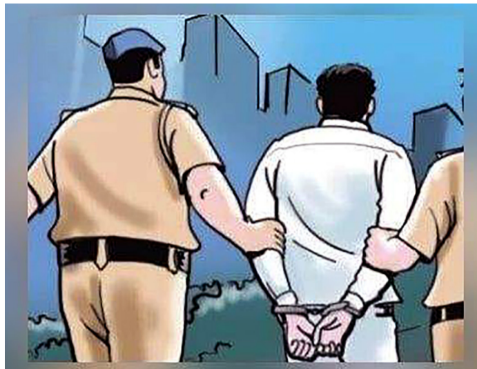
નારોલ પોલીસ સ્ટેશનમાં ફરિયાદ પાંચસો રૂપિયા રોકડા પડાવી લીધા હતા. આ પછી બંને શખ્સ રિક્ષા લઈને જતા રહ્યા હતા. ભોગ બનનાર વ્યક્તિએ