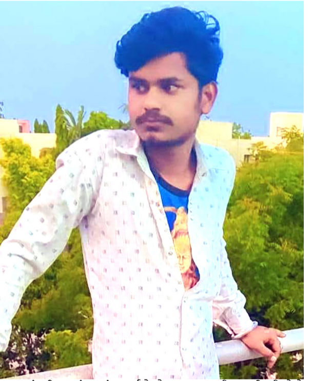
મૃત્યુ થતાં પરિવારમાં કલ્પાંત સર્જાયો છે. આ બનાવથી ત્રણ દિકરીઓએ પિતાની છત્રછાંયા ગુમાવી દીધી છે.