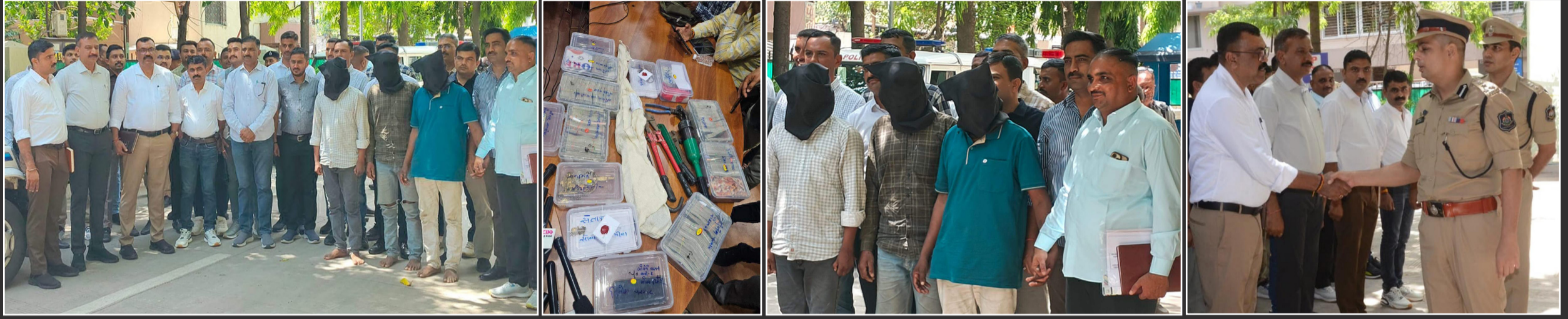
રેકી બાદ અગાઉથી ત્રણ બાઈક ચોરીને રાખી દીધા હતાં: બોલેરો લઈ લૂંટ કરવા આવ્યાથતા: બાઈક રેકા મુકી બોલેરોમાં ભાગ્યા હતાં: દાહોદ તરફ જઈ ટકાવારી મુજબ માલનો ભાગ પાડ્યો હતો: લૂંટમાં સામેલ હોય તેને વધુ, રેકી કરનાર, બોલેરો લઈ આવનારને ઓછા રૂપિયા અપાયા હતાં

શાપર વેરાવળની લૂંટમાં એમપીની શાતીર ગેંગના ત્રણ પકડાયા: પોલા કરોડનો મુદ્દામાલ કબ્જે થયો: હજુ ત્રણ લૂંટારાને શોધવાની કવાચત ચલાવત