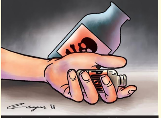
પાંચ વર્ષના ટાબરીયાનો તાવ-આંચકીને કારણે જીવ ગયો: શિક્ષા પલ્ટી મારી જતાં ચાલક પ્રોફેસર જિંદગીનો અંત આપી ગયો

રાજકોટ,તા.૨૬ બે અલગ અલગ ઘટનામાં તાજા પરણેલા યુવાન અને યુવતિના અપમૃત્યુ થયા હતાં. એક મહિના પહેલા જ પરણેલા યુવાને ગુહકલેશને કારણે એસિડ પી દુનિયા છોડી દીધી હતી. બીજા ઘટનામાં એક પરિણીતાએ ઝેરી દવા પી જીવ આપી દીધો હતો. તેણીના લગ્ન આઠ મહિના પહેલા જ થયા હતાં. આ બંને ઘટનામાં ચોક્કસ કારણો બહાર આવ્યા ન હોઈ પોલીસે તપાસ ચલાવત રાખી હતી. ત્રીજા ઘટનામાં એક બાળકનો તાવ-આંચકીને કારણે ભોગ લેવાઈ ગયો હતો. જ્યારે એક શિક્ષાચાલક પ્રોફેસર તેમની જ શિક્ષા ગોઠવવા માટે જવાને કારણે મૃત્યુ થયું હતું. વાહન અકસ્માતની ઘાત મોબીને નડી જતાં પરિવારમાં ગમગીની વ્યાપી ગઈ હતી.