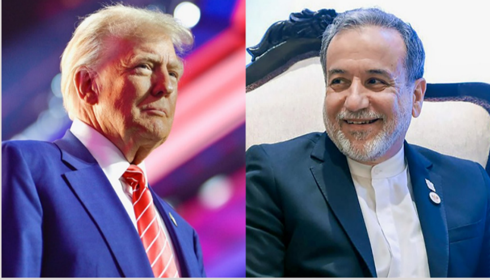
આ દાવા સાથે ઈરાને અમેરિકાને સીધો પડકાર હેંક્યો છે કે આ ક્ષેત્રમાં અમેરિકાની કોઈપણ પ્રકારની લશ્કરી આવશે નહીં. યુદ્ધના આ ભડકાની શરૂઆત ત્યારે થઈ

નવી દિલ્હી, તા. ૨૯ ખાડી દેશોમાં સળગી રહેલી યુદ્ધની ચિનગારી હવે ગમે ત્યારે ભયંકર જ્વાળામુખી બનીને ફાટી શકે છે! અમેરિકા અને ઈરાન વચ્ચેનો તણાવ હવે એવા વિસ્ફોટક સ્તરે પહોંચી ગયો છે કે આખી દુનિયાના માથે મહાવિનાશની તલવાર લટકી રહી છે. ઈરાને અત્યંત આક્રમક અને બેકામ વલણ અપનાવીને અમેરિકાના રાષ્ટ્રપતિ ડોનાલ્ડ ટ્રમ્પને સીધી અને ખુદી ચેતવણી આપી દીધી છે કે દુનિયાના સૌથી વ્યસ્ત અને અતિમહત્વના એવા હોર્મુઝ જળમાર્ગ પર આગામી એક મહિના સુધી સંપૂર્ણપણે ઈરાની સેનાનો જ કંટ્રોલ રહેશે. ઈરાનના આ દુઃસાહસ અને ખુદી દાદાગીરીએ આંતરરાષ્ટ્રીય સ્તરે ભારે ખળભળાટ મચાવી દીધો છે. એક તરફ દુનિયા પહેલાથી જ યુદ્ધના ઓછાયા હેઠળ જીવી રહી છે, ત્યારે ઈરાનના વિદેશ મંત્રી અબ્બાસ અરાધચીએ બગદાદમાં યોજાયેલી એક પ્રેસ કોન્ફરન્સમાં બોમ્બ ફોડતા દાવો કર્યો છે કે અમેરિકા સાથે સાર્થક કરાયેલા મેમોરેન્ડમ ઓફ અન્ડરસ્ટેન્ડિંગ (બધગ) અંતર્ગત જ ઈરાને હોર્મુઝ જળમાર્ગ પર ચાંપની નજર રાખવાનો અને તોલિંગ ફી વસૂલવાનો કાયદેસરનો અધિકાર મળ્યો છે.