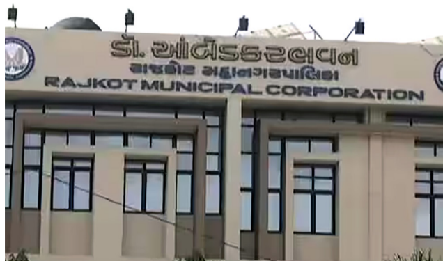
મહાનગરપાલિકા દ્વારા ચર્ચા વિચારણા શરૂ : પ્રોજેક્ટ અમલી બનશે તો ટ્રાફિક સમસ્યા થશે દૂર

મહાનગરપાલિકા દ્વારા છેલ્લા થપ્પા સમયથી માળખાગત સુવિધાઓના વિકાસ માટે ઘણી ખરી મહેનત કરવામાં આવી રહી છે. સાથો સાથ હાલ રાજકોટનો જો કોઈ વિકટ પ્રશ્નો હોય તો તે ટ્રાફિકનો છે ત્યારે તેનો ચોચ નિવારણ લાવવા વિવિધ અંડર બ્રિજ તથા ઓવરબ્રિજ બનાવવાનો કાર્ય તંત્ર દ્વારા હાથ ધરવામાં આવી રહ્યું છે અને તે દિશામાં હાલ વિચારો પણ રજુ થઈ રહ્યા છે. થોડા સમય પૂર્વે જ માલવયા કોલેજ સામે ઝડ આકારમાં બ્રિજ બનાવવા માટેની મંજૂરી મળી ગઈ હોવાનું માલુમ પડ્યું છે અને તે કાર્ય માટેની તૈયારીઓ પણ હાલ શરૂ કરી દેવાય છે.