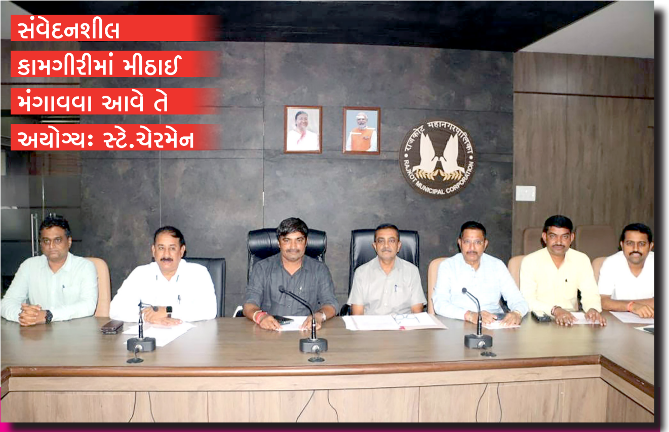
સંવેદનશીલ કામગીરીમાં મીઠાઈ મંગાવવા આવે તે અયોગ્ય: સ્ટે.ચેરમેન

ગાંડીવેલ દૂર કરવા મશીન નહીં મેનપાવર નો ઉપયોગ કરાય તે મુદ્દે થશે ચર્ચા વિચારણા: સ્ટેનિંગ ચેરમેનનો ખુલાસો કોઈપણ ખર્ચ માટે વહીવટી પ્રક્રિયા યોજાય તે ખૂબ જરૂરી