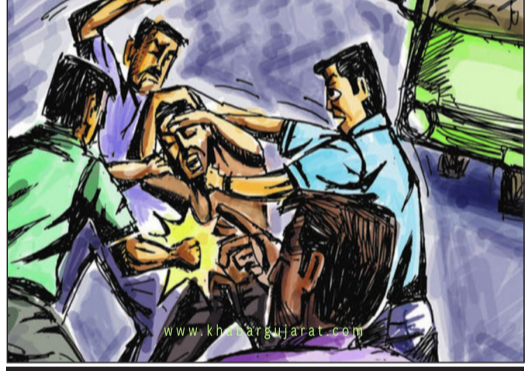
આજીએ પોલીસે બંને પક્ષના સાત-સાત જણા સામે બે એકઠાઈઆર દાખલ કરી: ઘોઠા-પાર્થથી ઘમાલ મચાવી ધમકીઓ પણ અપાયાનો આરોપ