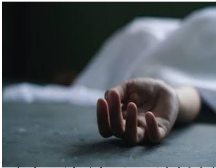
બીજી એક ઘટનામાં એક પરિવારે આધારસ્તંભ મોભી ગુમાવી દીધા હતાં. મોરબીના શકતસનાળા ગામે રહેતાં વૃદ્ધ ઘરના બીજા માળની અગાસી પરથી પટકાતાં ગંભીર ઈજા