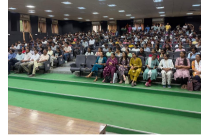
રાજકોટ, તા. ૨

યુવાનો અને મહિલાઓ માટે બે વિશેષ જાગૃતિ સેમિનાર સંપન્ન