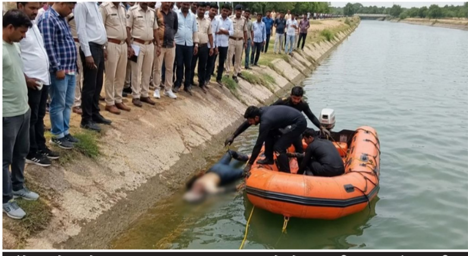
બંને યુવકોના મોત પાછળ અકસ્માત, આત્મહત્યા કે કોઈ ગુનાહિત કાવતરું? સ્થાનિક તરવેચાઓની મદદથી મૃતદેહો બહાર કઢાયા, ઓળખ મેળવવા પોલીસની ક્ષયાયત

અમદાવાદ, તા.૫ અમદાવાદ શહેરની હદની બહારથી પસાર થતી જીવાદોરી સમાન નર્મદા કેનાલમાંથી એક જ દિવસમાં બે અલગ-અલગ સ્થળેથી બે અજાણ્યા યુવકોના મૃતદેહ મળી આવવાની અત્યંત ચોંકાવનારી ઘટના