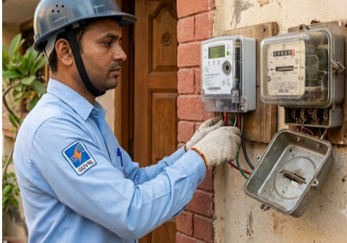
વડોદરાના કેસમાં ગ્રાહકની અપીલ ફગાવાઈ: જો ગ્રાહકને સ્માર્ટ મીટરમાં શંકા હોય તો માત્ર થર્ડ-પાર્ટી લેબોરેટરીમાં ટેસ્ટિંગ કરાવી શકાય

ગુજરાત વિદ્યુત નિયામક આયોગ (GERC) ના વીજ લોકપાલ (Electricity Ombudsman) દ્વારા રાજ્યભરના વીજ ગ્રાહકો અને વિતરણ કંપનીઓ માટે એક અત્યંત મહત્વપૂર્ણ અને ઐતિહાસિક ચુકાદો આપવામાં આવ્યો છે. છેલ્લા કેટલાક સમયથી રાજ્યમાં સ્માર્ટ મીટર લગાવવાને લઈને જે વિવાદો અને વિરોધ ચાલી રહ્યા છે, તેની વચ્ચે વીજ લોકપાલે સ્પષ્ટ શબ્દોમાં આદેશ કર્યો છે કે વીજ વિતરણ કંપનીઓ પ્રવર્તમાન કાયદા અને સરકારી નિયમો અનુસાર કોઈપણ ગ્રાહકના જૂના અને પરંપરાગત મીટરની જગ્યાએ નવું સ્માર્ટ મીટર લગાવી શકે છે. આ સમગ્ર પ્રક્રિયા માટે ગ્રાહકની પૂર્વ સંમતિ મેળવવી જરૂર પણ જરૂરી નથી. આ ઉપરાંત, માત્ર સ્માર્ટ મીટરનો પાયાવિહોણો વિરોધ કરીને કોઈપણ ગ્રાહક પોતાનું જૂનું પરંપરાગત મીટર ફરીથી લગાવવાની માંગ કરી શકે નહીં, અને આવી માંગ કાયદાકીય રીતે માન્ય રાખી શકાય નહીં.