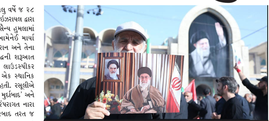
તેહરાનની સડકો પર લાખોની મેદની વચ્ચે 'અમેરિકા મુર્દાબાદ'ના નારા ગુંજ્યા, ટ્રમ્પને નિશાન બનાવવાની અપીલને વ્યાપક જનસમર્થન મળ્યું

નવી દિલ્હી, તા.૫ ઈરાનના દિવંગત સુપ્રીમ લીડર આયતુદ્દા અલી ખામેનેઈના જન્મજય અને દફનવિધિ દરમિયાન રવિવારે, ૫ જુલાઈ ૨૦૨૬ ના રોજ, પાટનગર તેહરાનની સડકો પર માહોલ અત્યંત ગરમાયો હતો. આ વિશાળ શોક સભામાં મંચનું સંચાલન કરી રહેલા એક આયોજકે સરેઆમ અમેરિકી રાષ્ટ્રપ્રમુખ ડોનાલ્ડ ટ્રમ્પને નિશાન બનાવીને તેમની સામે હિંસક પગલાં લેવાની અને તેમને જાનથી મારી નાખવાની ખુદી અપીલ કરી હતી. અહેવાલો અનુસાર, ખામેનેઈના અવસાન બાદ આ પ્રથમ એવો સત્તાવાર પ્રસંગ હતો જ્યાં કોઈ મોટા મંચ પરથી સીધા જ અમેરિકી પ્રમુખ વિરુદ્ધ આટલા ઉગ્ર અને હિંસક પગલાંનું આહ્વાન કરવામાં આવ્યું હોય. આ ભડકાઉ નારો ગૂંજતાની સાથે જ જનાજમાં ઉપસ્થિત લાખોની ભીડ મોટા અવાજે બૂમો પાડીને તેનું સમર્થન કર્યું હતું, જે બંને દેશો વચ્ચેની યરમસીમાએ પહોંચેલી દુશ્મનાવટ અને તંગદિલીનો સ્પષ્ટ ચિતાર આપે છે. આ સમગ્ર ઘટના તેહરાનમાં ખામેનેઈની વિશાળ શોક સભા દરમિયાન પ્રકાશમાં આવી