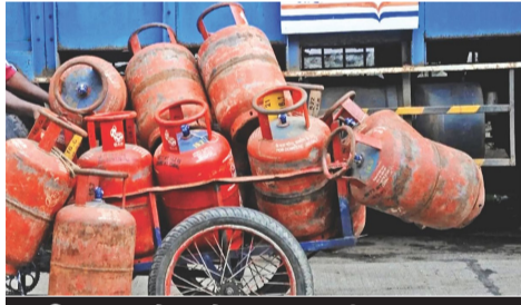
જિંદા કલેક્ટરે હાથ ધરી તપાસ : પુરવઠા અધિકારીએ હિયરિંગ કર્યું

રાજકોટ, તા. ૬ વહીવટી વિભાગ અને જિલ્લા કલેક્ટર દ્વારા સતત એ વાત ઉપર તપાસ હાથ ધરવામાં આવી રહી છે કે કોઈપણ સંજોગે પુરવઠાનો અયોગ્ય ઉપયોગ કરવામાં ન આવે. ત્યારે સતત ચાલતી તપાસ દરમિયાન અનઅધિકૃત રીતે કોમર્શિયલ રાંધણ ગેસનો ઉપયોગ કરતા ૨૫ વેપારીઓ સામે કાયદાકીય પગલા લેવામાં આવ્યા છે અને ખાસ કાર્યવાહી પણ શરૂ કરી છે. આ તમામ ૨૫ વ્યાપારીઓને કલેક્ટર કચેરી ખાતે બોલાવી જિલ્લા પુરવઠા અધિકારીએ હિયરિંગ કર્યું હતું. રાંધણ ગેસનો અનઅધિકૃત રીતે કોમર્શિયલ ઉપયોગ કરનારા