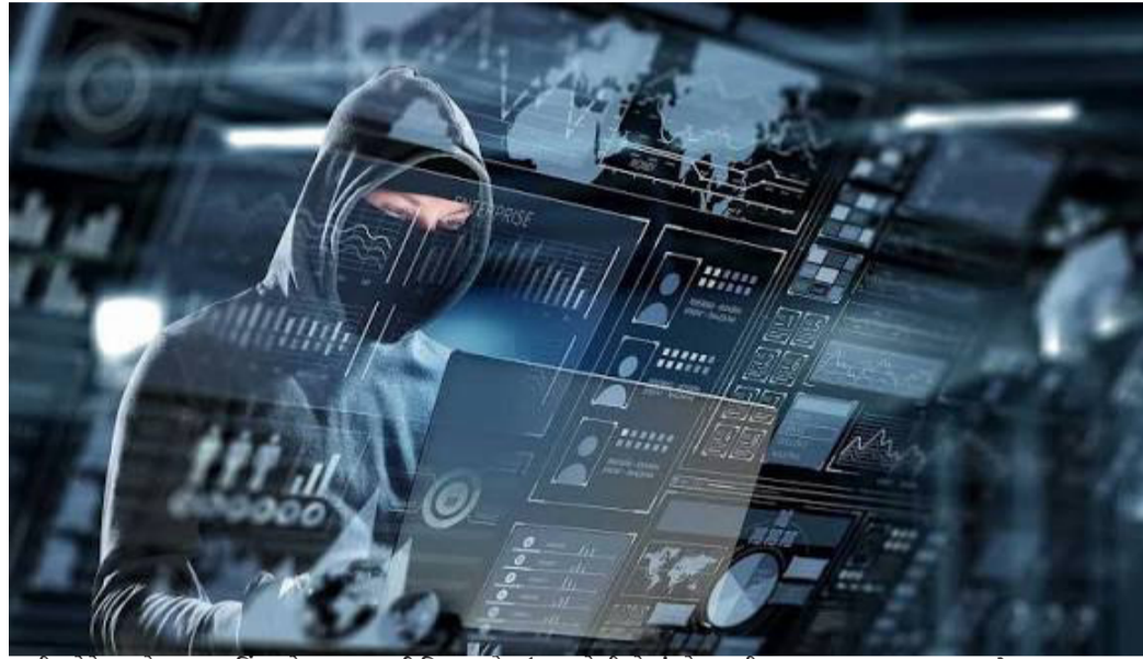
પુશી ગોંધલ, ડો રાજવ સિંઘ જવા ગુપ એડમિન દ્વારા બીજા ગ્રુપમાં એડમિન કરવામાં આવ્યા હતા. ટગો દ્વારા જે રીતે ઈન્વેસ્ટમેન્ટ ડિજિટલ એકાઉન્ટ ખોલાવી થોડી રકમ પરત કરીને મોટી રકમનું રોકાણ કરાવવામાં આવે છે તે રીતે કલાલીના સિનિયર સિટીઝનનું પણ ડિજિટલ એકાઉન્ટ ખોલી તેમાં રોકાણની સામે મોટો નફો બતાવવામાં આવ્યો હતો. રોકાણ કરી રહેલા આ વૃદ્ધને વિશ્વાસમાં લેવા માટે ટગોએ સેબીના બોગસ કાગળો મોકલ્યા હતા અને કરતાં કોર્ટ મારફતે રૂપિયા ૫.૨૪ લાખ પરત મળ્યા હતા. પોલીસે આ અંગે ગુનો

સાયબર સેલમાં ફરિયાદ નોંધાવતા કોર્ટ મારફતે સવા પાંચ લાખ પરત મળ્યા હતાં. બાકીની રકમ ગુમાવી દીધી હતી. વિશેષ માહિતી જોઈએ તો ઓનલાઈન ટગોની ઈન્વેસ્ટમેન્ટની જાળમાં ફસાયેલા વડોદરાના વધુ એક સિનિયર સિટીઝને જિંદગીની બધી એકાવન લાખ ગૂમાવનારા વૃદ્ધ સાથે ફ્રોડ આચરનાર સાયબર ગઠીયાઓને શોધવા સાયબર કાઈમ પોલીસની ટીમો કામે લાગી હતી. વડોદરા શહેરના કલાલી વિસ્તારમાં રહેતા પાંચ વર્ષીય સિનિયર સિટીઝન ખાનગી કંપનીમાંથી નિવૃત્ત થયા હોવાનું જાણવા મળ્યું છે. બીમારીનું કારણ દર્શાવી નામ જાહેર નહિ કરવાની શરતે પોલીસ ફરિયાદ કરનાર સિનિયર સિટીઝન ટગોની જાળમાં ફસાયા હતા. આ કિસ્સામાં સિનિયર સિટીઝનને ટગોએ આઈપીઓ તેમજ પસંદગીના શેરમાં ટ્રેડિંગ કરીને જંગી નફો કમાવી આપવાની લાલચ આપી ટગોએ વોલસ્ટ્રીટ ધર્મા-ડી-ઈ ગ્રુપમાં સામેલ કર્યા હતા. જેમાં ટગો દ્વારા સારો નફો મેળવનારા ગુપ મેમ્બરોના સ્ક્રીન શોટ મૂકવામાં આતા હતા. ત્યારબાદ તેઓને