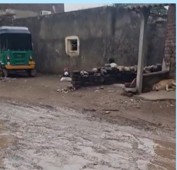
પ્રેમોનસુન કામગીરીનો ઉડ્યો છેદ : વ્યવસ્થા કરવામાં તંત્ર નિષ્ફળ

મનપાના ભ્રષ્ટાચાર અને અણઘડ આયોજનના કારણે હાલમાં શહેરના અનેક વિસ્તારોમાં ડ્રેનેજ, ગેસ લાઈન અને કેબલિંગ માટે ખોદકામ કરવામાં આવ્યું હતું. વરસાદ વહેલો આવશે તેવી ચેતવણી હોવા છતાં આ ખોદકામ કરેલા રસ્તાઓનું યોગ્ય મેલેલિંગ કે પુરાણ કરવામાં આવ્યું ન હતું. પરિણામે, સામાન્ય વરસાદથી પાણી ભરાતા જ આ માટી પીગળીને ચીકણો કાઢવ બની