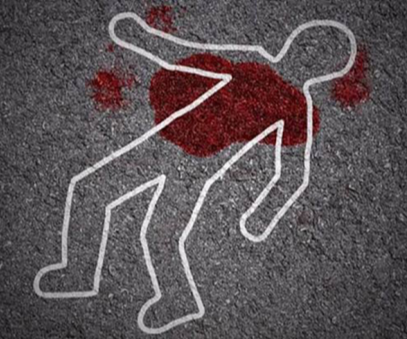
ત્રણ શખ્સો પહેલા બોલાયાલી કરી જતાં રહ્યા પછી તલવાર-છરી સાથે આવ્યા: અન્ય ઘટનામાં હુમલામાં ઘાયલ અધિકનો પણ જીવ ગયો

રાજ્યમાં રોજબરોજ કોઈને કોઈ ગામ કે શહેરમાં હત્યાની કોશિષ કે હત્યાની ઘટનાઓ બનતી રહે છે. લોકો નહિ જેવી વાતે એવા કોઠીત થઈ જાય છે કે કોઈને કોઈ પરિવારના આધારસ્તંભને મોતને ઘાટ ઉતારી દે છે. આવી જ એક ઘટનામાં પાર્કિંગ જેવી વાતે એક યુવાનની કુર હત્યા કરી નોંખવામાં આવી હતી. મિત્રો સાથે બહાર જમવા માટે ગયેલા યુવાન સાથે વાહન પાર્ક કરવા મામલે ત્રણ શખ્સોએ બોલાવ્યાલી કર્યા બહાર છરી-તલવારના ઘા ઝીંક્યા હતાં. જે યુવાન માટે જીવલેણ સાબીત થયા હતાં. અરેરાટીભરી વાત એ હતી કે એક છરી તો આ યુવાનના પેટમાં જ ફસાયેલી રહી ગઈ હતી. જે હોસ્પિટલમાં ડોક્ટરે બહાર કાઢી હતી.