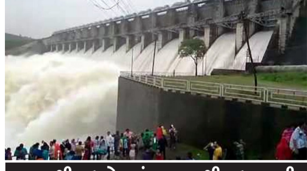
૨૦૦ થી વધુ ડેમમાં ૪૦ ટકાથી વધુ પાણી

રાજકોટ, તા. ૭ ગુજરાત રાજ્યમાં ચાલુ ચોમાસા દરમિયાન મેઘરાજાએ મહેર વરસાવવાનું શરૂ કર્યું છે, જેના કારણે રાજ્યના જળાશયોમાં પાણીની આવક નોંધપાત્ર રીતે વધી રહી છે. તાજેતરના અહેવાલો મુજબ, રાજ્યના કુલ ૨૦૬ જળાશયોમાં હાલમાં ૪૦.૧ ટકા જેટલો જળસંગ્રહ થયો છે. વરસાદી માહોલ જામતા ખેડૂતો અને જળાશયો પર નિર્ભર રહેતા વિસ્તારોમાં રાહતની લાગણી જોવા મળી રહી છે. સરકારી તંત્ર દ્વારા ડેમની જળ સપાટી પર સતત દેખરેખ રાખવામાં આવી રહી છે, જેથી કરીને નીચાણવાળા વિસ્તારોમાં સુરક્ષા જાળવી રાખવામાં આવી રહી છે. જળાશયોમાં પાણીની સતત થઈ રહેલી આવકને પગલે વહીવટી તંત્ર દ્વારા એડવાન્સ પ્લાનિંગ કરવામાં આવ્યું છે. ડેમમાં પાણીની સપાટી વધતા નીચાણવાળા વિસ્તારોમાં ભરાઈ શકતા પાણી અને સંભવિત પૂરની સ્થિતિને પહોંચી વળવા માટે ડિઝાસ્ટર મેનેજમેન્ટની ટીમોને સજ્જ રહેવા સૂચના આપવામાં આવી છે. ખાસ કરીને હાઈ એલર્ટ પર રહેલા જળાશયોના દરવાજા ખોલવા કે પાણી છોડવા અંગેની નિર્ણય પ્રક્રિયામાં તંત્ર અત્યંત સાવચેતી દાખવી રહ્યું છે. ખેડૂતોને પણ પોતાના પાક અને સાધન-સામગ્રીનું ધ્યાન રાખવા અપીલ કરવામાં આવી છે. વરસાદની ગતિવિધિને જોતા રાજ્યના ૫ ડેમ સંપૂર્ણપણે એટલે કે ૧૦૦ ટકા ભરાઈ ગયા છે, જે એક સકારાત્મક સંકેત છે. જેમાં રાજુલાના ધાતરવડી અને