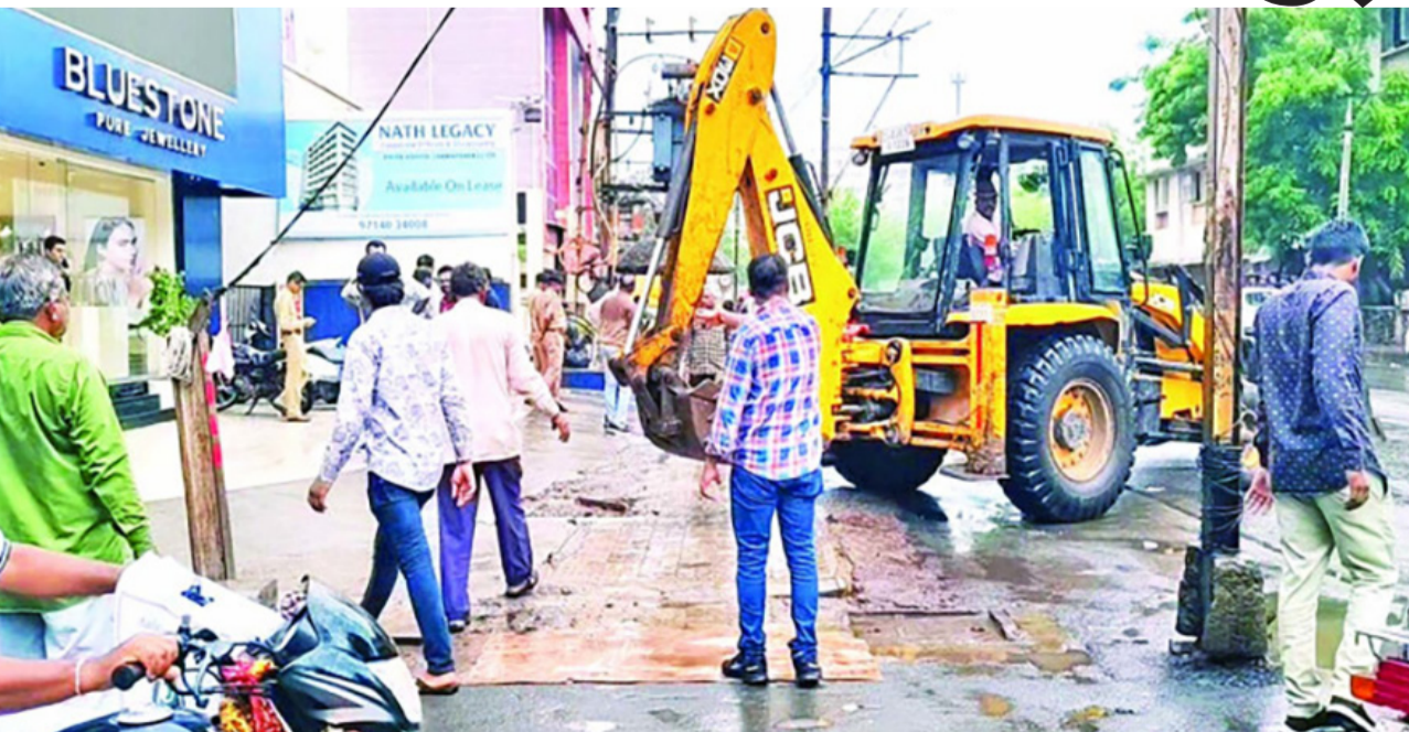
પાર્કિંગની સમસ્યા દૂર કરવા મનપાની મથામણ

છે. ટોઈંગ વાહનને આ રોડ પરથી રોજનું મોટું કલેક્શન છે. એક રીતે આવા રોડ પર ટ્રાફિક શિસ્ત માટે નહીં પરંતુ ટ્રાફિક પોલીસની કામગીરી વધુમાં વધુ દંડ એકત્ર કરવા થતી હોવાનું લાગે છે. આથી જ આવા રાજમાર્ગો પર પાર્કિંગ માટે વધુમાં વધુ જગ્યા ખુલી કરાવવી જોઈએ તેવું લોકો ઇચ્છી રહ્યા છે. આ કામગીરીમાં દબાણ હટાવ શાખાએ પણ અમુક જગ્યાએ રહેલા ચાના ગણા જેવા દબાણો ઉપાડી લીધા હતા. તો સોલીડ વેસ્ટ શાખાએ સફાઈની બાબતોનું નિરીક્ષણ કર્યું હતું. રાજકોટના દરેક રાજમાર્ગો પર આવી ડ્રાઈવ ચાલે તો પાર્કિંગ માટે વધુ જગ્યા ખુલી થાય તેમ લાગી રહ્યું છે. ખાસ કરીને આવા જુના રાજકોટના અનેક બિલ્ડીંગમાં રહેલી દુકાનોના પ્લાન દાયકાઓ પહેલા પાસ થયા હોય, પાર્કિંગની કોઈ જોગવાઈ જે તે વખતે ન હતી. પરંતુ જે જગ્યાએ પાર્કિંગ સ્પેસ છે તે પુરેપુરી જગ્યા ખુલી રહે તો વેપારીઓ અને ગ્રાહકોને પણ રાહત થાય તેમ છે. જોકે આજની કામગીરીની કોઈ સત્તાવાર માહિતી તંત્રએ ભુતકાળની જેમ જાહેર કરી ન હતી તે હકીકત છે!