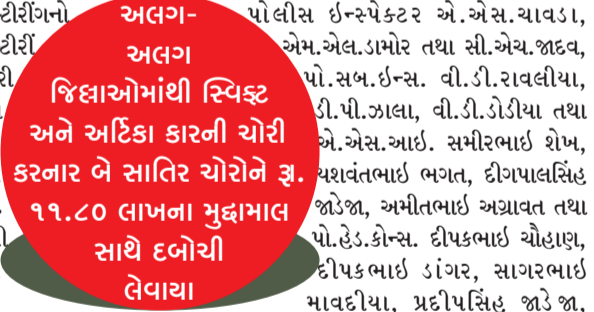
અલગ-અલગ જિલ્લાઓમાંથી સ્વિફ્ટ અને આર્ટિકા કારની ચોરી કરનાર બે સાતિર ચોરોને રૂ. ૧૧.૮૦ લાખના મુદ્દામાલ સાથે ઘડોચી લેવાયા