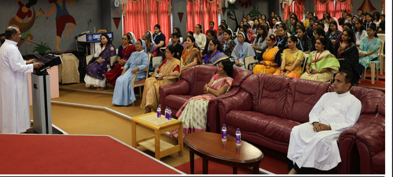
ઈન્ડસ્ટ્રીઅલ નિષ્ણાતોના માર્ગદર્શન સાથે કૌશલ્ય આધારિત તાલીમથી છાત્રોએ શરૂ કરી શૈક્ષણિક સફર

રાજકોટ, તા. ૮ ક્રાઈસ્ટ કોલેજ કેમ્પસ, રાજકોટ માટે શૈક્ષણિક વર્ષ ૨૦૨૬-૨૭ માટે નવા પ્રવેશ મેળવનારા વિદ્યાર્થીઓનું ઉત્સાહપૂર્વક સ્વાગત કરી ભવ્ય ઓરિએન્ટેશન ડેનું આયોજન કરવામાં આવ્યું હતું. વિદ્યાર્થીઓને કોલેજ જીવનની સફળ શરૂઆત સાથે જીવનકૌશલ્ય અને વ્યક્તિત્વ વિકાસ તરફ પ્રેરિત કરવાના હેતુથી અંતર્ગત વિવિધ નિષ્ણાતોના માર્ગદર્શન સાથે કૌશલ્ય આધારિત તાલીમ કાર્યક્રમનું આયોજન કરવામાં આવ્યું છે.