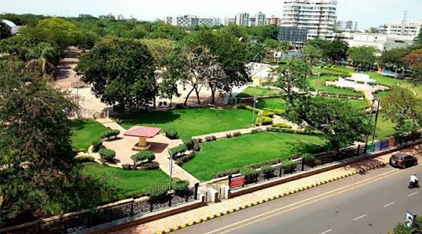
૨ સપ્ટેમ્બરથી રેસકોર્સમાં જન્માષ્ટમીનો પાંચ દિવસીય ભવ્ય લોકમેળો, તડામાર તૈયારીઓ શરૂ

રાજકોટ, તા. ૮ રાજકોટવાસીઓ જેની આખું વર્ષ આનુરતાથી રાહ જોતા હોય છે તે જન્માષ્ટમીના પરંપરાગત અને લોકપ્રિય પાંચ દિવસીય લોકમેળાનું કાઉન્ટડાઉન શરૂ થઈ ગયું છે. આગામી તા. ૨ સપ્ટેમ્બરથી રેસકોર્સ ગ્રાઉન્ડ ખાતે યોજનારા આ મેળા માટે રાજકોટ કલેક્ટર તંત્ર અને લોકમેળા સમિતિ દ્વારા યુદ્ધના ધોરણે તૈયારીઓ આરંભી દેવામાં આવી છે. મેળાનો પ્લાન, લે-આઉટ અને બ્લુપ્રિન્ટ આખરી ઓપમાં આવી ગયા હોવાથી આજે બપોર બાદ વિવિધ કમિટીઓની એક હાઈલેવલ બેઠકનું આયોજન કરવામાં આવ્યું છે, જેમાં મેળાના સુચારૂ સંચાલન માટેનો આખો એક્શન પ્લાન તૈયાર થશે. ગયા વર્ષના અનુભવો અને જનમેદનીને ધ્યાનમાં રાખીને આ વખતે વહીવટી તંત્ર સુરક્ષા અને હેલ્થ ઈમરજન્સી બાબતે અત્યંત ગંભીર છે. મેળામાં કોઈ અનિચ્છનીય ઘટના ન બને તે માટે યુસ્ત પોલીસ બંદોબસ્ત તહેનાત રહેશે. સમગ્ર રેસકોર્સ ગ્રાઉન્ડને સીસીટીવી કેમેરાના સર્કલમાં લઈ લેવામાં આવશે. કંટ્રોલ રૂમમાંથી ભીડ પર 'બાજ નજર' રાખવામાં આવશે જેથી અસામાજિક તત્વો પર લગામ કરી શકાય. આ ઉપરાંત, મેળાને ઝાકઝમાળ રોશનીથી શણગારવા માટે લાઈટિંગ, ડેકોરેશન અને અન્ય સુવિધાઓ માટેની ટેન્ડર પ્રક્રિયા પણ સત્તાવાર રીતે શરૂ કરી દેવામાં આવી છે. આગામી બે દિવસમાં જ કોર્મ વિતરણની તારીખો જાહેર થતાં સાથે જ રાજકોટ સહિત સમગ્ર સૌરાષ્ટ્રમાં લોકમેળાનો માહોલ બનાવરનો જામશે. આ ઉપરાંત લોકમેળામાં લોકોની સુરક્ષા જાળવવી રહે અને કોઈ અનિચ્છનીય ઘટનાઓ ન બને તે માટે યુસ્ત પોલીસ બંદોબસ્ત ગોઠવવામાં આવશે તેમજ મેડિકલ ઈમરજન્સી માટે બે ગ્રીન કોરીડોર બનાવવામાં આવશે. જેમાં કનવર્ટ પાસેથી અને જૂના એરપોર્ટ રોડ સામે આ ગ્રીન કોરીડોર બનાવશે. જેમાં એમ્બ્યુલન્સ, બાઈક વગેરે સહિતના વાહનો લોકમેળાના ગ્રાઉન્ડમાં