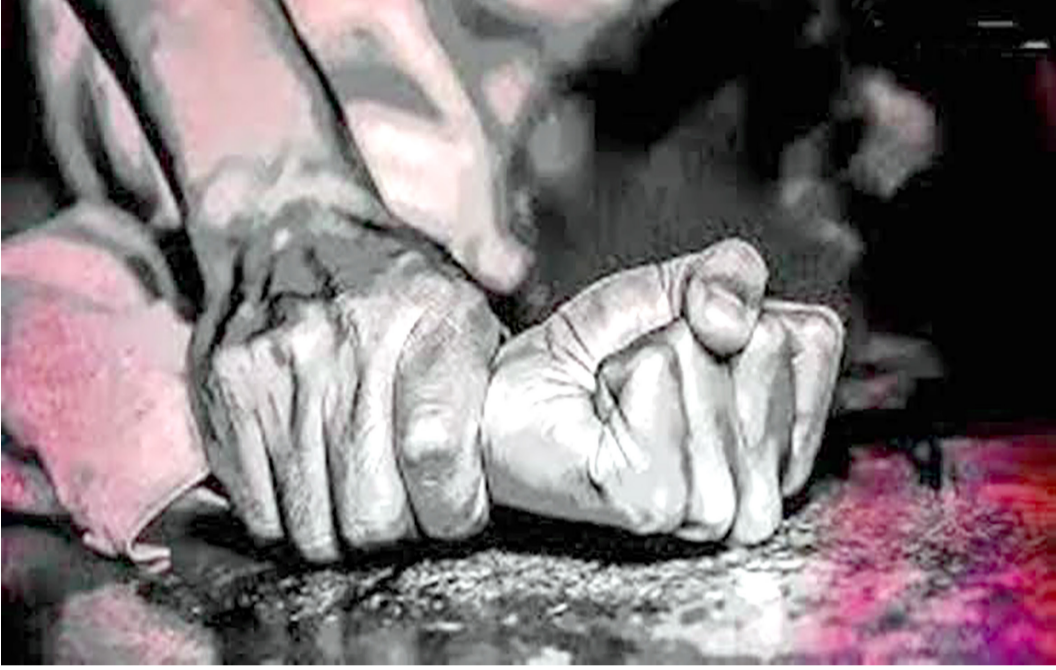
તેથી તેના માતા-પિતાને લાગ્યું કે, કોઈ પૂજારી દ્વારા પૂજાવિધિ કરાવવામાં આવે, તો દીકરીનો ગુસ્સો શાંત થઈ જશે અને તેના સ્વભાવની સમસ્યાઓ દૂર થશે. આ હેતુથી માતા-પિતાએ જ પૂજારીને ઘરે આવીને વિધિ કરવા માટે

આ સમગ્ર ઘટનાની વિગતો આપતાં ડીસીપી મંજીતા વણઝારાએ જણાવ્યું હતું કે પીડિતા તેના મિત્ર સાથે પોલીસ સ્ટેશને આવી હતી. તેણે પોલીસને આવીને જણાવ્યું કે, તેની સાથે આવું દુષ્કર્મ કરવામાં આવ્યું છે. આ બાબતે અમે તાત્કાલિક તપાસ શરૂ કરી હતી અને પોક્સો એક્ટની કલમો હેઠળ દાખલ કરવામાં આવ્યો છે. પ્રાથમિક તપાસમાં જાણવા મળ્યું હતું કે આ દીકરી અવારનવાર ગુસ્સો કરતી અને ચીડાઈ જતી હતી.