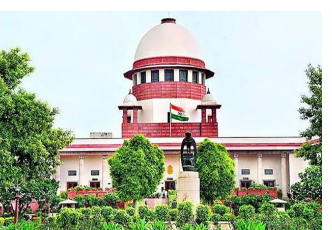
કાયદો માત્ર દેખાડો કરવા છે? હવે સીધા અધિકારીઓ જ જેલમાં જશે!