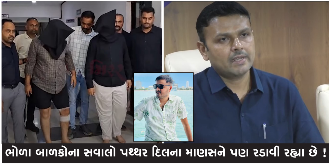
ભોળા બાળકોના સવાલો પથ્થર દિલના માણસને પણ રડાવી રહ્યા છે !

રાજકોટ, તા.૯ શ્રીકૃષ્ણ ગુરુસો કેવી રીતે એક હસતા-રમતા પરિવારનો માળો પીંખી નાખે છે, તેનો અત્યંત કંપાવનારો અને હૃદયદ્રાવક કિસ્સો રાજકોટના નાના મવા વિસ્તારમાંથી સામે આવ્યો છે. ગત રાત્રીએ શેરીમાં બાઈક ધીમે યલાવવાની સામાન્ય ટકોર મામલે થયેલી બોલાચાલીએ એવું સનસનાટીપૂર્ણ સ્વરૂપ ધારણ કર્યું કે તેમાં કાયરિંગ થયું