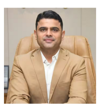
વિભાગના ઉચ્ચ અધિકારીઓને ટેલિફોનિક સૂચના આપી તાકીદે યોગ્ય પગલાં લેવા અને કામચી ઉકેલ લાવવા કડક આદેશો આપ્યા હતા. ગામને જોડતા વાહનવ્યવહારની સુવિધા સુધરે તે માટે પોલારપરને જોડતા કલેક્ટર ડો. ઓમપ્રકાશ સૌપ્રથમ પોલારપર ગામ ખાતે પહોંચ્યા હતા.

રાજકોટ, તા. ૯ રાજકોટ જિલ્લાના અંતરિયાળ અને ઘેવાડાના ગામડાઓ સુધી સરકારી યોજનાઓના લાભો પારદર્શક રીતે પહોંચે અને ગ્રામીણ સ્તરે વહીવટી પ્રક્રિયા વધુ સુદૃઢ બને તેવા આશય સાથે જિલ્લા કલેક્ટર ડો. ઓમપ્રકાશ એકાદમ મોડમાં આવ્યા છે. તાજેતરમાં જ તેમણે જિલ્લાના સરહદી અને અંતરિયાળ વિસ્તારમાં આવેલા પોલારપર અને રણજિતગઢ ગામની કોઈ પણ આગોતરા વહીવટી પ્રોટોકોલ વિના ઓચિંતી (સરપ્રાઈઝ) મુલાકાત લીધી હતી. આ મુલાકાત દરમિયાન તેમણે સ્થાનિક સ્તરે ચાલી રહેલા વિકાસકામોની ઝીણવટભરી સમીક્ષા કરી સ્થળ પર જ જરૂરી આદેશો આપ્યા હતા. કલેક્ટર