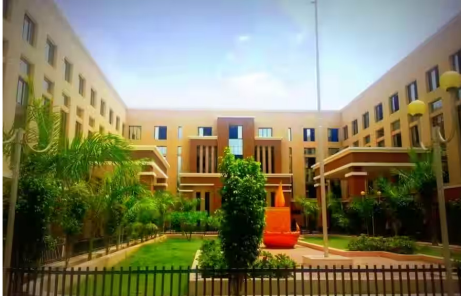
રાજકોટ, તા. ૯ મહાનગરપાલિકામાં જીપીએમસી (GPMC) એક્ટ હેઠળ રચવામાં આવેલી અને વર્ષ ૨૦૧૫ના