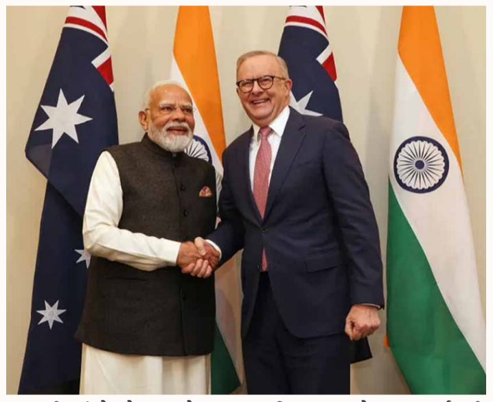
ભારત મુકી રહ્યું છે. કોલસા અને અન્ય પરંપરાગત સ્ત્રોતો પરની નિર્ભરતા ઘટાડવા માટે ન્યુક્લિયર એનર્જી એક સ્વચ્છ અને સ્થિર વિકલ્પ છે. આ ડીલ NSG (Nuclear Suppliers Group)ની સદસ્યતા ન હોવા છતાં ભારત માટે મોટી ઉપલબ્ધિ છે. ઓસ્ટ્રેલિયા પહેલાથી જ ભારત સાથે

નવીદિલ્હી, તા.૯ વડા પ્રધાન મોદી અને ઓસ્ટ્રેલિયાના વડા પ્રધાન અલ્બેનિઝે ઇન્ડોનેશિયાથી ઓસ્ટ્રેલિયા પહોંચી મહત્વપૂર્ણ કરારો કર્યા. ભારતના ડમ નરેન્દ્ર મોદી અને ઓસ્ટ્રેલિયાના PM એન્થોની અલ્બેનિઝ વચ્ચેની બેઠકમાં ભારતને ઓસ્ટ્રેલિયાથી વ્યાવસાયિક ધોરણે યુરેનિયમ સપ્લાય કરવાનો સિવિલ ન્યુક્લિયર એનર્જી કરાર થયો. આ ડીલથી ભારતના ન્યુક્લિયર પાવર પ્રોજેક્ટ્સને ગતિ મળશે અને સ્વચ્છ ઊર્જાના લક્ષ્યો પૂર્ણ થશે. સંરક્ષણ, સુરક્ષા અને કિટિકલ મિનરલ્સમાં પણ સહયોગ વધશે. ભારતના વડા પ્રધાન નરેન્દ્ર મોદી અને ઓસ્ટ્રેલિયાના વડા પ્રધાન એન્થોની અલ્બેનિઝ વચ્ચે યોજાયેલી બેઠક બંને દેશોના સંબંધોને નવી ઊંચાઈ આપી છે. ઇન્ડોનેશિયાથી ઓસ્ટ્રેલિયા પહોંચેલા PM મોદીની આ મુલાકાત વેપાર, સંરક્ષણ અને ઊર્જા સહયોગને પ્રોત્સાહન આપવાના હેતુથી હતી. બંને નેતાઓએ અનેક મહત્વપૂર્ણ કરારો પર હસ્તાક્ષર કર્યા,