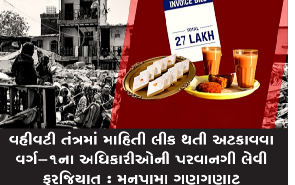
વહીવટી તંત્રમાં માહિતી લીક થતી અટકાવવા વર્ગ-૧ના અધિકારીઓની પરવાનગી લેવી ફરજિયાત : મનપાના ગણગણાટ

રાજકોટ, તા. ૯ મહાનગરપાલિકા (મનપા) માં છેલ્લા કેટલાક દિવસોથી ગાજેલા અને ભારે ચર્ચાસ્પદ બનવા રૂપિયા ૨૭ લાખના ફુડ બિલ કોમ્પાઉન્ડ/વિવાદ બાદ આખરે તંત્ર સફળ જાયું છે. પોતાની આખરૂં બચાવવા અને ભવિષ્યમાં આવી કોઈ સંવેદનશીલ કે વિવાદાસ્પદ માહિતી બહાર ન જાય તે માટે મનપા તંત્ર દ્વારા એક અત્યંત મહત્વનો અને આડરો નિર્ણય લેવામાં આવ્યો છે. મનપાના ઉચ્ચ વહીવટી તંત્ર દ્વારા એક સત્તાવાર પરિપત્ર જાહેર કરીને તમામ નાના-મોટા કર્મચારીઓ અને વિભાગીય વડાઓને આદેશ આપવામાં આવ્યો છે કે, "ઉચ્ચ અધિકારીની પૂર્વ મંજૂરી કે પૂછ્યા વગર કોઈ પણ પ્રકારની માહિતી, દસ્તાવેજો કે આંકડા મીડિયા અથવા ટ્રાફિટ વ્યક્તિને આપવા નહીં." તંત્રના આ આદેશને પગલે મનપા વર્તુળોમાં ભારે ફફટાટ વ્યાપી ગયો છે અને આ નિર્ણયને એક પ્રકારે 'માહિતી પર સેન્સરશિપ' તરીકે જોવામાં આવી રહ્યો છે. તાજેતરમાં મનપા દ્વારા યોજાયેલા એક સરકારી કાર્યક્રમ અથવા