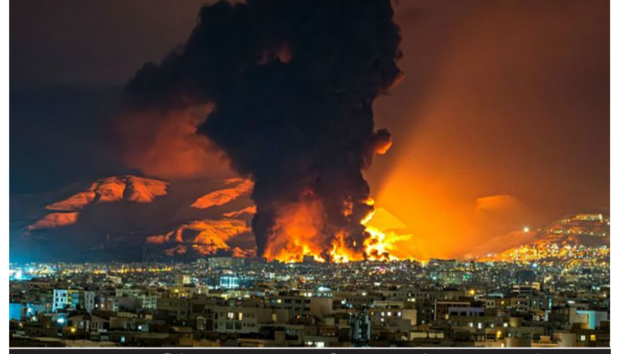
ભારતની ચિંતા વધી, પાકિસ્તાન કેમ ખુશ છે?

નવીદિલ્હી, તા. ૯ યુદ્ધવિરામ પછી પહેલી વાર અમેરિકાએ ઈરાનના વ્યૂહાત્મક ચાબહાર બંદર નજીક લક્ષ્મી કાર્યવાહી કરી છે. આ હુમલાથી પશ્ચિમ એશિયામાં તણાવ વધ્યો છે એટલું જ નહીં, પરંતુ ભારતના સૌથી મહત્વપૂર્ણ વિદેશી વ્યૂહાત્મક પ્રોજેક્ટ્સમાંના એક અંગે પણ ચિંતાઓ વધી છે. ચાબહાર બંદર માત્ર ભારત માટે બંદર નથી, પરંતુ મધ્ય એશિયા અને અફઘાનિસ્તાન માટે એક વ્યૂહાત્મક પ્રવેશદ્વાર છે. ભારતે બંદરના વિકાસ અને સંચાલનમાં ભારે રોકાણ કર્યું છે. આ ક્ષેત્રમાં સંઘર્ષ વધવાથી ભારતના વેપાર, કનેક્ટિવિટી અને વ્યૂહાત્મક હિતોને અસર થઈ શકે છે. યુએસ હુમલા બાદ, ચાબહારમાં અનેક વિસ્ફોટ અને વીજળી ગુલ થયાના અહેવાલો પ્રાપ્ત થયા છે. યુએસ