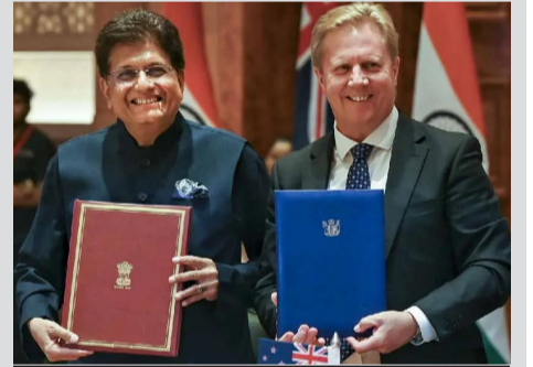
ભારત અને ન્યૂઝીલેન્ડ વચ્ચે ઐતિહાસિક ડીલ