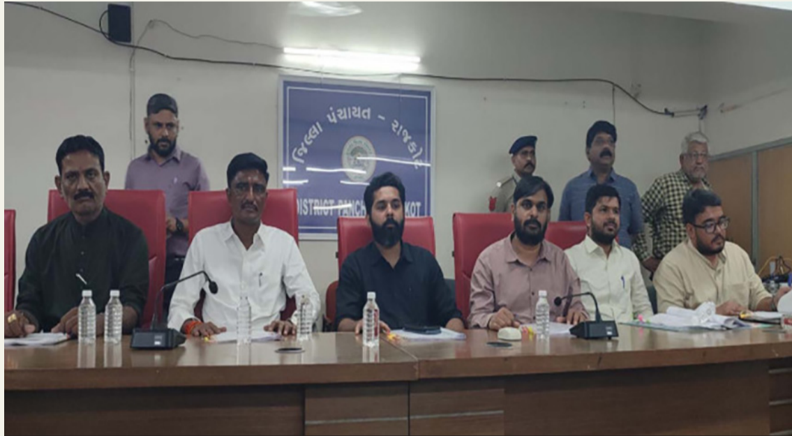
પ્રશ્નોત્તરી વિના જ સમિતિઓની રચના આટોપી લેવાઈ : સિનિયરોને માત્ર કારોબારીમાં સ્થાન, ચેરમેન પદ પર નવી પેઢીનો દબદબો

જિ. પંચાયતની સામાન્ય સભામાં ૯૬ કામોની મુદત ૩૧ માર્ચ ૨૦૨૭ સુધી લંબાવાઈ